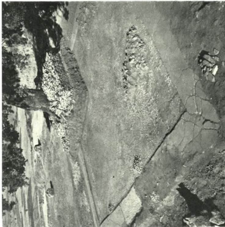
Δ. Μακεδονία. Ἀνάκτορον Βεργίνης: α. Δομάτια Α. τμήματος, β. Ἡ ὑποδομὴ τοῦ καμπύλου τοίχου