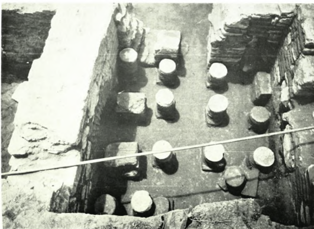
Ἄνω Ἀπόστολοι Κυλικίς: α-β. Ὑπόκαυστον Βαλανείου