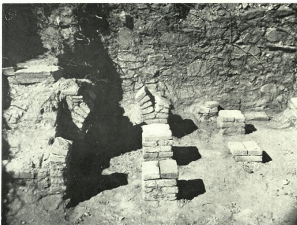
Ἵπόκαυστα Βαλανείων: α. ἼΑνω ἸΑποστόλων Κιλκίς, β. Παλατιανοῦ Κιλκίς ΦΩΤΕΙΝΗ ΠΑΠΑΔΟΠΟΥΛΟΥ