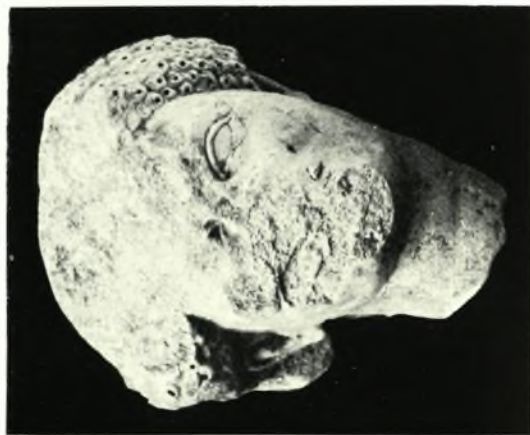
Καλαμιτών-Θεσσαλονίκης: α. Τάφος τραπεζοειδούς κατόψεως, β. Κορμός ἀγάλματος, γ. Εἰκονιστική κεφαλή, ἀπότμημα ἀναγλύφου, δ. Ἐπιτύμβιον ἀνάγλυφον Τορπλίας Ἐλπίδος (Θεσσαλονίκη)