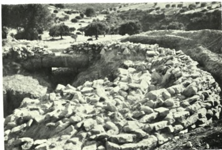
Μεσσηνία. Περιστεριά: α-β. Ύμυροχρόμος κεραμεική καί κύπελλον ΥΕ Ι ἐκ τῆς Ἐνατολ. Οἰκίας, γ. Θ. Τ. Ι. Δυτ. ἥμισυ ἐκ Β.