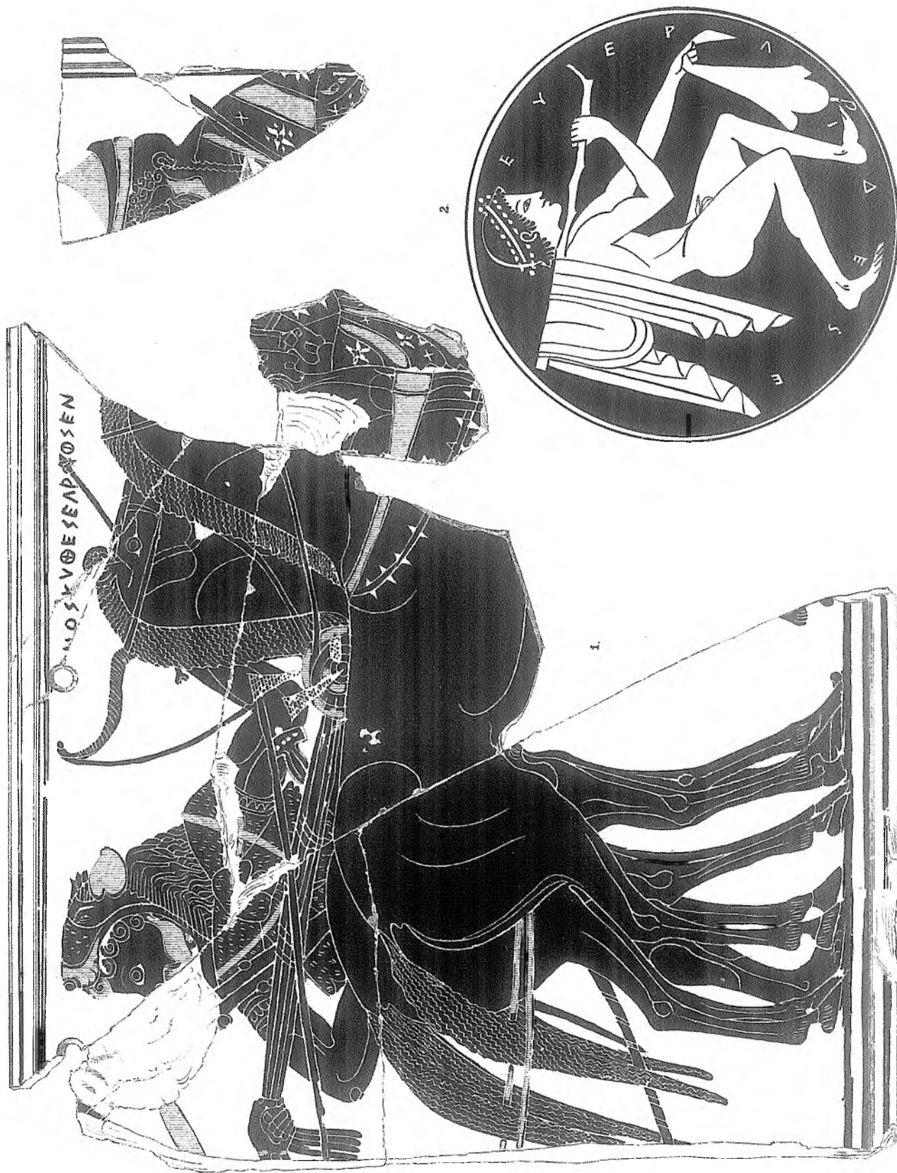
ΠΙΝΑΞ ΕΚ ΤΗΣ ΑΚΡΟΠΟΛΕΩΣ ΚΑΙ ΚΥΛΙΞ ΕΚ ΚΟΡΙΝΘΟΥ.