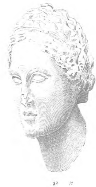
ΓΛΥΠΤΑ ΕΡΓΑ ΕΞ ΕΡΙΔΑΥΡΟΥ.