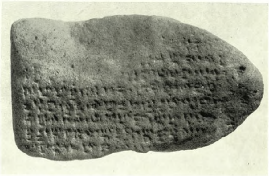
Εἰκ. 2 (κάτω).—Θραῦσμα πινακίδος 12ου π. Χ. αἰῶνος, ἐξ Ἐγκώμης.