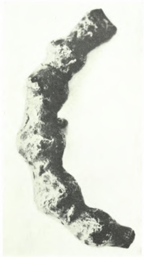
α. Ξυλόλυπτος μουσάντρα εκ Σύμης, β. Ξυλόλυπτον έρμάριον εκ Σύμης, γ. Χαλκή πόρπη εκ Λέρου