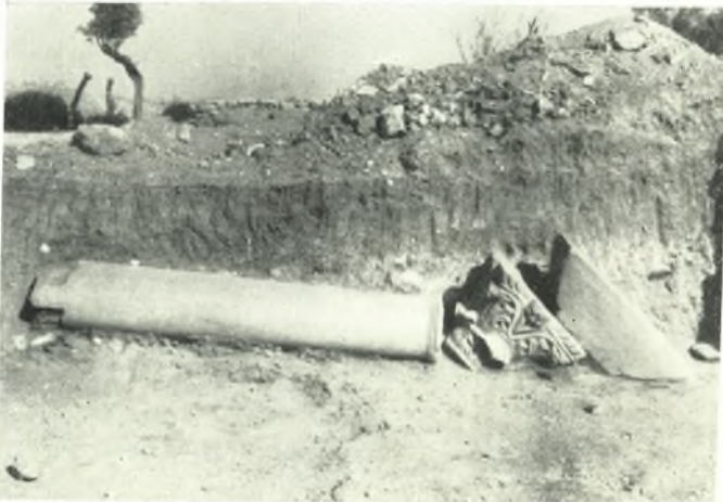
β. Ἐρριμμένον κίον μετὰ τοῦ κιονοκράνου καὶ τοῦ ἐπιθήματός του.