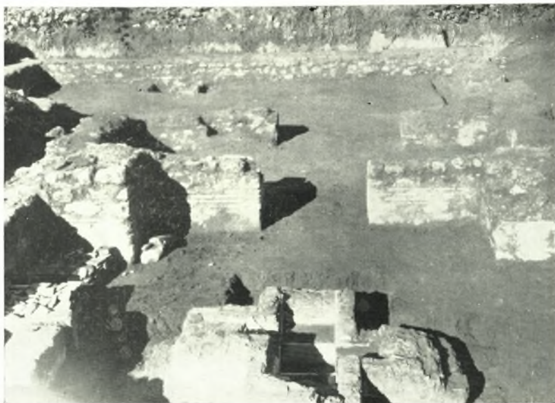
α. Προσκτίσματα νοτίως τοῦ νάρθηκος. *Αποψις ἐξ Α.