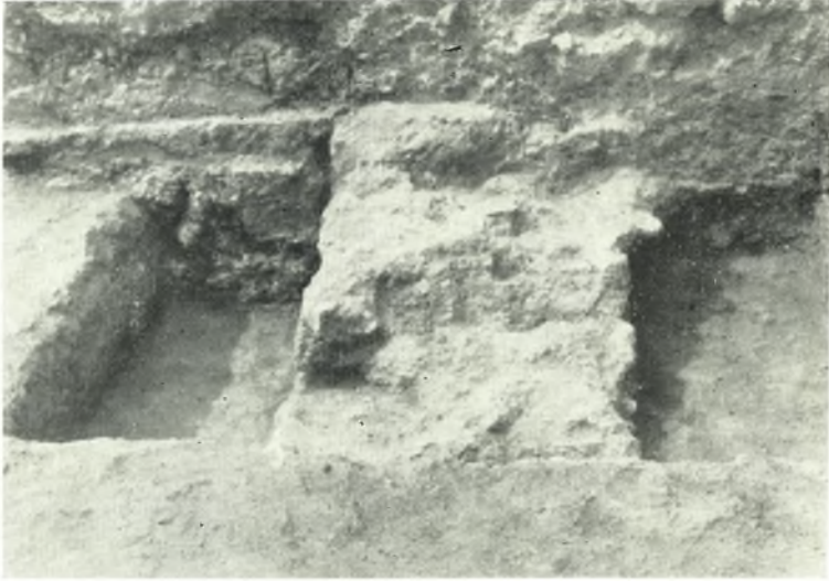
α. Λείψανον τοῦ ἀρχικοῦ νοτίου τοίχου τῆς νοτίως τοῦ νάρθηκος αἰθούσης. Δυτικὸν ἄκρον.