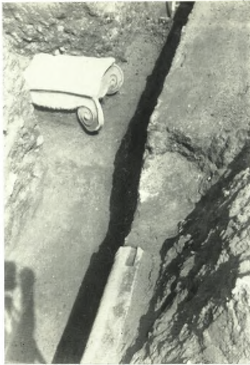
α. Ίωνικόν κιονόκρανον ἔξω τῆς νοτίας θύρας τοῦ ναοῦ.