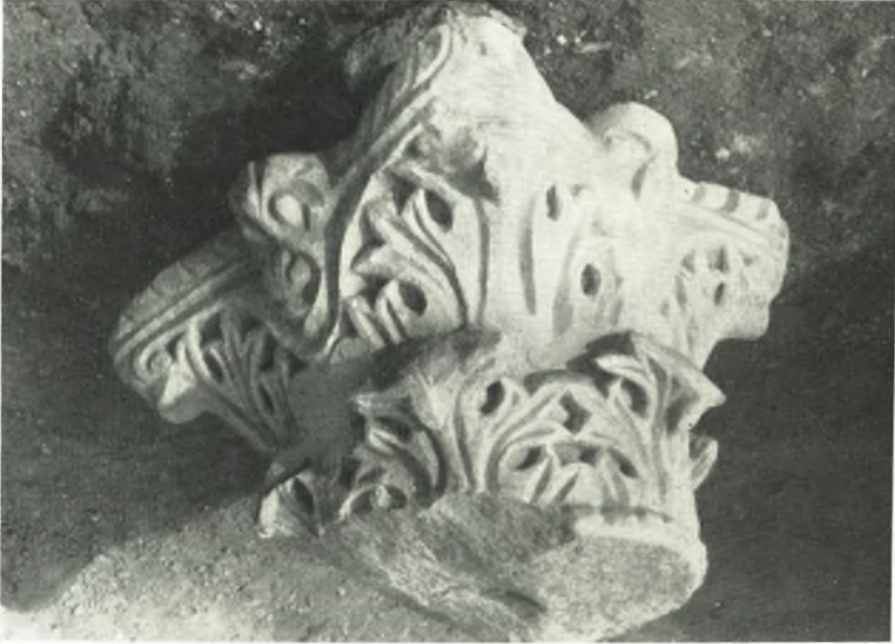
α. Κορινθιακὸν κιονόκρανον ἐκ τῆς νοτίας κιονοστοιχίας.