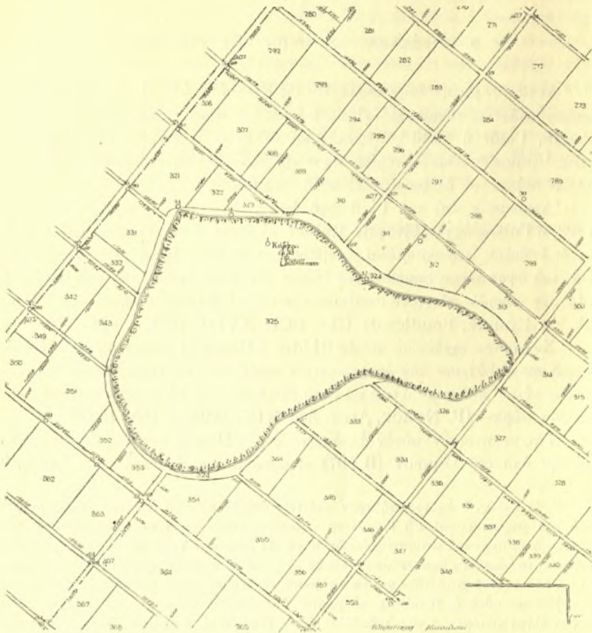
Εἰκ. 1. Ἡ ἀκρόπολις Γκλά (Ἄρνη).

ἄλλοι δὲ μὲ ἄλλας προϊστορικές πόλεις τῆς Βοιωτίας, χωρὶς ὅμως μέχρι σήμερον νὰ δυνάμεθα μετὰ βεβαιότητος νὰ τῆς ἀποδώσωμεν τοῦτο ἢ ἐκεῖνο τὸ