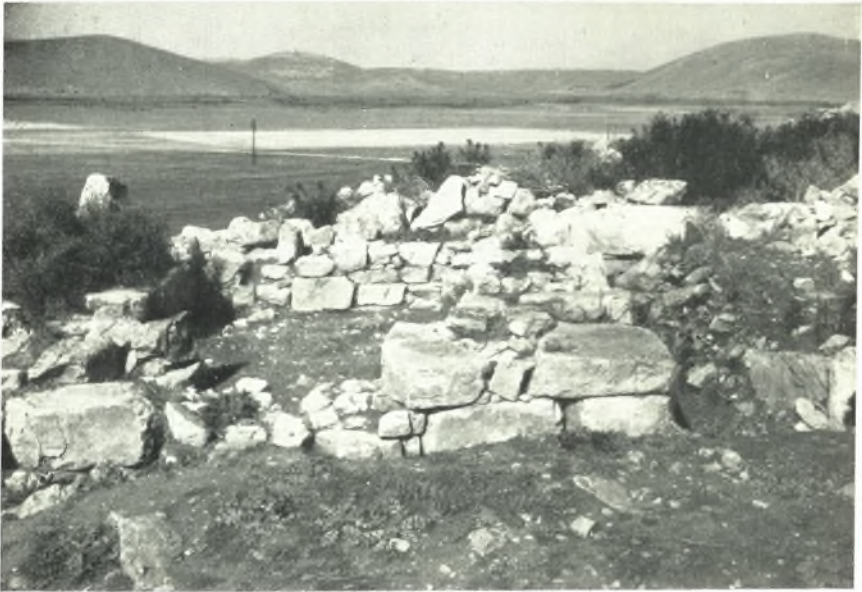
α. Δυτική πύλη Α. Θυρωρεΐτον.