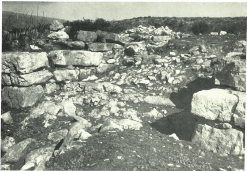
β. Δυτική πύλη Α. Λιθόστρωτον δάπεδον.