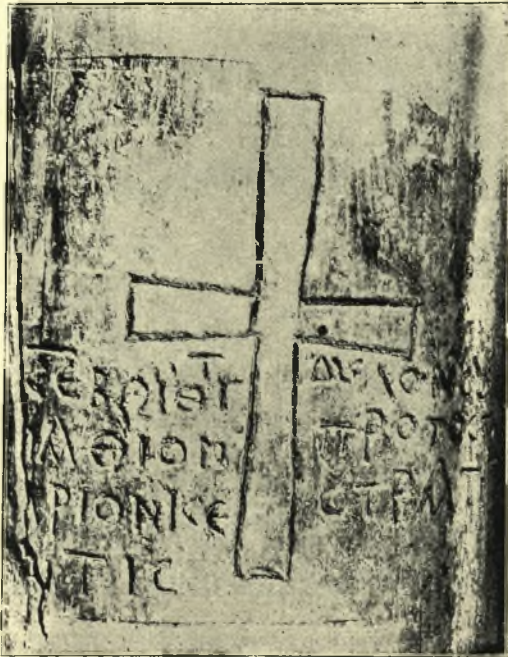
Εἰκ. 2. Ἡ ἐπὶ τοῦ κίονος ἐπιγραφὴ,

Κατὰ ταῦτα εἶναι ἀδύνατον νὰ γνωρίζωμεν, ἂν ἐπὶ τῆς θέσεως τῆς Μadonnina ὑπῆρχεν ἄλλη παλαιότερα βυζαντινὴ ἐκκλησία ἢ ἂν, ὅπερ τὸ πιθανώτερον, ὁ κίων μετεφέρθη ἄλλοθεν ἐκεῖ κατὰ τὴν οἰκοδομὴν τῆς. Καὶ ἤδη ἔλθωμεν εἰς τὴν ἐπὶ τούτου ἐπιγραφὴν (εἰκ. 2).