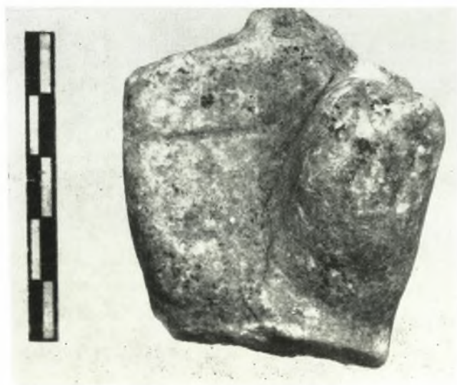
δ. Μεγαρῖνη χεὶρ ἐκ τοῦ ναοῦ τοῦ Ἐπικούριου Ἀπόλλωνος.