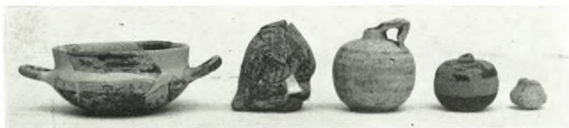
α. Ἀρχαῖκὰ ἀγγεῖα ἐκ τῶν ἀνασκαφῶν εἰς ναὸν Βασσῶν.