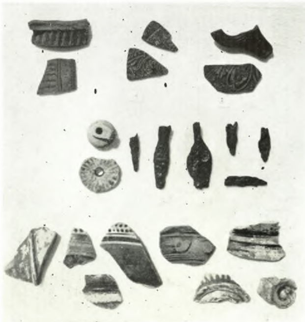
β. Ὅστρακα ἀρχαϊκῶν (σειρὰ μεσαία καὶ κατωτέρα) καὶ ἐλληνιστικῶν (σειρὰ ἀνωτέρα) χρόνων.