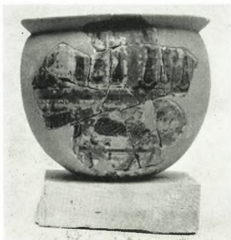
β. Ἀγγεῖον ἀνατολίζοντος ρυθμοῦ.