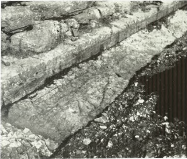
α. Τὸ λάξευμα τοῦ βράχου πρὸ τῆς Α. εἰσόδου τοῦ ναοῦ τοῦ Ἐπικούριου Ἀπόλλωνος.