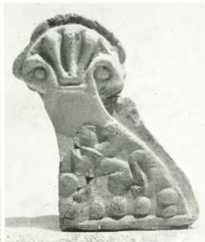
γ. Ἀκροκέραμας προῖκτινείου ναοῦ Βασσῶν.