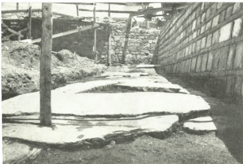
α. Λιθόστρωτον ρωμαϊκῆς - βυζαντινῆς ἑδοῦ βόρειοανατολικῶς τῆς βασιλικῆς τοῦ Ἁγίου Δημητρίου.