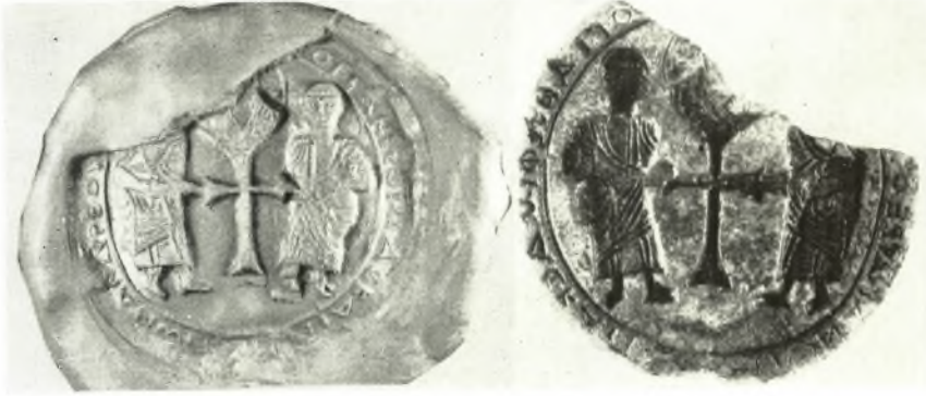
α. Λιθίνη σφραγίς εὐλογίας (1. Θετικών 2. ἀνητηκόν).