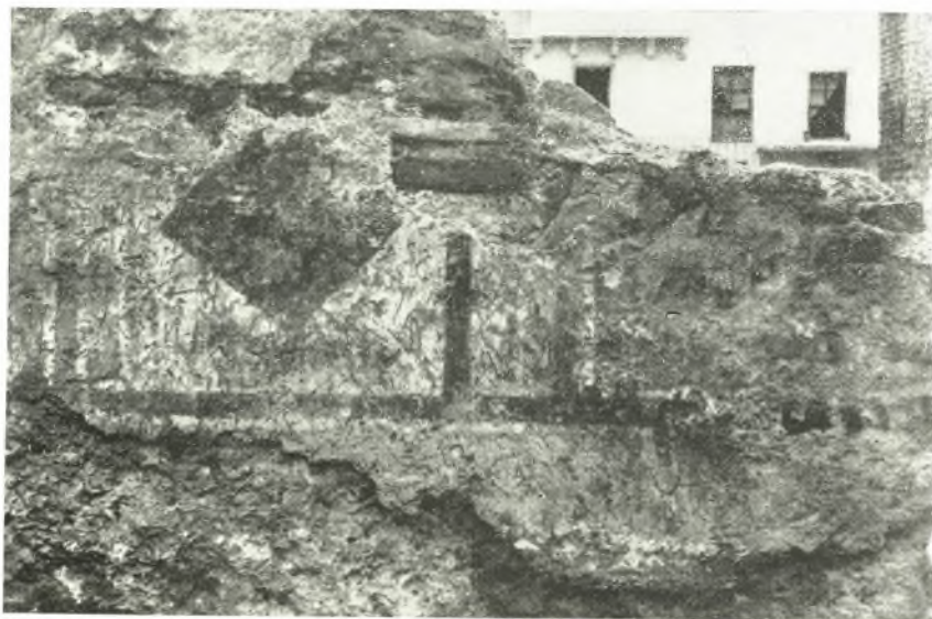
β. Ὑπολείμματα τοιχογραφιῶν τοῦ νεκρικοῦ παρεκκλησίου.