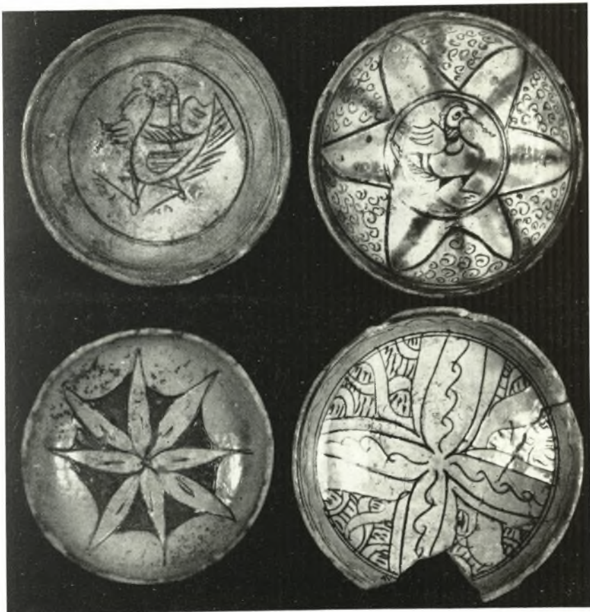
β. Ἄγγεϊα ἐκ τῶν τάφων.