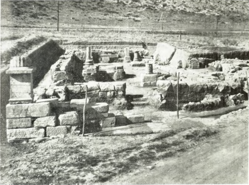
α. Ἀποψις τοῦ ναοῦ τῆς Αὐλιδαίας Ἀρτέμιδος ἀπὸ Ἀνατολῶν μετὰ τὴν πλήρη ἀνασκαφὴν τοῦ καὶ τὴν ἐν μέρει ἀποκατάστασιν τῶν πλευρῶν τοῦ.