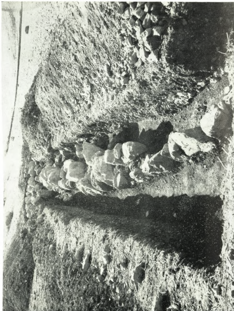
‘Ο με κατεύθυνσιν ἀπὸ Ν. πρὸς Β. μακρότερος τῶν ὑπὸ τὴν προϊστορικὴν ἀκρόπολιν ἀνασκαφέντων τοίχων με ἐμφανῆ τὴν πρὸς τὰ Β.Δ. καμτὴν αὐτοῦ.