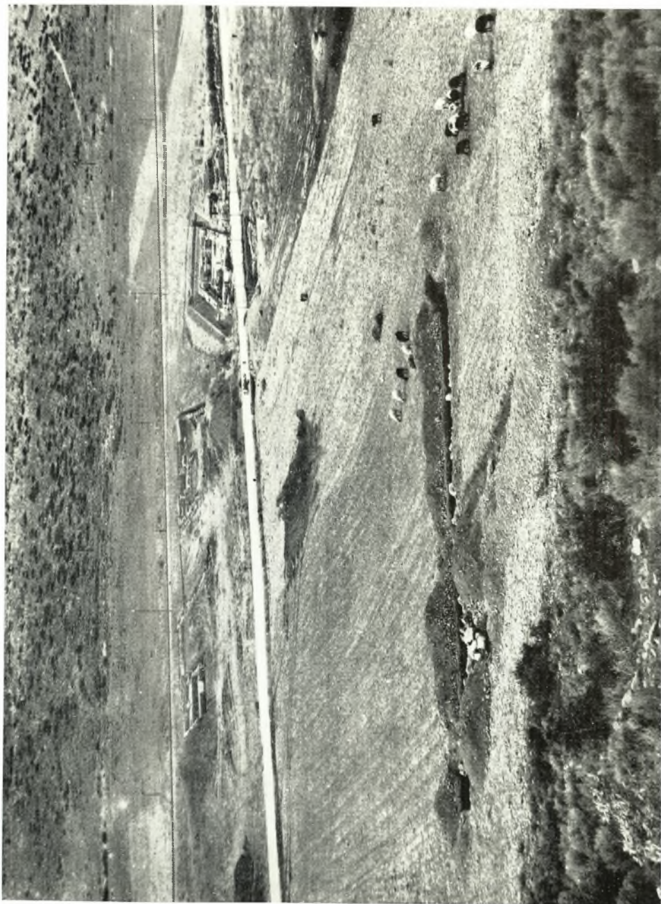
Ἡ ἀνασκαφή εἰς τὰς δυτικὰς ὑποφείας τῆς προϊστορικῆς ἀξροπόλεως τῆς Ἀγίδος.