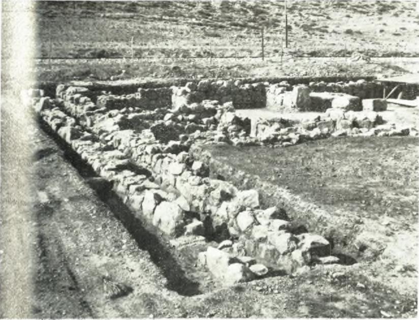
α. Τὸ τρίτον ἀπὸ Νότου κτήριο μετὰ τῶν διαμερισμάτων του, τῆς ἐργαστηριακῆς τραπέζης, τῶν βάσεων τῶν κίωνων καὶ τοῦ προφυλακτικῶς ἐστεγασμένου ἥδη κλιβάνου.