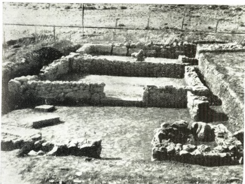
α. Τὸ Καταγόγιον (κτήριο Μ).