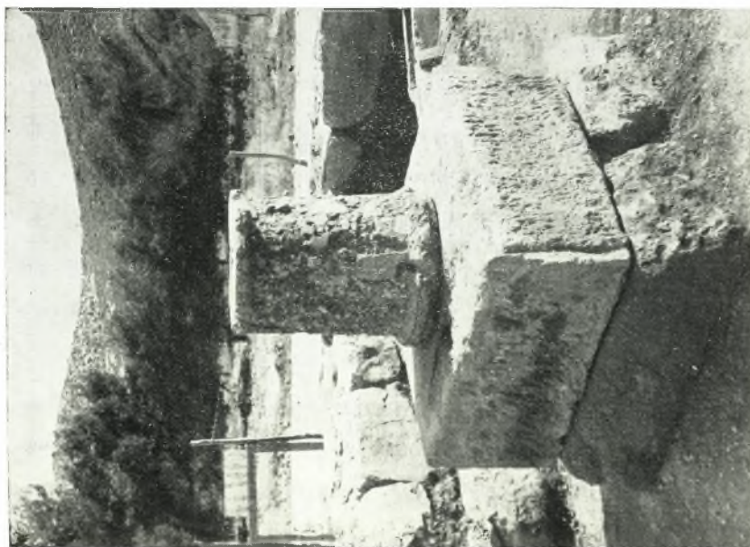
α. Θησαυρὸς ἐπὶ παλαιότερας βάσεως ἐλλοῦ Θησαυροῦ τοῦ 8ου π.Χ. αἰῶνος.