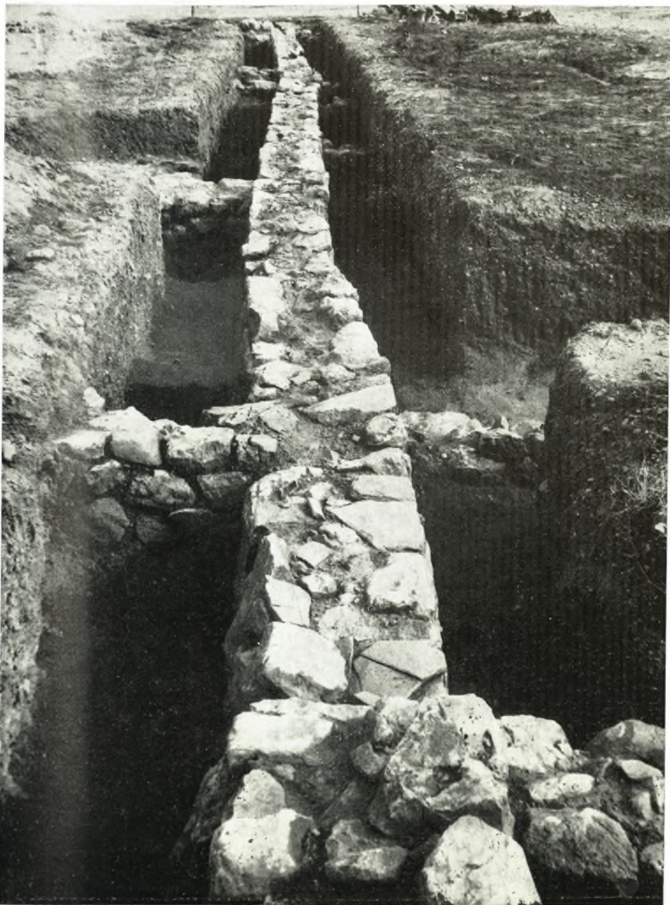
Ό μεταξύ του Καταγωγίου και του δευτέρου από Νότου κτηρίου τοίχος.