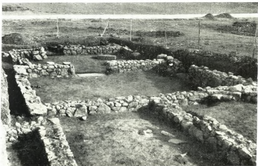
β. Τὸ Καταγόγιον ἀπὸ Δυσμῶν.