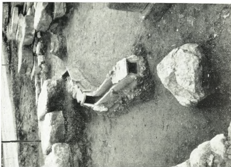
β. 'Ο ἐκ τοῦ ἵστερορομαιαῖκου λουτροῦ ἀφελεῖς κατὰ ζώων ἐντὸς τοῦ σηκοῦ ἀγωγός.