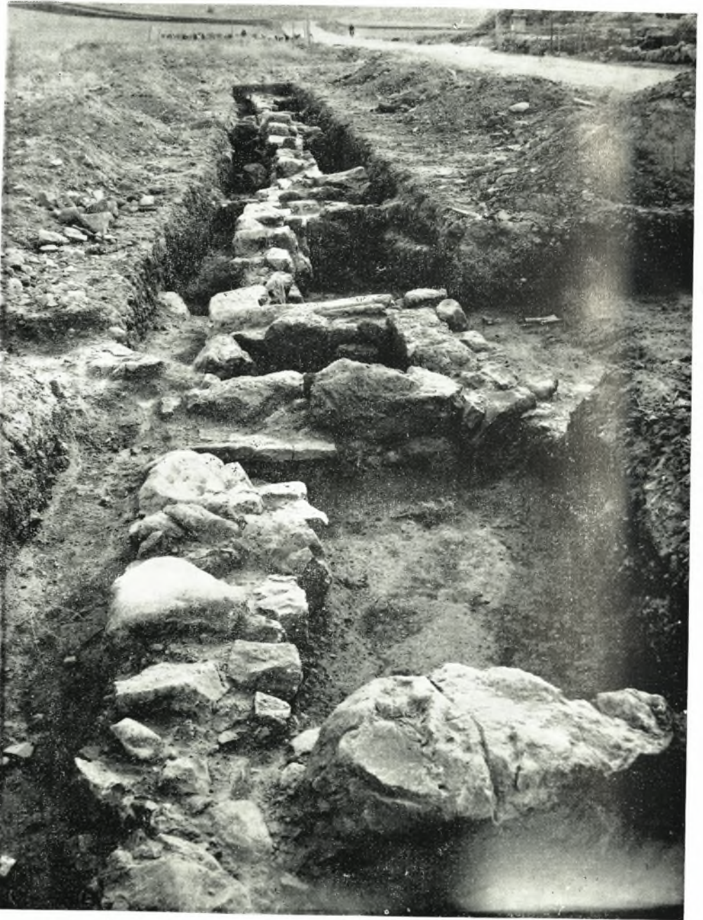
Τὰ πρὸς Β. τῆς κρήνης καὶ παρὰ τὸν καταχωσθέντα μυχὸν τοῦ λιμένος Μικρὸ Βαθὺ ἀποκαλυφθέντα κτίσματα.