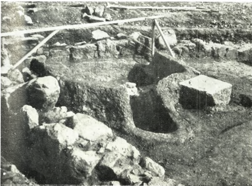
β. Ὁ κεραμικὸς κλιβάνος.