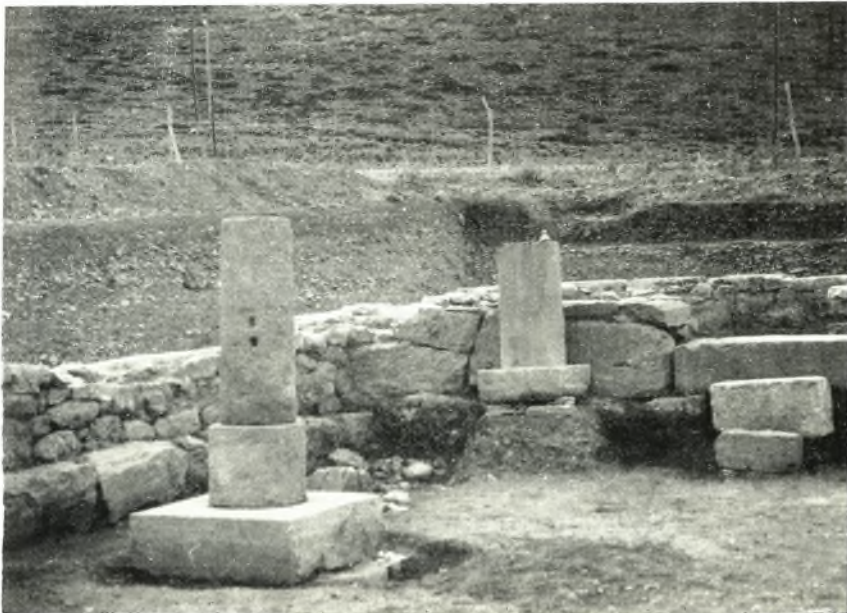
β. Τὸ κατὰ τὴν ΝΔ. γωνίαν τοῦ σηκοῦ ἀποκαλυφθὲν παλαιότερον λιθόστρωτον.