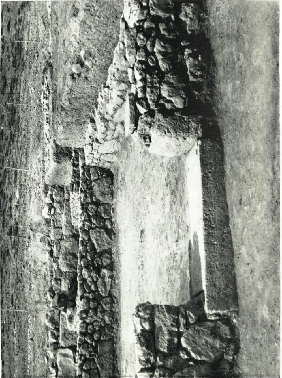
‘Ο εξ ὀρθογωνίων παραλλήλων δυτικός τοίχος τοῦ Κατακόγιου· εἰς τὸ βάθος καὶ ἔμπρός τὸ καλῶς διατηρούμενον κατώφλιον τοῦ ἑνδεκακλίνου.