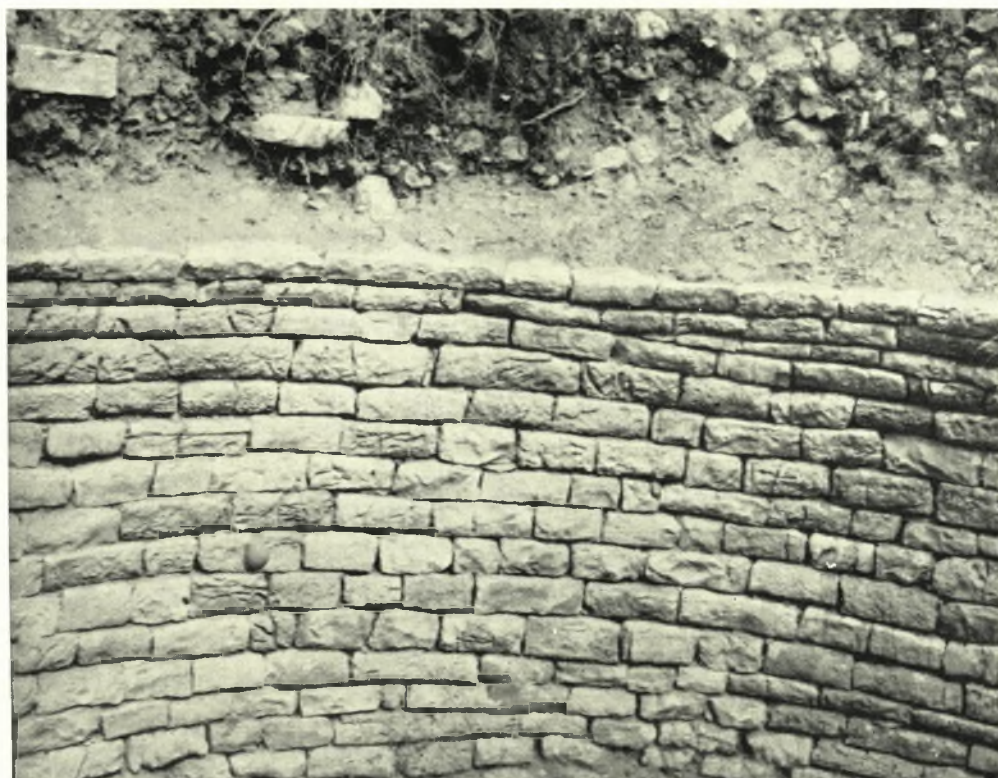
Αίτωλοακαρνανία. Ίθωρία ("Άγιος Ἡλίας Μεσολογγίου): α - β. Θολωτός τάφος Μαραθιά 1 πρὸ καὶ μετὰ τὰς ἐργασίας στερεώσεως ( τῶν τριῶν ἀνωτάτων δόμων ἢ στερέωσις εἶναι προσωρινή )