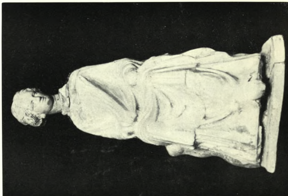
Αιτωλοακαρνανία. Πάλαιρον: α - β. Προσθή και πλεγία όγης έλληγιστικου ειδωλιου κόρης