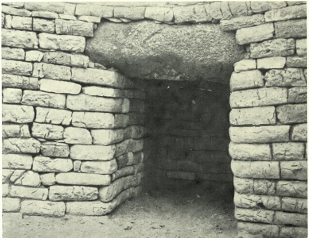
Αίτωλοακαρνανία. Ίθωρία ("Άγιος Ἡλίας Μεσολογγίου) : α - β. Θολωτὸς τάφος Μαραθιά 1 πρὸ καὶ μετὰ τὰς ἐργασίας στερεώσεως