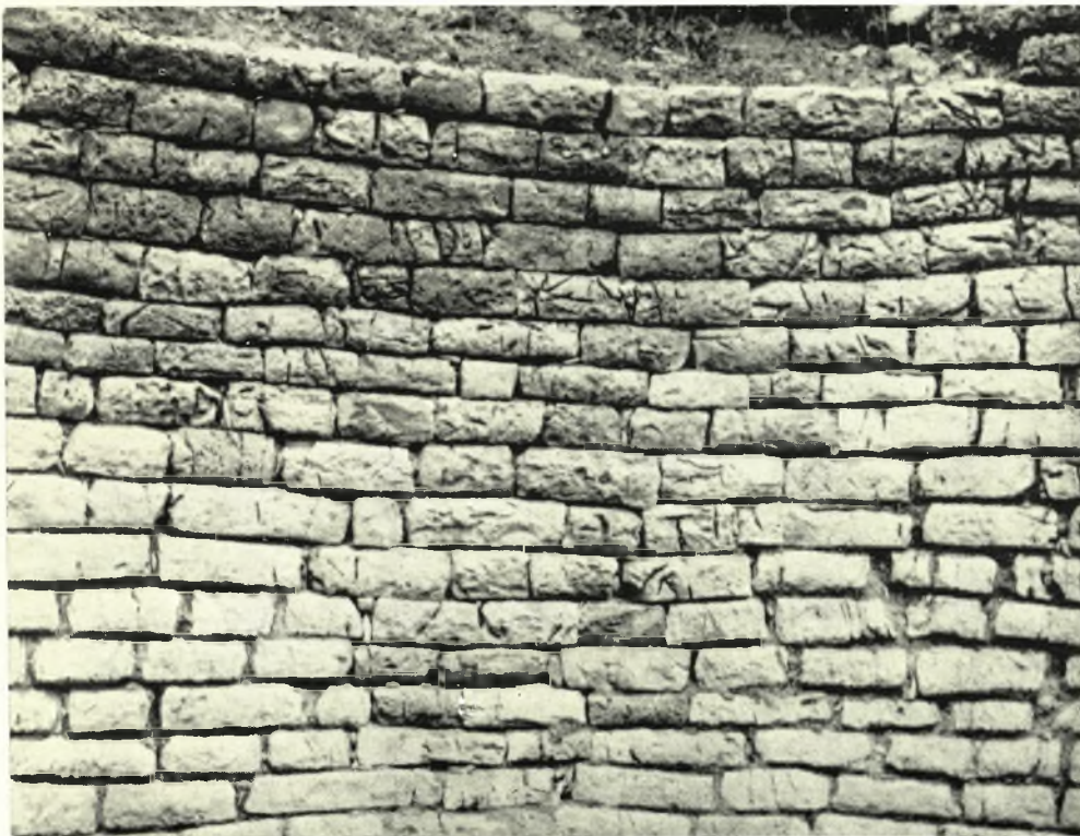
Αιτωλοακαρνανία. Ίθωρία (Άγιος Ήλιος Μεσολογγίου): α - β. Θολωτός τάφος Μαραθιά 2 πρό και μετά τās έργασίας στερεώσεως