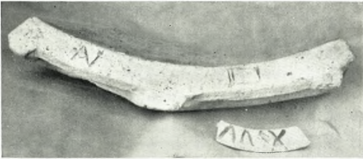
β. Ταμάχιον πήλινου ἐπιγεγραμμένου ἀγγείου.