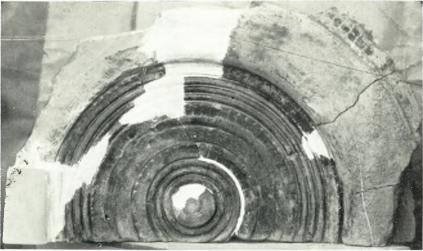
α. Πήλινον ἡμικυκλικὸν ἀκρωτήριον.