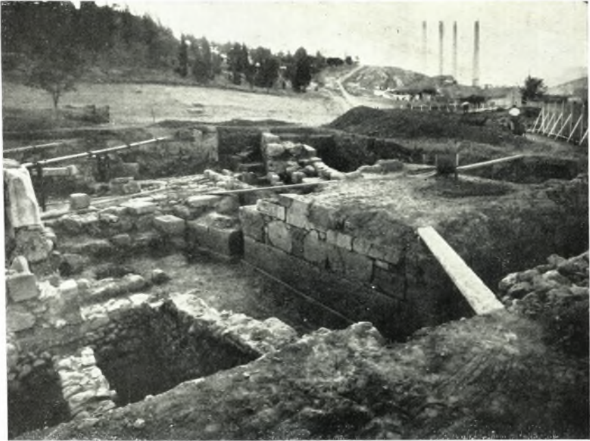
α. Ἀποψις τῶν Ἀστυδε Πυλῶν.