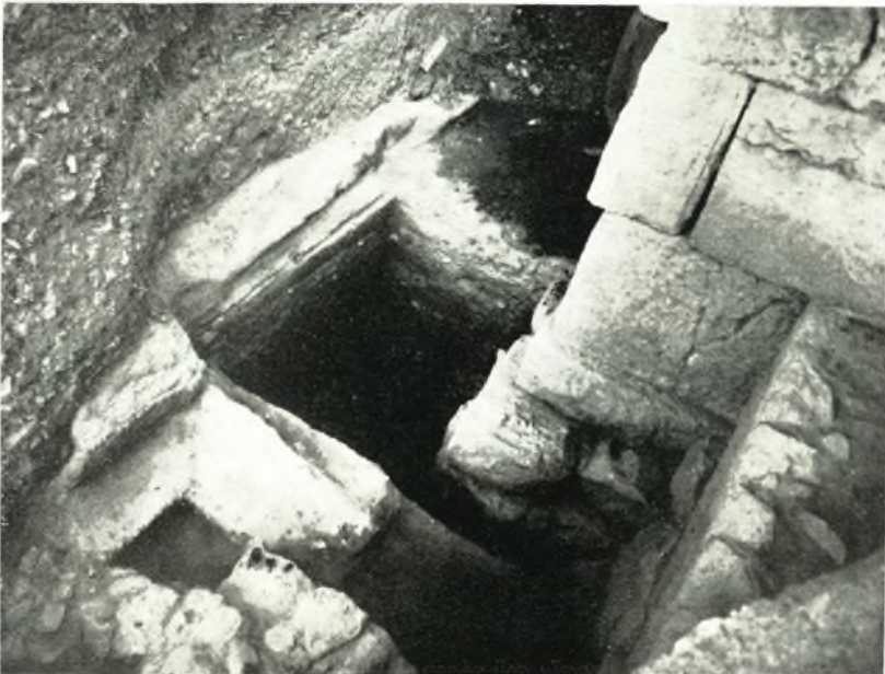
β. Δοκιμαστικὴ ἔρευνα παρὰ τὴν νοτιοδυτικὴν γωνίαν τοῦ Πεισιστρατείου τείχους.