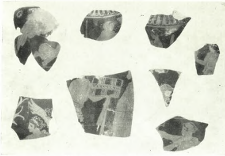
α. Τμήματα ἐρυθρομόρφων λουτροφόρων.