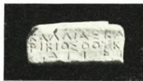
γ. Τμήμα ἐπιγραφῆς.