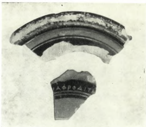
α. Τμήματα πινακίου με ἐγχάρακτον ἀναθηματικὴν ἐπιγραφὴν εἰς τὴν Ἀφροδίτην.