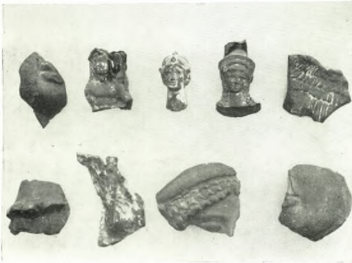
β. Τμήματα κλασικῶν ἀγγείων, προσωπέων καὶ εἰδωλῶν.