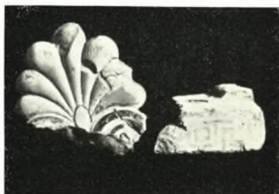
δ. Πήλινα ἀρχιτεκτονικὰ μέλη.