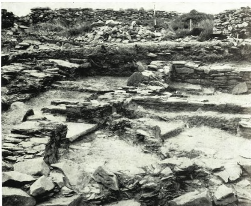
α. Τὰ δωμάτια J4 καὶ J5 καὶ ὁ διάδρομος J3. Ἐποψία ἀπὸ Ἀνατολῶν.