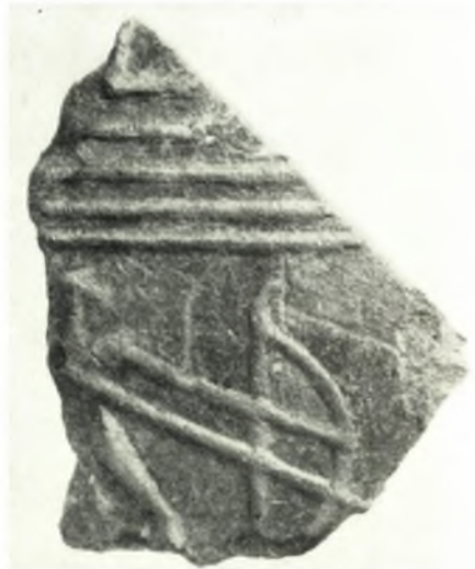
β. Τεμάχιον πλῆθος τῆς γεωμετρικῆς ἐποχῆς μετ' ἀναγλύπτου παραστάσεως τοξότου.