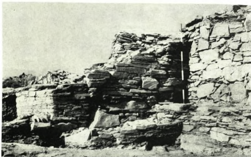
β. Ἡ πύλη τοῦ τείχους τοῦ συνοικισμοῦ Ζαγορᾶς πλησίον τοῦ νοτίου τέρματος αὐτοῦ. Διακρίνονται ὁ βόρειος πυλὼν καὶ ὁ προμαχῶν πλησίον αὐτοῦ. Ἐποψία ἀπὸ Ἀνατολῶν.