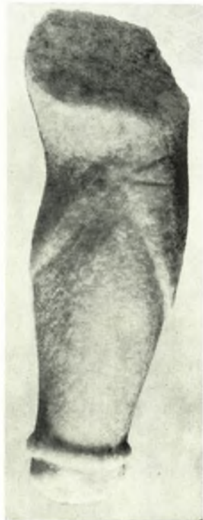
δ. Βραχίλιον μαρμαρινῆς μορφῆς τοῦ τύπου ἀρχαϊκῆς κόρης.