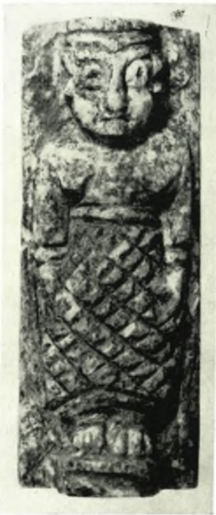
γ. Μικροσκοπικὸν ὀστῆινον (;) περιάπτον μετὰ παραστάσεως γυναικείας μορφῆς ἢ θεᾶς.