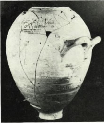
α. Γεωμετρικόν ἀγγεῖον εὑρεθὲν ἐπὶ τοῦ δαπέδου τοῦ δωματίου J5.