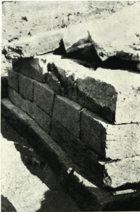
β. Νοτιοανατολική άποψις τῆς κρηπίδος τοῦ βωμοῦ.