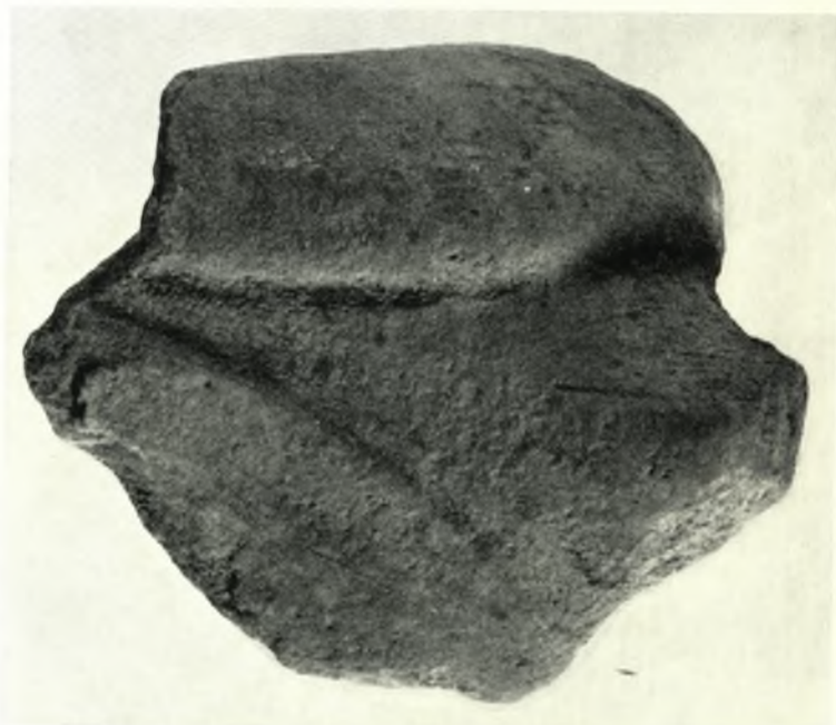
Κινητὰ εὐρήματα ἐκ τοῦ Ἱεροῦ τῆς Ἀφροδίτης Ἐρυκίνης. Ἄνω: χαλκαῖ περόναι. Κάτω: Πήλινον εἰδώλιον περιστερᾶς (ἀποκεκρομένον).