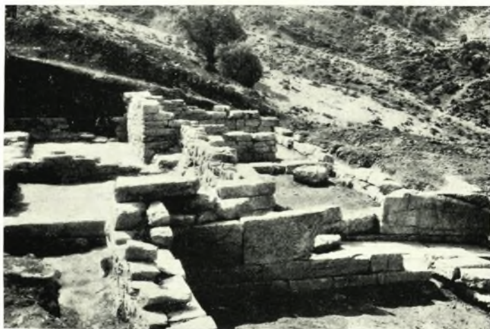
β. Ἡ ἀπὸ Δυσμῶν ἄποψις τῆς Κρήνης καὶ τῆς ὀπισθεν ταύτης Οἰκίας.