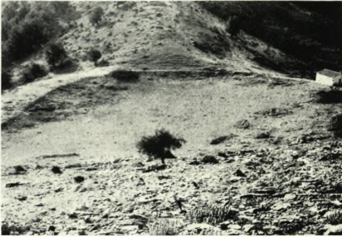
α. Νοτιοανατολική άποψις τοῦ σταδίου.