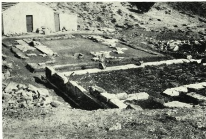
α. ΒΔ. ἄποψις τοῦ Τελεστηρίου μετὰ τῶν δύο ναῶν εἰς τὸ βάθος.