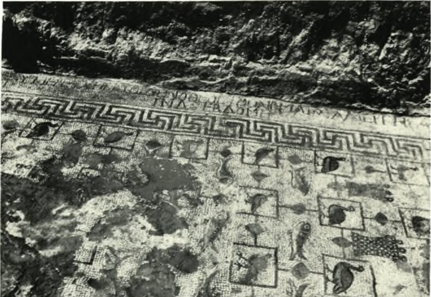
β. Ἡ εὐρεθεῖσα ψηφιδωτὴ ἐπιγραφὴ ἐπὶ τοῦ δαπέδου τοῦ ὀρθογώνιου χώρου κατὰ προέκτασιν τοῦ νάρθηκος τῆς βασιλικῆς Γ.