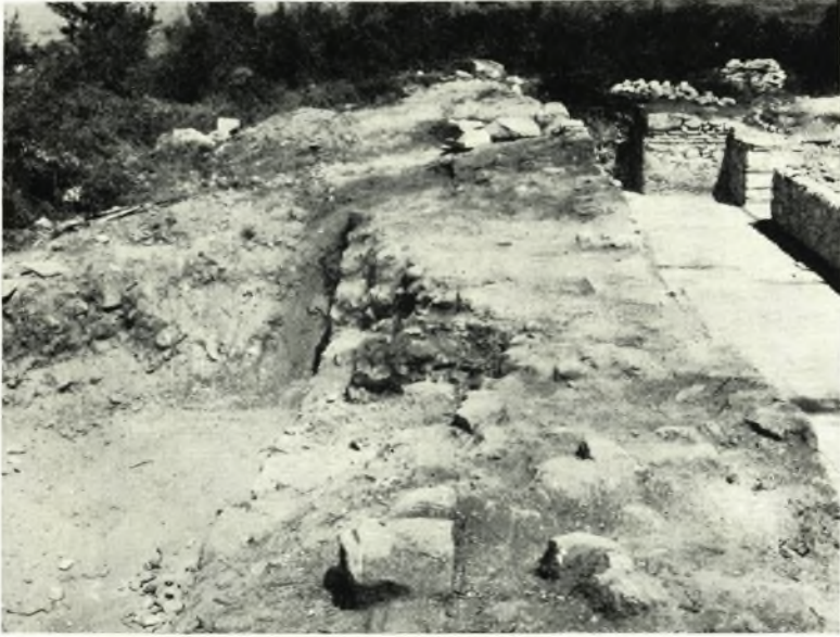
α. Ὁ δυτικός τοίχος τοῦ νάρθηκος. Δεξιά καὶ ἐν ἐπαφῇ ὁ μεταγενέστερος τοίχος πάχους 1.50 μ.