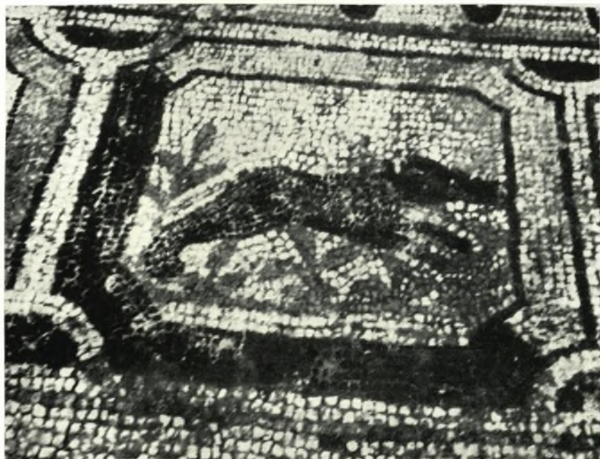
β. Ὁ μετὰ τοῦ τρέχοντος κινὸς πίναξ.