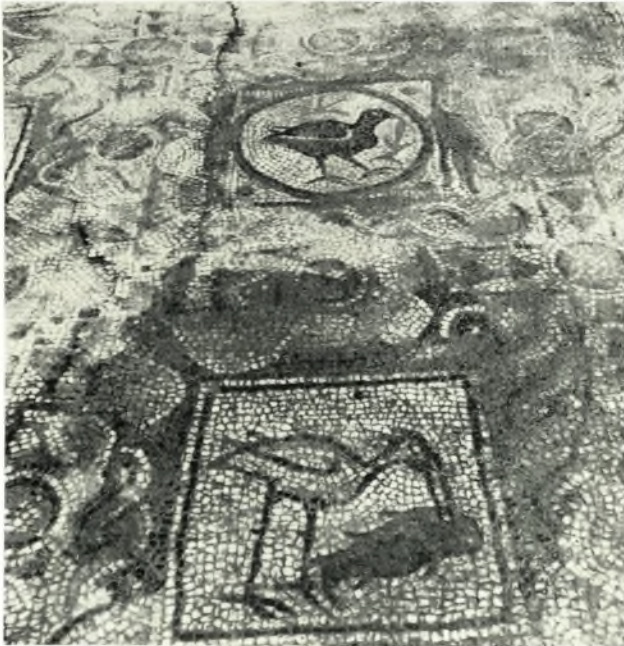
β. Νότιον κλίτος. Πτηνὰ τὰ ὅποια τρώγουν ἰχθῦς.