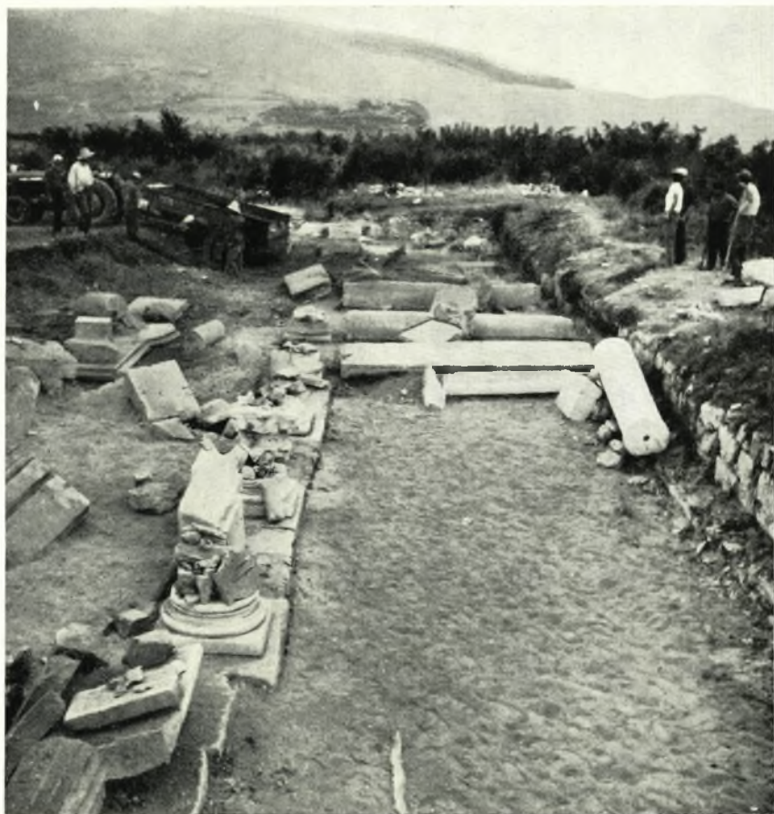
Τὸ νότιον κλίτος τῆς βασιλικῆς Α μετὰ τοὺς κορμούς τῶν κίονων εἰς τὸ μέσον τμήμα αὐτοῦ.