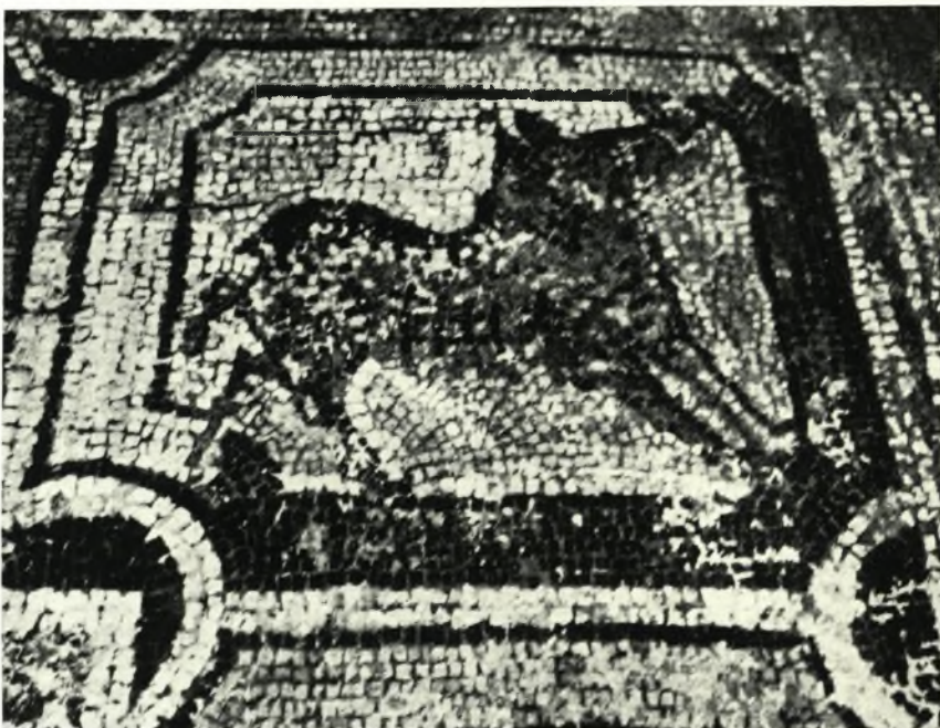
β. Ὁ εἰς τὸν γωνιαῖον πίνακα ἀγριόχοιρος.