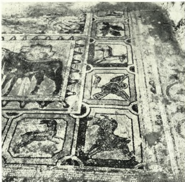
α. Τὸ παρά τὴν ΝΔ. γωνίαν τοῦ ἐξωνάρθηκος τῆς βασιλικῆς Α εὗρεθὲν διαμέρισμα μὲ τὰ ἀποκαλυφθέντα ψηφιδωτά.