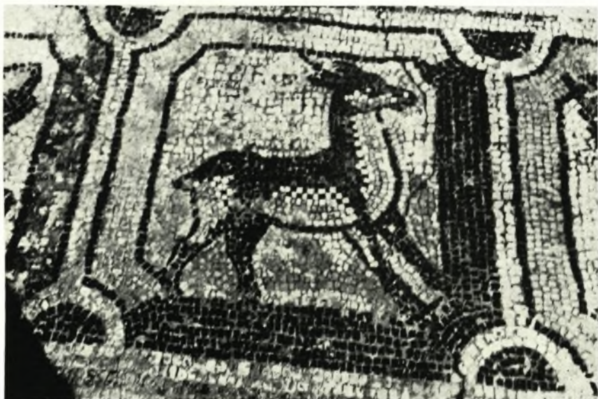
β. 'Ο μετὰ τῆς δορκάδος (ζαρκάδι) πίναξ.