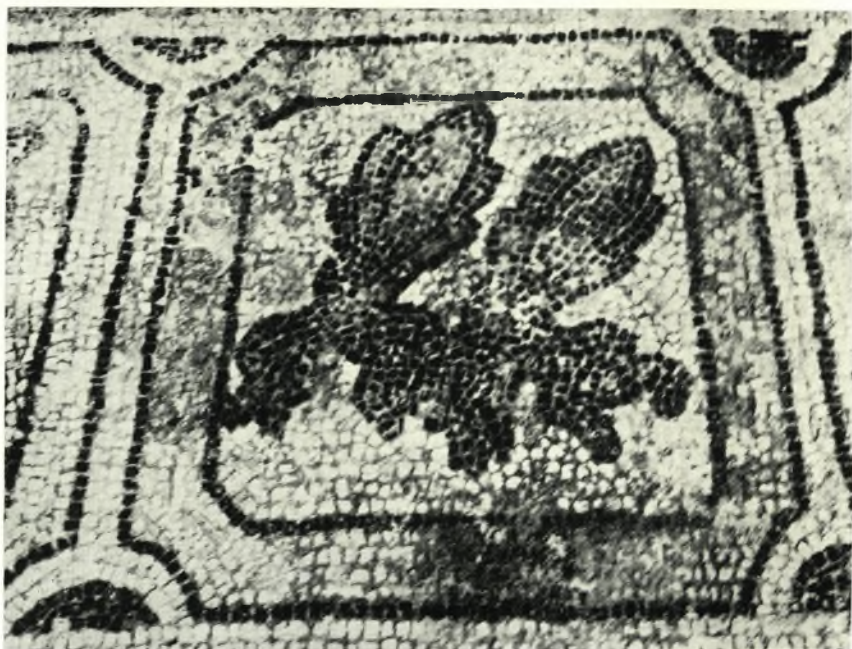
α. Ὁ πίναξ τῶν δύο μελισσῶν.