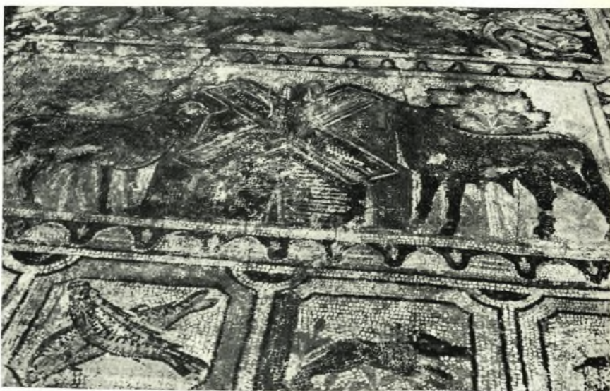
β. Τὰ ἀποκαλυφθέντα ψηφιδωτά τοῦ παρά τὴν ΝΔ. γωνίαν τῆς βασιλικῆς Α διαμερίσματος.