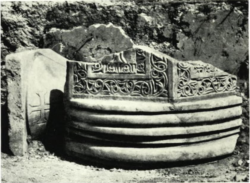
α. Ὁ παρά τὴν ΒΑ. γωνίαν τοῦ κλίτους εὐρεθεὶς ἄμβων. Ἀριστερὰ κιονόκρανον, ἀνήκον εἰς διαχωριστικὸν κιονίσκον παραθύρου.