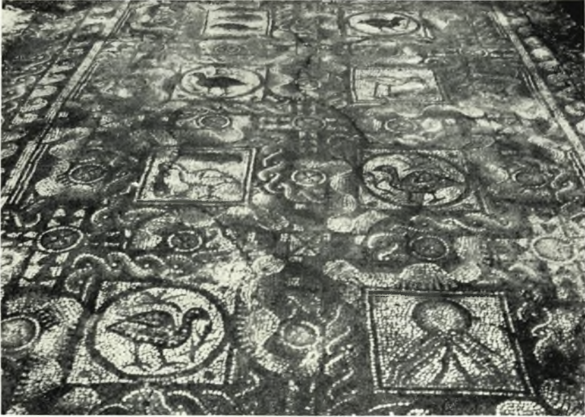
α. Τὸ νότιον κλίτος τῆς βασιλικῆς Α. Τὰ ἀποκαλυφθέντα ψηφιδωτὰ παρὰ τὸ μέσον τμήμα αὐτοῦ.