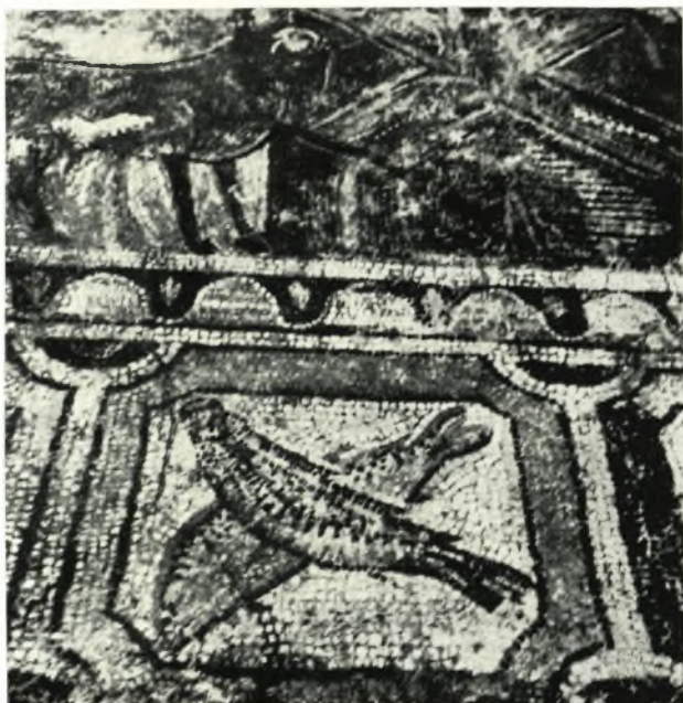
α. Ὁ μετὰ δύο ἰγθύων τετράγωνος πίναξ