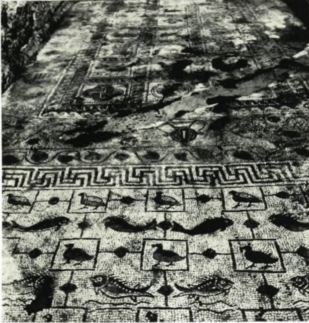
α. Συνέχεια τῶν ἀποκαλυφθέντων ψηφιδωτῶν εἰς τὸ δαπέδον τοῦ πρὸς Νότον τοῦ νάρθηκος τῆς βασιλικῆς Γ' εὐρεθέντος ὀρθογωνίου χώρου.