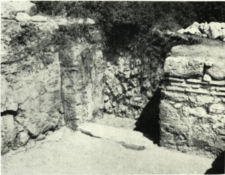
β. Ἡ βόρειος θύρα τοῦ νάρθηκος μετὰ τὸ κατώφλιον κατὰ χώραν.