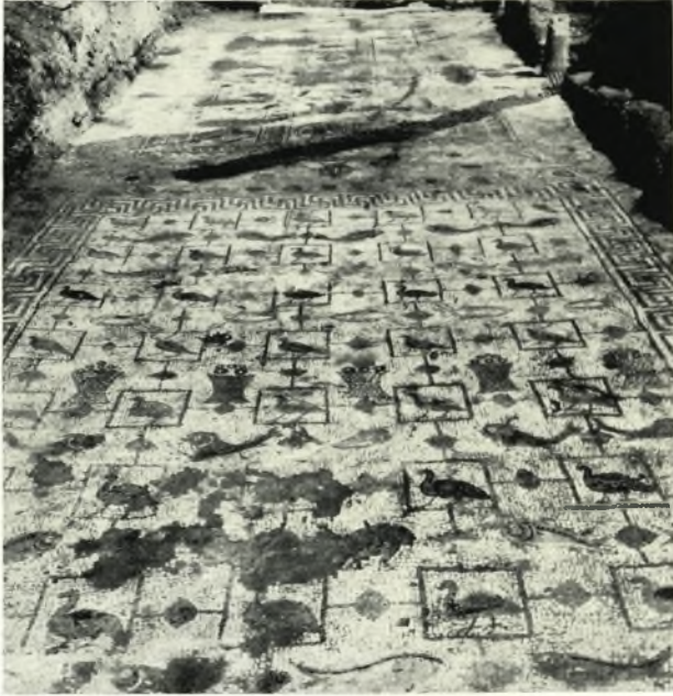
α. Τὸ ἀποκαλυφθὲν δάπεδον τοῦ ἐπιμήκους ὀρθογώνιου χώρου νοτίως τοῦ νάρθηκος τῆς βασιλικῆς Γ.