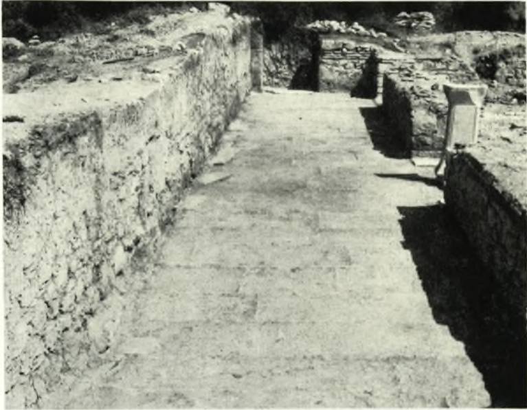
α. Ὁ νάρθηξ τῆς βασιλικῆς Α. Ἄριστερά ὁ μεταγενέστερος τοῖχος, ὅστις καλύπτει τμήμα τοῦ νάρθηκος.