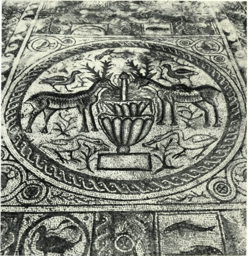
Νότιον κλίτος. Τά ἀποκαλυφθέντα ψηφιδωτά μετὰ τὴν ἀπομάκρυνσιν τῶν κιόνων.