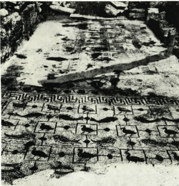
β. Συνέχεια τοῦ δαπέδου τοῦ πρὸς Νότον τοῦ νάρθηκος τῆς βασιλικῆς Γ' ἀποκαλυφθέντος ὀρθογωνίου χώρου.