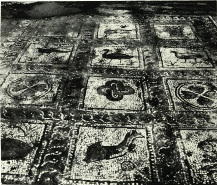
β. Τὸ δάπεδον τοῦ κατὰ πρόεξτασιν πρὸς Νότον τοῦ νάρθηκος τῆς βασιλικῆς Γ ἀποκαλυφθέντος χώρου.