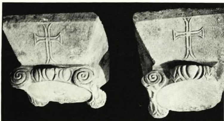
α. Ίωνικά κιονόκρανα, ἀνήκοντα εἰς τὰς κιονοστοιχίας τοῦ ἄνω ὀρόφου τῆς βασιλικῆς Α.