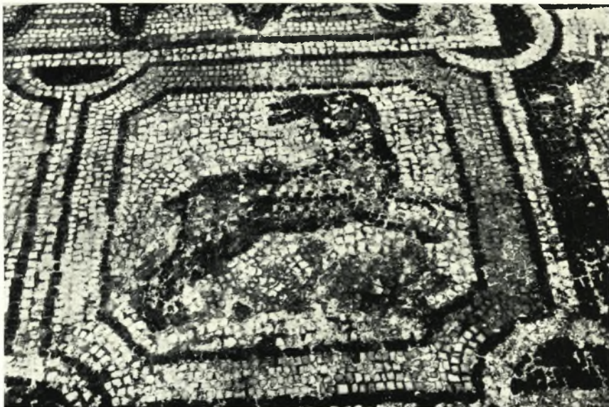
α. Ὁ πίναξ τοῦ διωκομένου λαγωῦ.