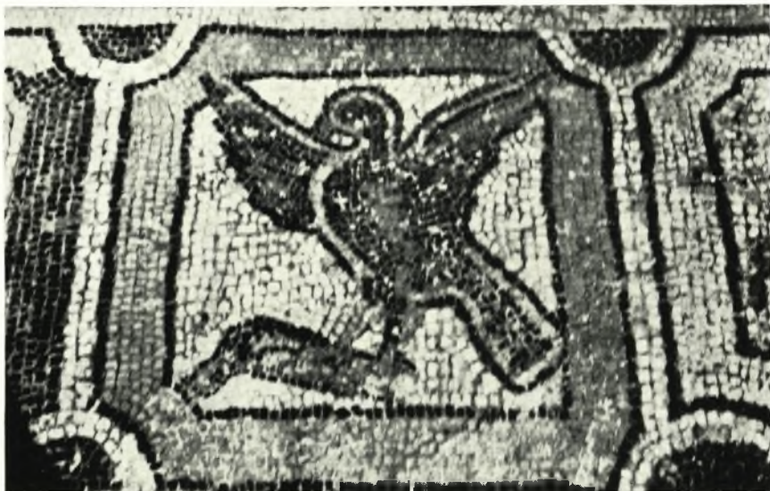
α. 'Ο πίναξ με τὸν ἀετὸν, ὅστις κρατεῖ διὰ τῶν ὀνύχων τοῦ πτηνόν.