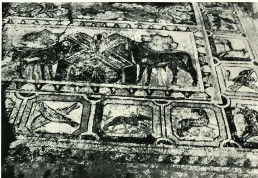
β. Ὁ μετὰ τῶν δύο ἐκατέρωθεν τῆς σταυρομόρφου κρήνης ἱσταμένον μόσχων πίναξ καὶ κάτωθεν αὐτοῦ σειρά ἄλλων πινάκων.