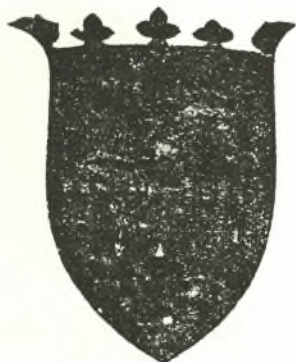
Θυρεὸς τοῦ Ἰακώβου de Morellis.