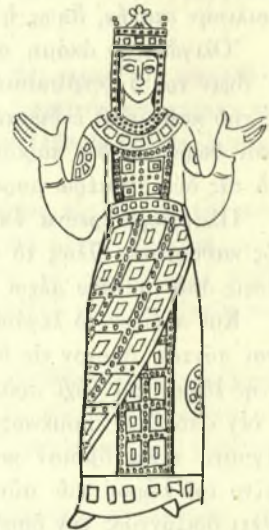
Εἰκ. 3. - Ἀγ. Εὐδοκία (ἐπιπεδογλυφὸν 11ου αἰ.).

Δευτέρα μορφή τοῦ γυναικείου λώρου εἶναι ἐκείνη, ἣν ἔχει ὑπ' ὄψιν ὁ Jerphanion: ὁ λώρος ὡς πλατεῖα ἐσάρπα ἐρχομένη ἐκ τῶν ὀπισθεν διαγωνίως στηρίζεται εἰς τὴν ζώνην χωρὶς νὰ καταπίπτῃ ἀπὸ τοῦ βραχίονος (εἰκ. 3). Τὸ ἀρχαιότερον παράδειγμα συναντῶμεν εἰς τοιχογραφίαν τῆς ἀγ. Ἑλένης τοῦ Ναοῦ ἀγ. Ἀναργύρων Καστοριάς 3 , εὗρισκομένης εἰς τὸ κατώτερον στρώμα, τὸ ὁποῖον κατὰ νεωτέρας ἐρεῦνας χρονολογεῖται εἰς τὰς ἀρχὰς τοῦ 10 αἰ. 4 Κατὰ τὸν 11ον αἰῶνα τὰ παραδείγματα ἀφθινοῦν ἀπαριθμούμενα ὑπὸ τοῦ Jerphanion.