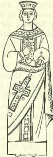
Εἰκ. 2. - Ἀγ. Αἰκατερίνη (μωσαϊκὸν ὁσ. Λουκά).