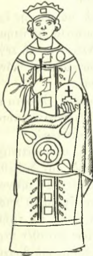
Εἰκ. 1. - Ἀγ. Εἰρήνη (μωσαϊκὸν ὁσ. Λουκά).

ἀγ. Αἰκατερίνη, ἣτις φέρει αὐτὸν διαγωνίως 1 εἰς ἀμφοτέρας τὸ ἀκραῖον τμήμα τοῦ λώρου πτυχούμενον καταπίπτει ἀπὸ τῆς ἀριστερᾶς χειρὸς (εἰκ. 2). Καθ' ὅμοιον τρόπον πρὸς τὴν ἀγ. Αἰκατερίνην τοῦ ὁσ. Λουκά φέρει τὸν λώρον ἢ ἀγ. Ἑλένη εἰς τοιχογραφίαν τοῦ Ναοῦ τῆς Ἀσίνου Κύπρου (1106) 2 καὶ εἰς ἀνέκδοτον εἰκόνα τοῦ Σινᾶ.