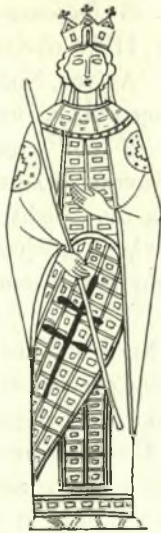
Εἰκ. 4. - Αὐτοκράτειρα Εἰρήνη (σμάλτων 12ου αἰ.).

ρεαλιστικῆ αὐτῆ ἀπόδοσις τοῦ λώρου ἐσχηματοποιήθη συμφώνως πρὸς τὴν ἰσχύουσαν ἀρχὴν ἐν τῇ βυζαντινῇ ζωγραφικῇ τῆς σχηματοποιήσεως τῶν φυσικῶν μορφῶν: Ὁ ἐν εἴδει ἐσάρπας πλατύς λώρος ὁ συγκρατούμενος εἰς τὴν ζώνην ἔλαβε μέγα ὠσειδῆς σχῆμα ἀσπίδος 1 ἐνίοτε δέ, οὗτος, ἰδίως εἰς τὴν μικροτεχνίαν, διαγράφεται γύρωθεν καὶ φαίνεται ὡς ἐξάρτημα μὴ συννε-