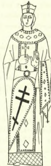
Εἰκ. 5. - Ἁγ. Αἰκατερίνη (εἰκὼν Σινᾶ 12ου αἰ.).

χόμενον ὄπισθεν (εἰκ. 4). Εἶναι ἡ συνηθέστερον ἀπαντῶσα μορφή τὴν ὁποίαν μόνην ἔλαβεν ὑπ' ὄψιν ὁ Ebersolt.