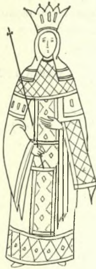
Εἰκ. 6. - Ἄννα Παλαιολογίνα (μικρογραφία 14ου αἰ.).

μιμείται τὴν βυζαντινὴν αὐτοκρατορικὴν στολὴν, φέρουν ἀνδρικοὺς λώρους, ὅπως ἡ σύζυγος τοῦ Μιλουτίν Σιμόνη εἰς μονὴν Στουδένιτσας (1314) 1 , ἡ σύζυγος τοῦ Δουσάν Ἑλένη εἰς Ναοὺς Ντέτσανι (1340) καὶ Λέσνοβο (1346), ἡ σύζυγος τοῦ πρίγκηπος Λαζάρου Μηλίτσα εἰς Λουβοστίνα (1405) 2 καὶ τέλος ἡ ἁγ. Ἑλένη εἰς Ναὸν ἁγ. Νικήτα Γρατσάνιτσα 3 .