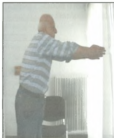
Σχήμα 4: Κάμψη των ωμών στις 90^\circ και μεταφορά του κορμού προς τα εμπρός όσο πιο μακριά γίνεται