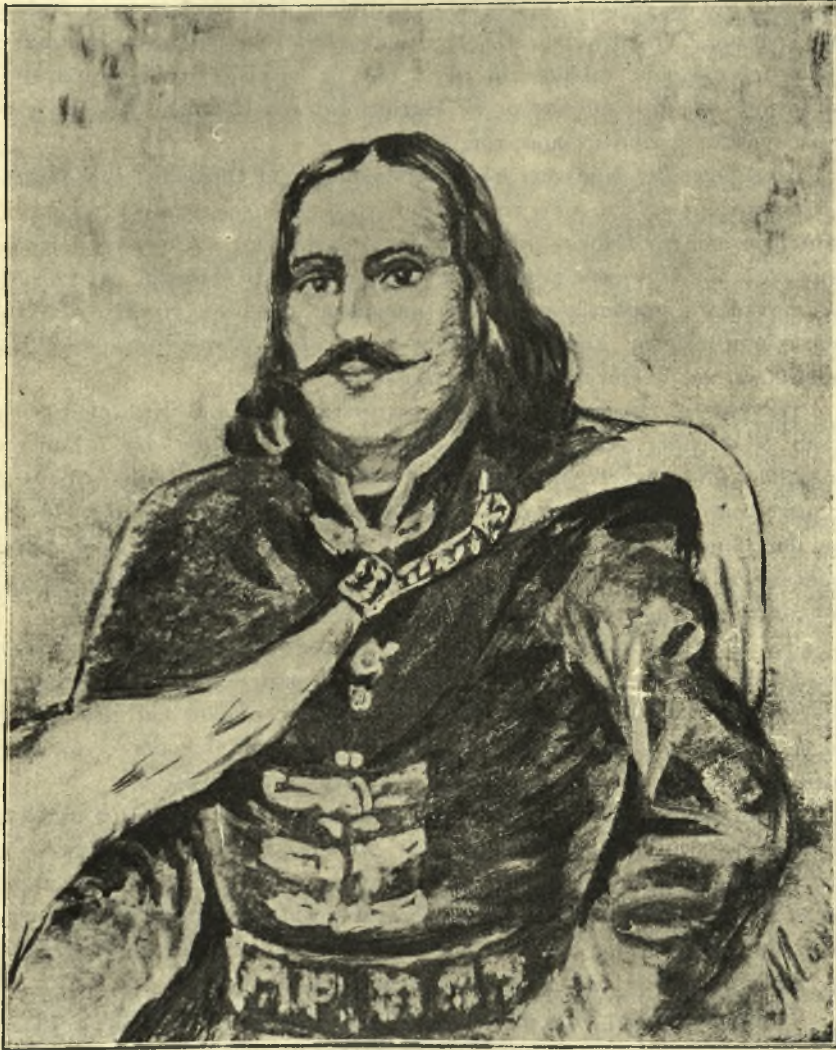
Ο ΗΡΩΣ ΟΥΝΥΑΔΗΣ