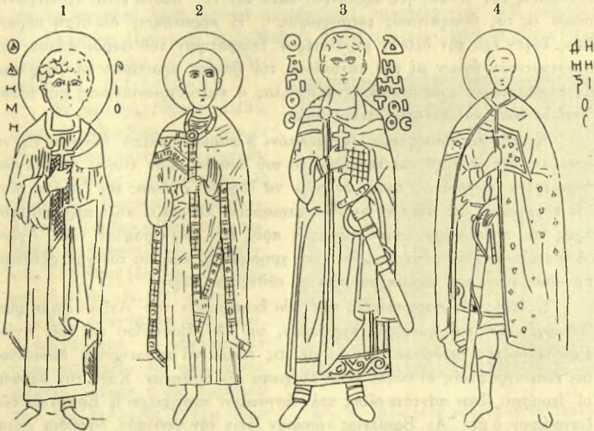
Εἰκ. 3. Εἰκονογραφικοὶ τύποι τοῦ Ἁγ. Δημητρίου.

Κατὰ τὴν ἐτέραν παραλλαγὴν, ἣς παράδειγμα δύναται νὰ ληφθῇ ἡ τοιχογραφία τοῦ σπηλαίου τοῦ Ἁγ. Παύλου ἐν τῇ Μονῇ τοῦ Στύλου ἐν Λάτμῳ (εἰκ. 3 2 ) 1 , ὁ Ἅγ. Δημήτριος εἶναι ὁμοίως ἐνδεδυμένος καὶ κρατεῖ ἐπίσης διὰ τῆς δεξιᾶς σταυρόν 2 , ἀλλὰ ἡ ἀριστερὰ ἐξέρχεται ἐκ τῆς ἀνευσερμένης χλαμύδος καὶ παρίστανται μὲ τὴν παλάμην πρὸς τὰ ἔξω.