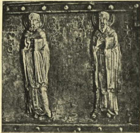
Εἰκ. 4. Ἀργυροῦν κιβωτιδίον ἐν Sancta Sanctorum Λατερανοῦ Ρώμης.

Θὰ ἠδυνάμεθα καὶ ἡμεῖς ν' ἀναγάγωμεν τὸ ἀπασχολοῦν ἡμᾶς περιήπτου εἰς τοὺς ἰδίους χρόνους; Τόσον ἢ ἐκ στεατίτου πλάξ τῆς Συλλογῆς Beagn ὅσον καὶ αἱ τοιχογραφίαι τοῦ σπηλαίου τοῦ Ἁγ. Παύλου ἐν Λάτμω χρονολογοῦνται γενικῶς ἀπὸ τοῦ 11 ου αἰῶνος. Ἐξ ἄλλου αἱ τοιχογραφίαι τοῦ Ναοῦ τῶν Ἁγ. Ἀποστόλων Θεσσαλονίκης, μετὰ τῶν ὁποίων ἀνεύρομεν καὶ τὸν σπαθοφόρον τύπον τοῦ Ἁγίου Δημητρίου, εἶναι ἔργα τοῦ 14 ου αἰῶνος, ὡς ἀποδεικνύουσι πρόσφατοι ἡμέτεροι ἔρευναι. Ὡστε μετὰ τῶν δύο τούτων χρονολογιῶν, τοῦ 11 ου δηλαδὴ καὶ τοῦ 14 ου αἰῶνος πρέπει νὰ τοποθετήσωμεν τὸ περιήπτου τῆς Βερροίας. Ἀλλὰ ὁ ἐπὶ τοῦ περιήπτου τούτου τύπος τοῦ Ἁγ. Δημητρίου σχετίζεται, ὡς εἶδομεν, περισσότερον πρὸς τὰς παλαιότερας παραστάσεις ἢ πρὸς τὴν τοιχογραφίαν τῶν Ἁγ. Ἀπο-