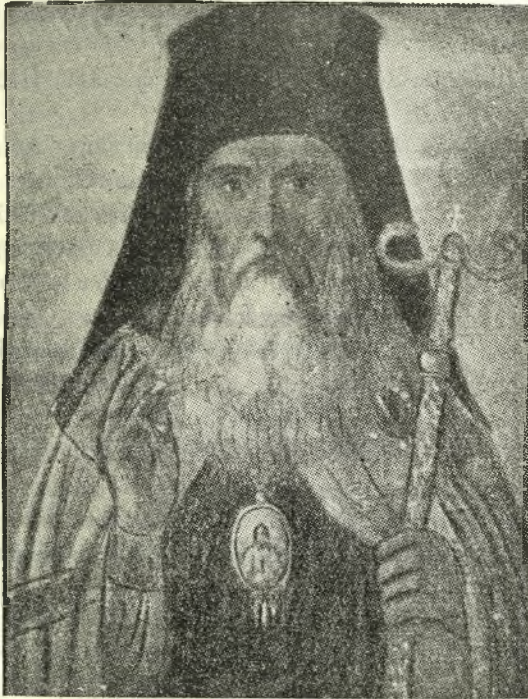
Εἰκὼν Κυρίλλου Ε΄ ἐκ τῆς τοιχογραφίας τῆς ἐν Ἁγίῳ Ὁρει σκῆτης Ἁγίας Ἄννης (Μ. Γεδεών, Ἱστορία τῶν τοῦ Χριστοῦ πενήτων, ἐν Ἀθήναις 1939, σελ. 142).

20. Ἄχρον. πατρ. ἐπιστολὴ πρὸς τὸν Εὐρύπου Παῖσιον, περὶ μὴ ἐνοχλή-