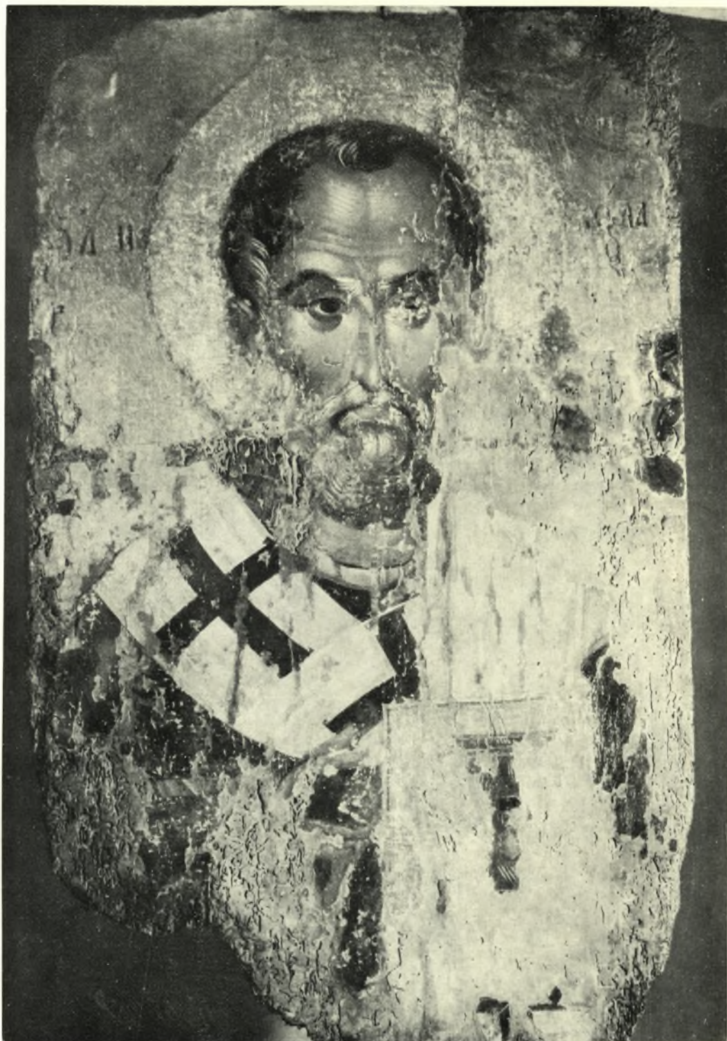
Ἄμφιπρόσωπη εἰκόνα Ρόδου: Ὁ Ἅγιος Νικόλαος. Πρώτη παράσταση