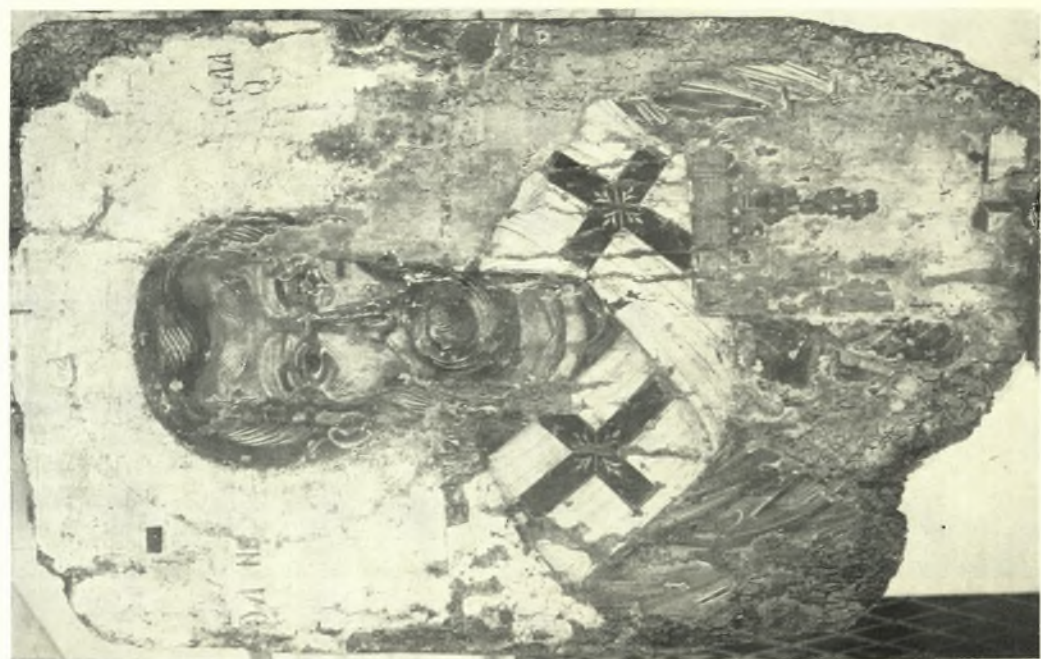
Ἀμφιπόσιπη εἰκόνα Ρόδου: α. Ὁ Ἅγιος Νικόλαος, Δεύτερη παράσταση. Μέρους ἀπὸ τὰ μάτια, τὴ μύτη καὶ τὸ λαϊμὸ εἶναι τοῦ ἁ' Ἁγίου, β. Τὸ κεφάλι τοῦ ἁ' Ἁγίου πρὶν ἀπὸ τὸν καθαρισμὸ. Δεύτερη παράσταση