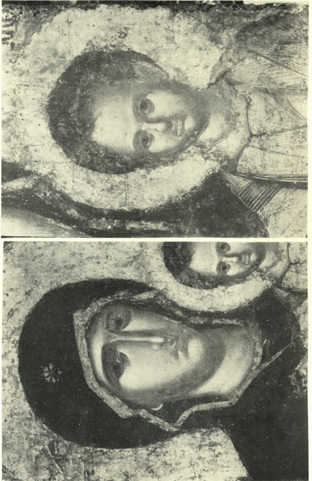
Ἀμφιπόσφι εἰκόνα Ῥόδου. Λεπτομέρειες Πίνακος 31: α. Ἡ Παναγία, β. Ὁ Χριστός