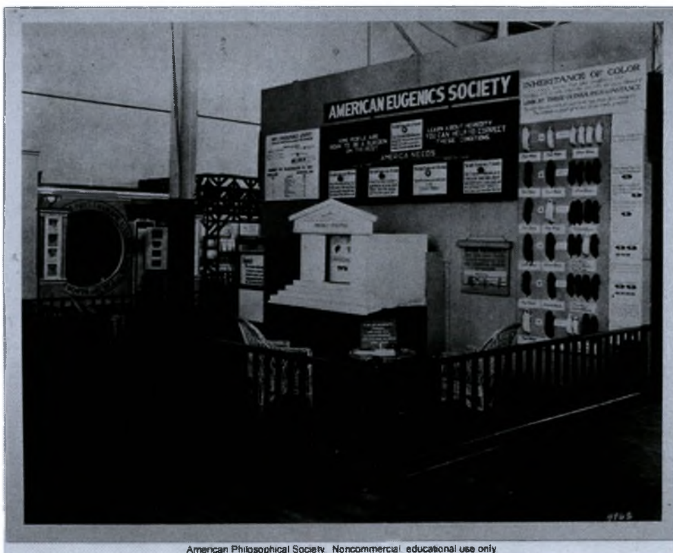
American Philosophical Society. Noncommercial, educational use only

3. Έκθεση ευγονισμού και υγείας σε διαγωνισμό Fitter Fit Families στην Τοπεκα του Kansas. www.eugenicsarchive.org/eugenics/view_image.pl?id=1563