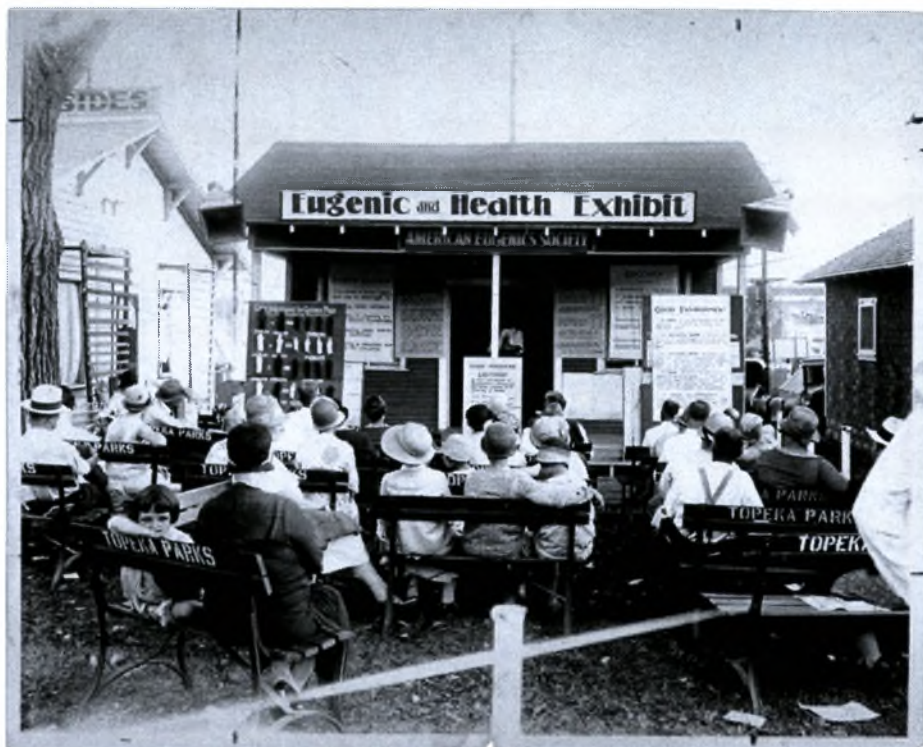
American Philosophical Society. Noncommercial, educational use only

3. Έκθεση ευγονισμού και υγείας σε διαγωνισμό Fitter Fit Families στην Τοπεκα του Kansas. www.eugenicsarchive.org/eugenics/view_image.pl?id=1563