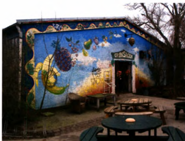
Κοινοτικό κατάστημα βιολογικών προϊόντων

Στη κοινότητα της Χριστιανίας, είναι διαδεδομένη η διαδικασία της ανακύκλωσης των απορριμμάτων με το 50% των παραγόμενων απορριμμάτων να επαναχρησιμοποιείται, έπειτα από επεξεργασία. Η διαχώριση των απορριμμάτων πραγματοποιείται στα σπίτια και στη συνέχεια τα απορρίμματα επεξεργάζονται σε τρεις κεντρικούς σταθμούς: τον σταθμό κομποστοποίησης που αφορά τα οργανικά απορρίμματα, το σταθμό για τα γυαλιά και το σταθμό για τα μεταλλικά απορρίμματα. Τέλος, η κοινότητα της Χριστιανίας διατηρεί συστήματα ελεγχόμενης κατανάλωσης νερού, ελέγχου υδάτινων αποβλήτων και συστήματα εξοικονόμησης νερού.