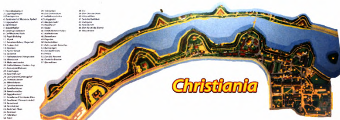
Χάρτης της περιοχής της Χριστιανίας

Η περιοχή της Χριστιανίας αποτελεί πλέον σημαντικό τμήμα της πόλης της Κοπεγχάγης, ενώ είναι μια από τις μακροβιότερες συνειδητές κοινότητες στην Ευρώπη. Η Χριστιανία καλύπτει μια περιοχή μεγαλύτερη από 34 τ. χλμ. και έχει περίπου 1000 κατοίκους. Τους χειμερινούς μήνες οι επισκέπτες ανέρχονται σε 3000 κάθε μέρα ενώ το καλοκαίρι ο αριθμός των επισκεπτών ανέρχεται σε 5000. Σημαντικό ποσοστό των επισκεπτών της περιοχής καταλαμβάνουν κάτοικοι της Κοπεγχάγης οι οποίοι αξιοποιούν μεγάλο μέρος του ελεύθερου χρόνου τους στη Χριστιανία.