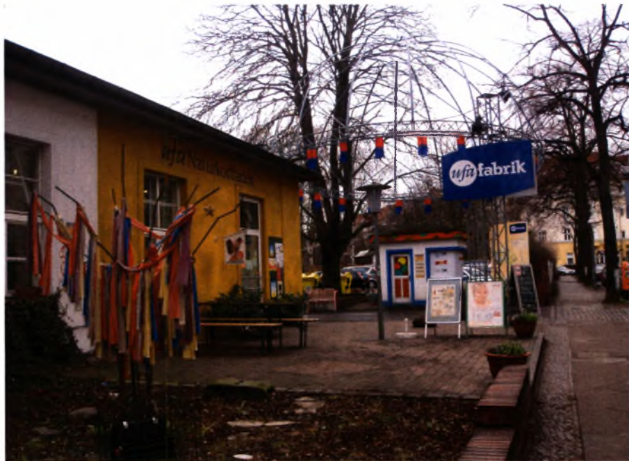
Άποψη της εισόδου της UfaFabrik

Επίσης η κοινότητα UfaFabrik έχει δραστηριότητα σε πολλά διεθνή δίκτυα όπως είναι το International Federation of Settlement and Neighborhood Centers (ifs), ένα δίκτυο τοπικών οργανισμών, το Trans Europe Halles, ένα δίκτυο ανεξάρτητων πολιτιστικών κέντρων, και το Res Artis ένα διεθνές δίκτυο συνοικιακών κέντρων τέχνης.