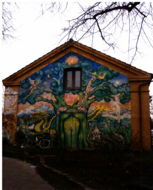
Πηγή: Προσωπικό αρχείο