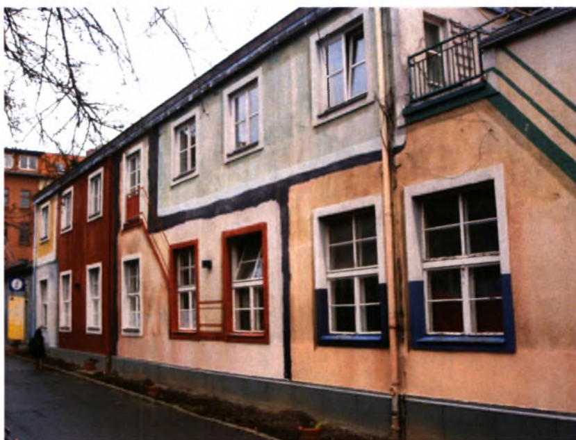
Άποψη των κτιρίων της κοινότητας

Το κανάλι Teltow ορίζει τα όρια της νότιας πλευράς του UfaFabrik, ενώ τα όρια της βόρειας πλευράς ορίζονται από την οδό Viktoriastrasse, στην οποία βρίσκονται τετραώροφα και πενταώροφα κτίρια διαμερισμάτων σε σχετικά πυκνή δόμηση. Ανατολικά και δυτικά του UfaFabrik, υπάρχουν πολλά βιομηχανικά συγκροτήματα τα οποία χαρακτηρίζουν την ευρύτερη περιοχή αλλά και τα κτίρια της ίδιας της κοινότητας.