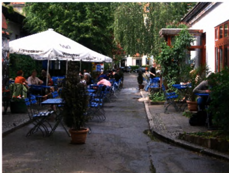
Αποψη του εξωτερικού καφέ της UfaFabrik

Σήμερα, τα περισσότερα κτίρια έχουν καλυφθεί με βλάστηση για λόγους τόσο αισθητικούς όσο και λειτουργικούς και ειδικά τους καλοκαιρινούς μήνες που τα φυτά και τα δέντρα είναι καταπράσινα, ο χώρος προσφέρει μια αίσθηση εξοχής στο κέντρο της πόλης. Λόγω της έντονης βλάστησης αλλά και του χαμηλού ύψους των κτιρίων, καθώς κάποιος εισέρχεται στον χώρο της κοινότητας έχει την αίσθηση ότι δεν βρίσκεται σε ένα μεγάλο μητροπολιτικό κέντρο όπως είναι το Βερολίνο, αλλά σε κάποιο μικρό αγροτικό οικισμό.