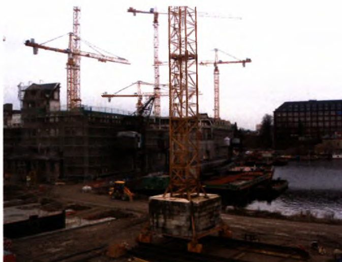
Τα έργα στο λιμάνι του Tempelhof

Τα αρχικά σχέδια περιλάμβαναν την διατήρηση και ανακαίνιση των ιστορικών αποθηκών του λιμανιού και τη δημιουργία μιας αγοράς βιολογικών τροφίμων, ενός κέντρου πολιτισμού και άλλων δράσεων στις εγκαταστάσεις. Το πρόγραμμα αυτό έληξε πρόωρα καθώς η έκταση πωλήθηκε σε μια ιδιωτική εταιρεία η οποία εκδήλωσε ενδιαφέρον για τη δημιουργία ενός εμπορικού κέντρου στις εγκαταστάσεις και η συμμετοχή της UfaFabrik και των πολιτών ελαχιστοποιήθηκε.