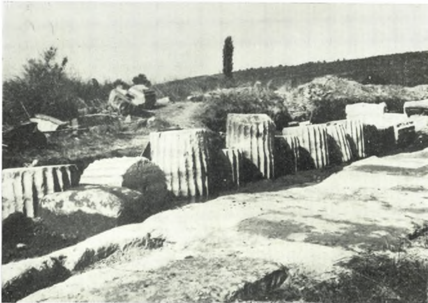
β. Σφρόνδυλοι ἐκ τοῦ ναοῦ τῶν Μέσων.