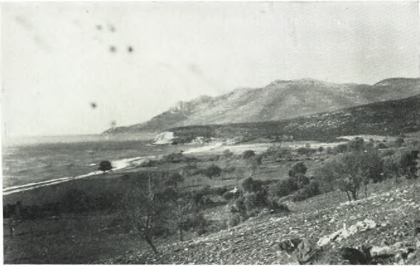
α. Γενική άποψις τοῦ χώρου τῆς ἀνασκαφῆς. Εἰς τὸ βάθος ὁ Ἰσμαρος (Μαρώνεια).