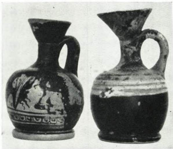
α. Ληκύθια ἐκ τοῦ ἀγοῦ Σοφόγλου.