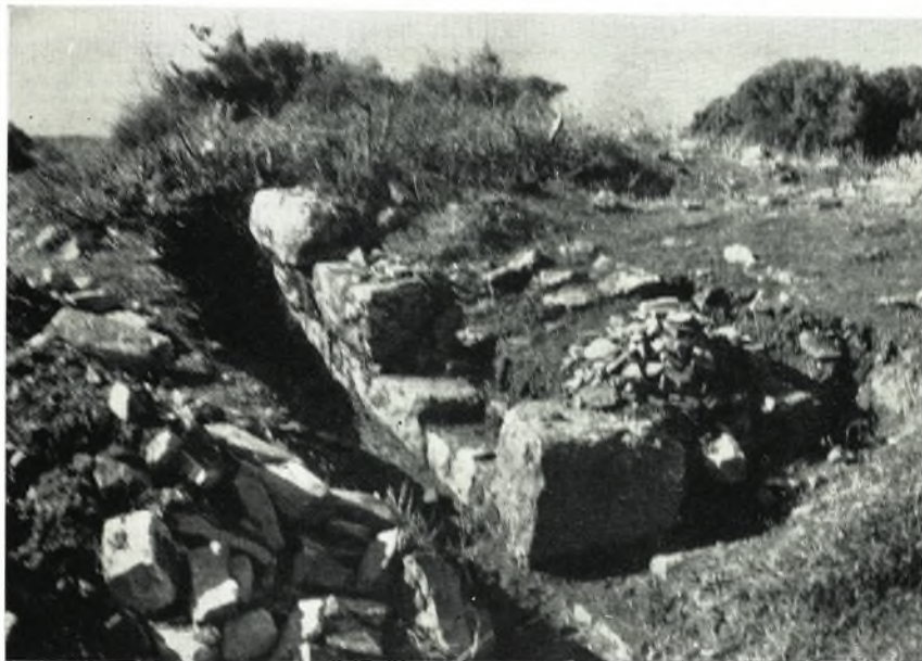
α. Νοτιοανατολική γωνία κτίσματος.