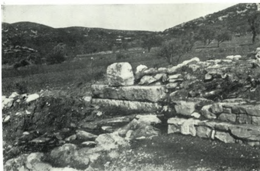
β. Βαθμιδωτὸν θεμέλιον οἰκοδομῆς.