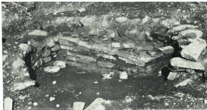
β. Κυκλικὸν κτίσμα - τάφος.