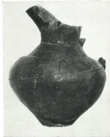
γ. Προϊστορική πρόζους μὲ χαρακτηριστὴν διακόσμησιν.