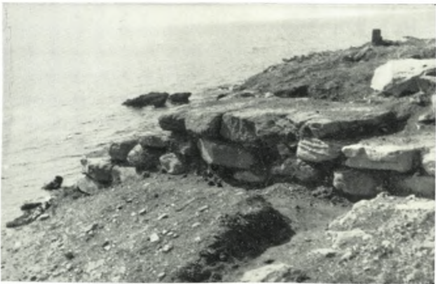
β. Νοτιοανατολική γωνία τοῦ τείχους (Φυλακές).