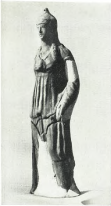
α. Πηλινον ειδώλιον Ἀθηνᾶς.