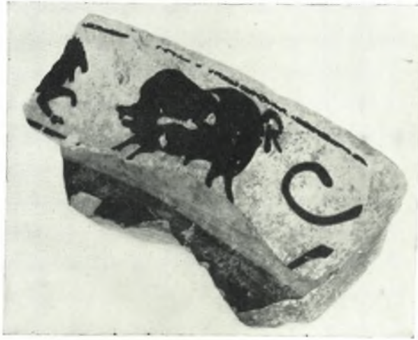
α. Τμήμα χείλους μελανομόρφου κρατήρος.