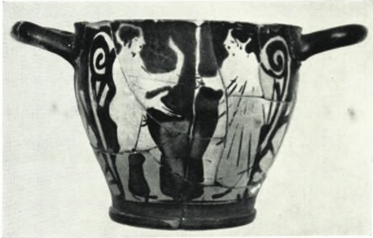
α. Ἐρυθρόμορφος δίσκος σκύφος.