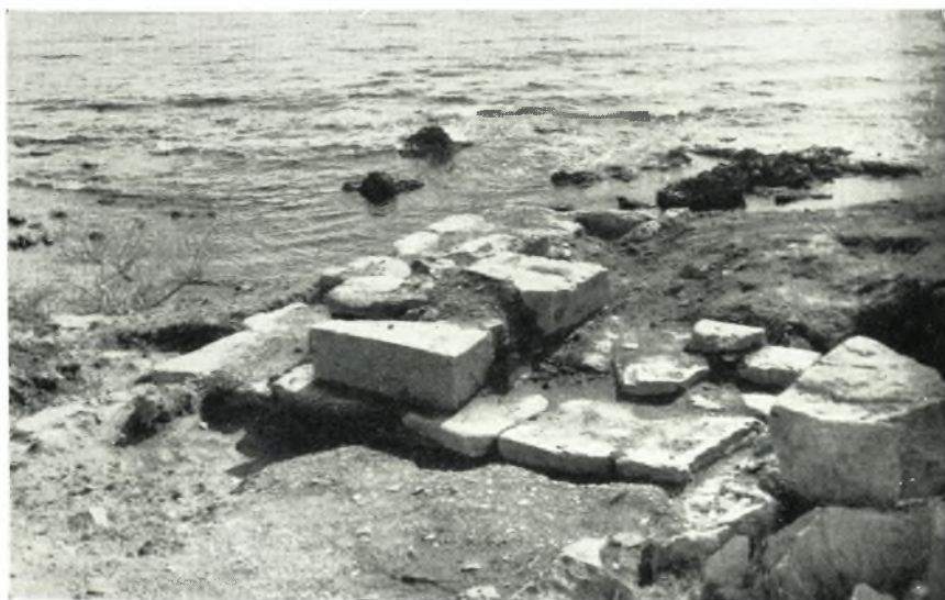
β. Τμήμα πύργου ή ναύσων (Φυλακές).