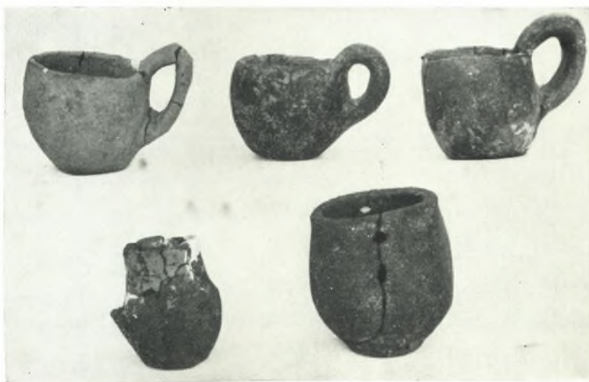
β. Προϊστορικά αγγεία.