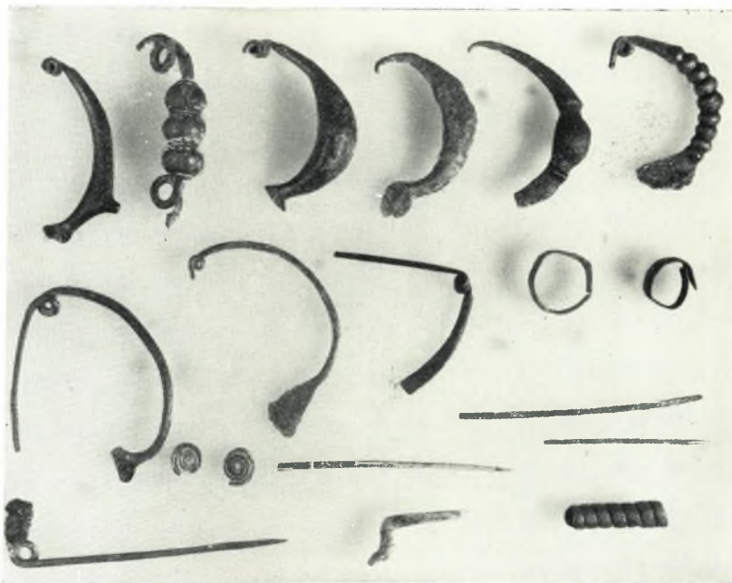
α. Χάλκινα ευρήματα (πόρπαι, περόναι κλπ.).