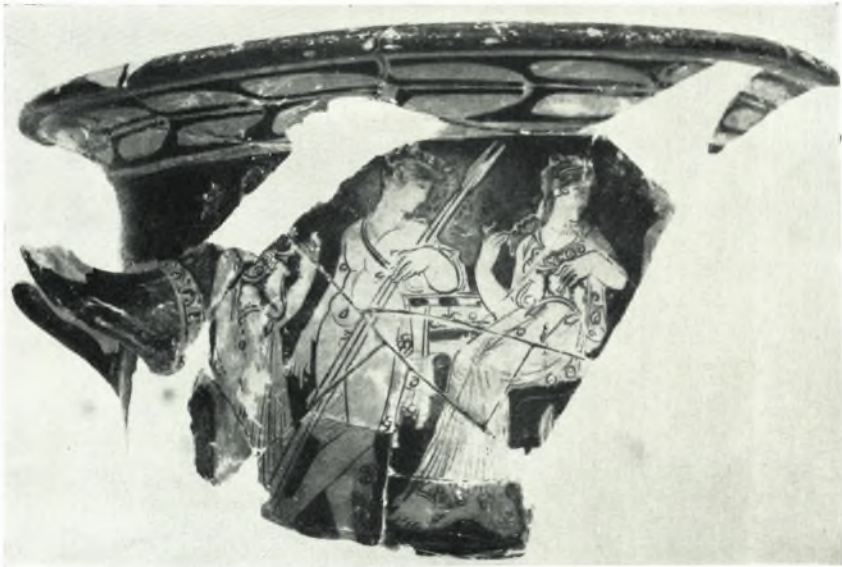
β. Τμήμα ἐρυθρομόρφου κρατήρος τῶν ἀρχῶν τοῦ 4 ου αἰῶνος.