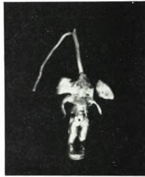
β. Χρυσοῦν ἐνώτιον.