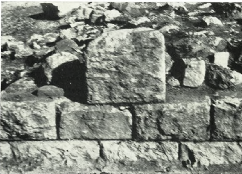
β. Πρόσοψις τοῦ ἀποκαλυφθέντος μνημείου (:).