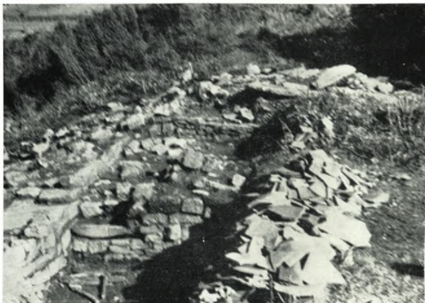
α. Κέραμοι στέγης τῆς ἑλληνορρωμαϊκῆς περιόδου.