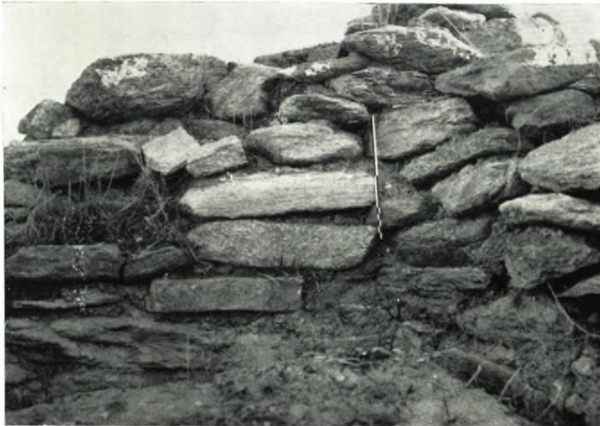
α. Τοίχος οικίας 33 (Νεωτέρα Νεολιθική).