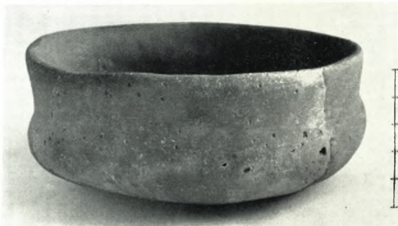
β. Μονόχορμον ἀγγεῖον τῆς «περιόδου τοῦ Ραζμανίου».