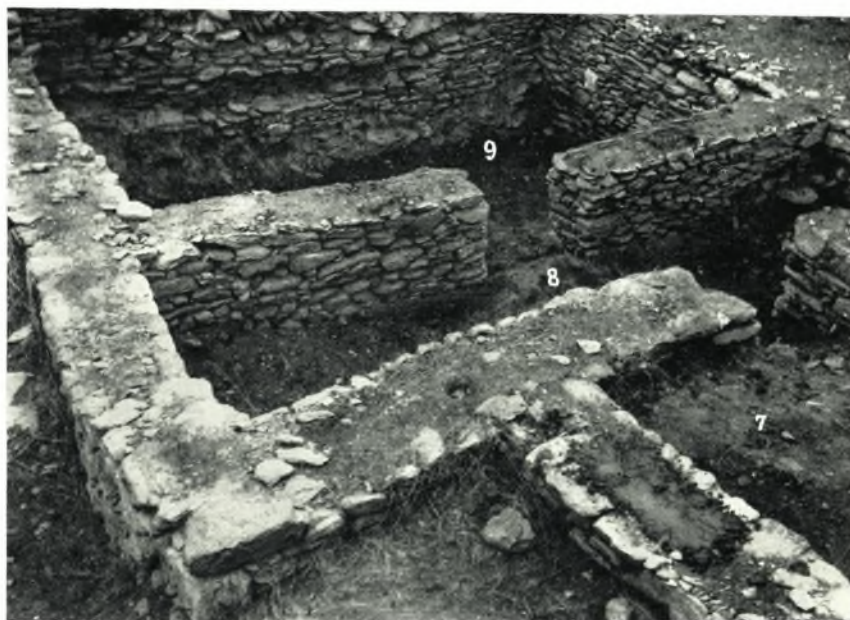
β. Ἡ «μεγαροειδής» οἰκία 7-8-9 μετὰ τὴν γενομένην συντήρησιν.