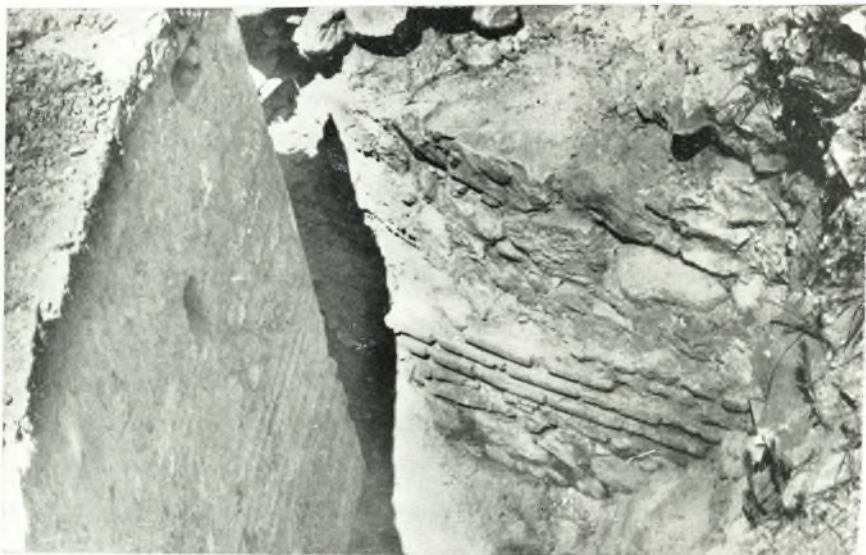
α. Λί δύο ὁμόκεντροι κόγχαι. Ἡ ἀρχαιότερα (ἔσωτερική) καὶ ἡ νεωτέρα (ἔξωτερική).