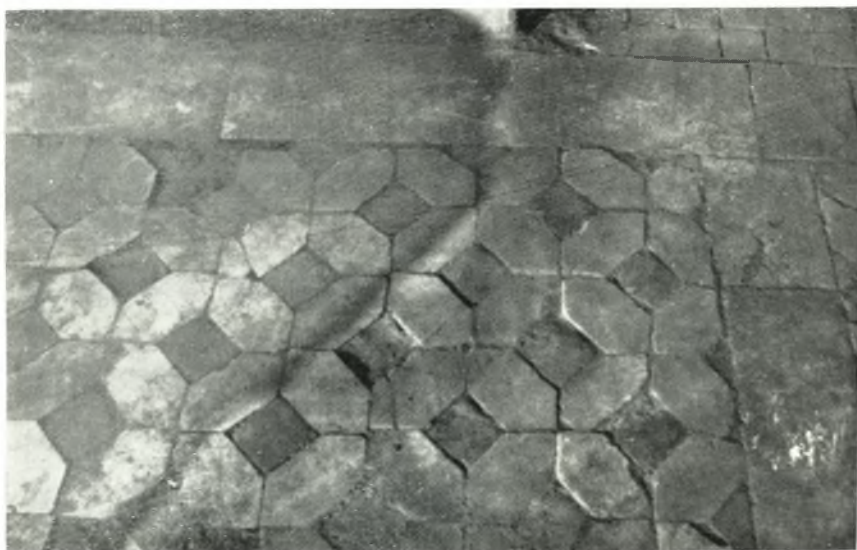
β. Λεπτομέρεια τῆς ἀνωτέρω εἰκόνας.