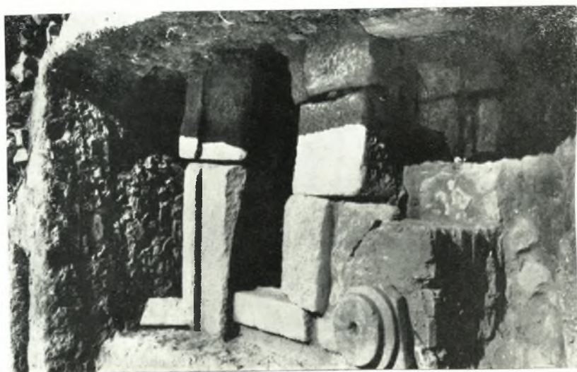
α. Τμήμα τοῦ ἀφόδου τοῦ βαλανείου.