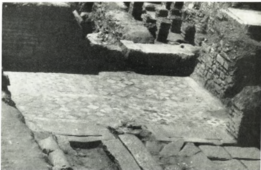
α. Διαμέρισμα-προθάλαμος τοῦ μέσου οἴκου μετὰ δαπέδου ἐκ μαρμαροθετημάτων.