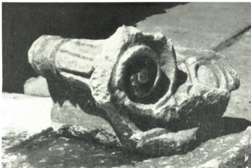
α. Ίωνικόν κιονόκρανον ἐκ τῆς ἐξέδρας.