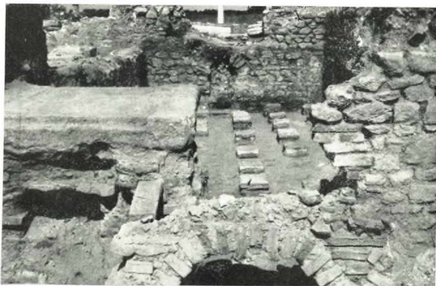
β. Ὑπόκαυστον τοῦ μέσου οἴκου.