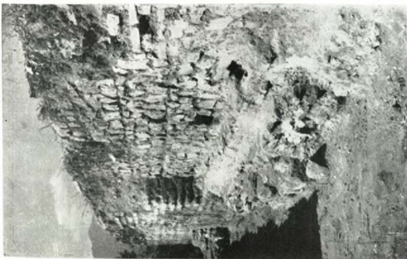
β. Τμήμα τῆς παρόδου καὶ τῆς ἀπομεινυτικῆς ἀλλοκίας ὡς εὐρέθη κατὰ τῆς ἀνασκαφῆς.