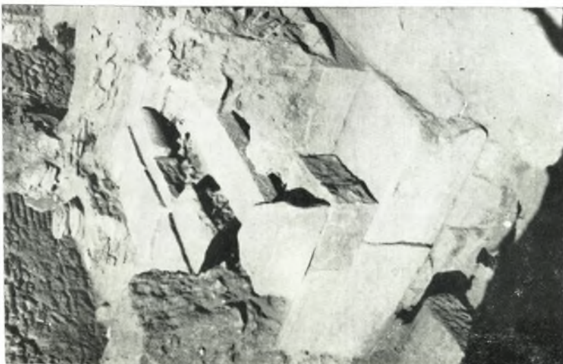
α. Σύστημα ἰσοδύμου τοιχοδομίας κατὰ τὴν Β.Α. γωνίαν τοῦ λουτροῦς.