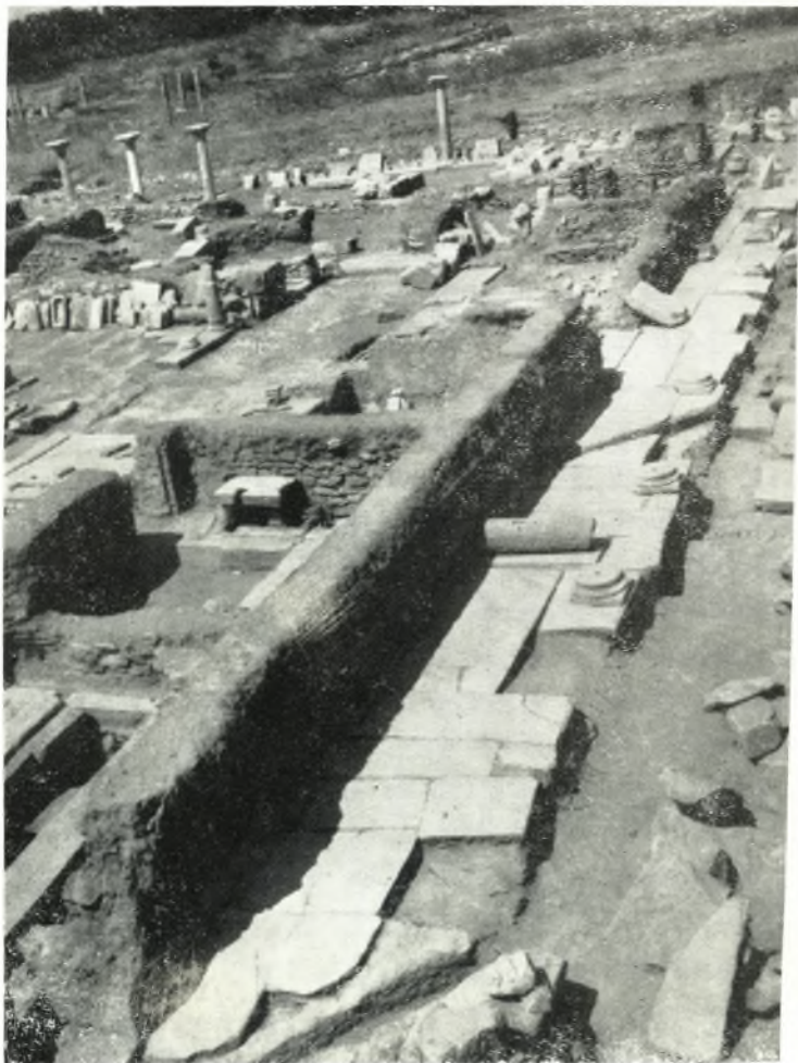
Γενική άποψις τῆς ἀποκαλυφθείσης ἐξέδρας — στοᾶς — ἀνατολικῶς τῶν προφυλαίων.