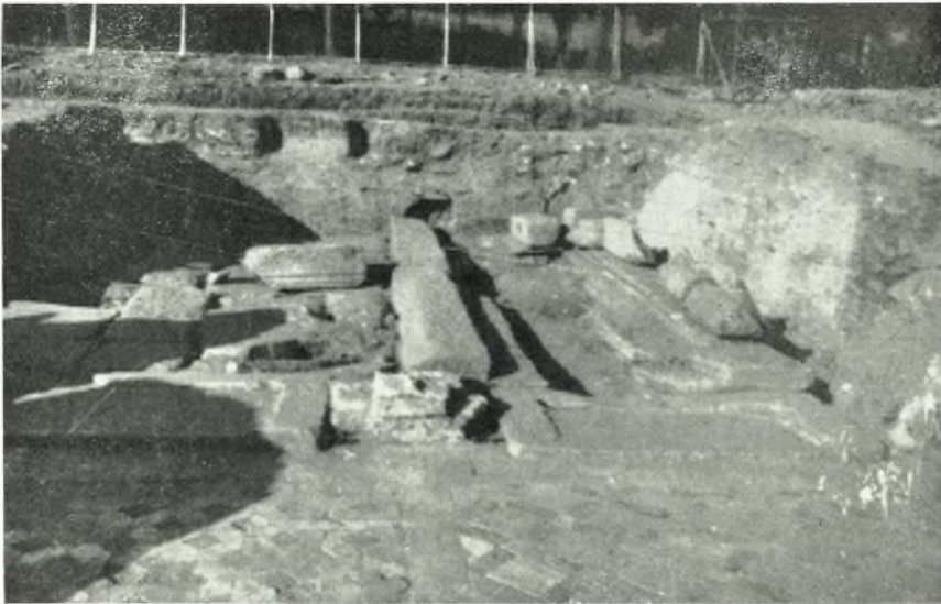
β. Διαμέρισμα βορείως τοῦ προθαλάμου τοῦ μέσου οἴκου.