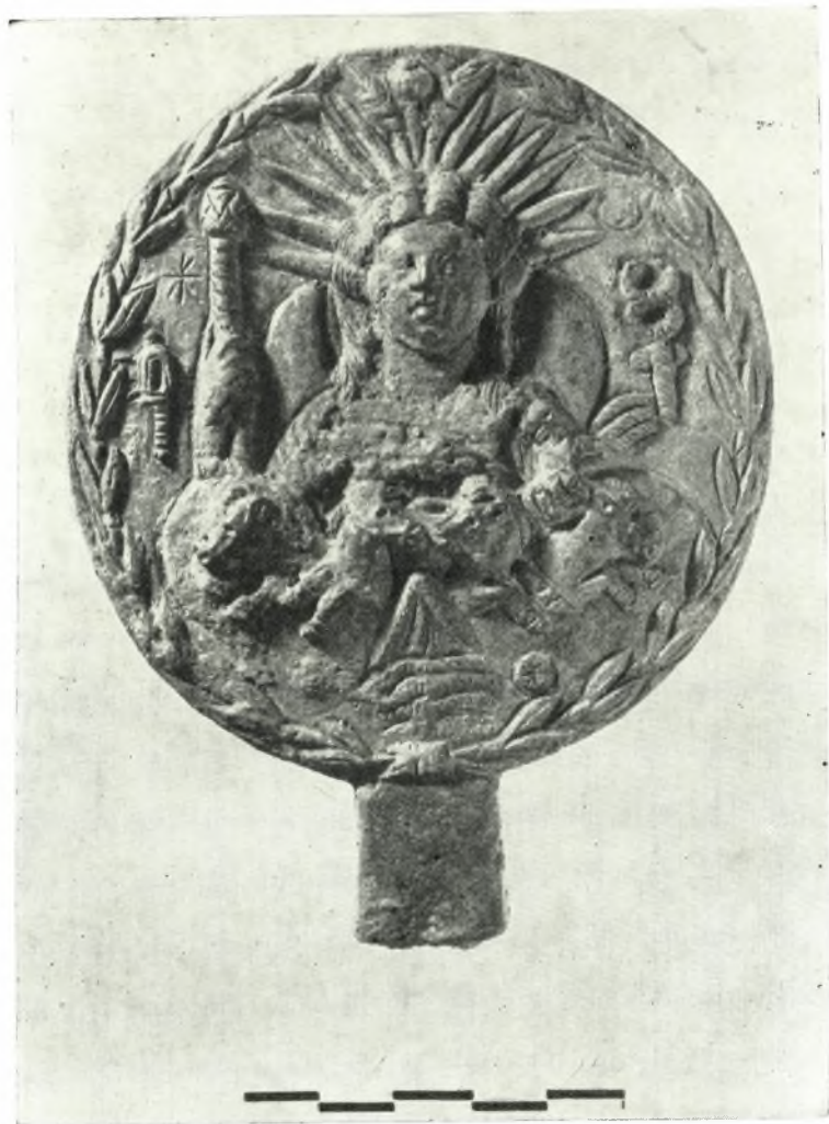
Χαλκούς δίσκος τοῦ 3ου μ.Χ. αἰῶνος ἐκ τῶν ἀνασκαφῶν τῆς Ἐλευσίνας.