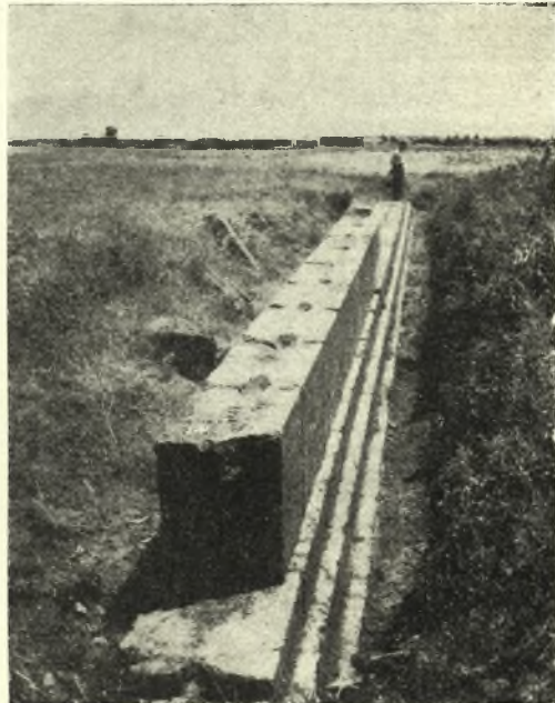
Εἰκ. 7. Ἀποψὶς τῆς ἀναστηλωθείσης νοτίας πλευρᾶς τοῦ Βουλευτηρίου ἀπὸ Δυσμῶν.

ἄλλων παραδειγμάτων συνάγεται, δηλοῖ ὅτι καὶ τὸ ὄνομα τοῦ πατρὸς τοῦ Μηνόδοτου ἦτο ἐπίσης Μηνόδοτος. Ὡς πρὸς δὲ τὸ ἔτους ἑβδομηκοστοῦ , ἂν δὲν πρόκειται περὶ χρονολογίας ἀπὸ τινος ἀφειρησίας (π.χ. τῆς ἐν Ἀκτίῳ νίκης), θὰ δηλοῖ πιθανῶς τὴν ἡλικίαν τοῦ ἀναθέσαντος τὸν δίσκον γυμνασιάρχου.