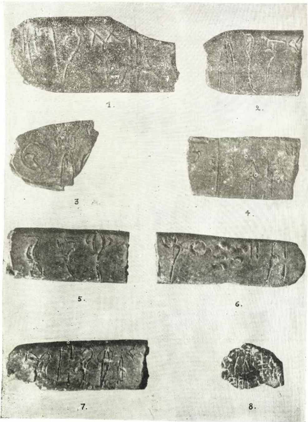
Μινωικά πινακίδες ΣΥΛΛΟΓΗΣ ΓΙΑΜΑΛΑΚΗ