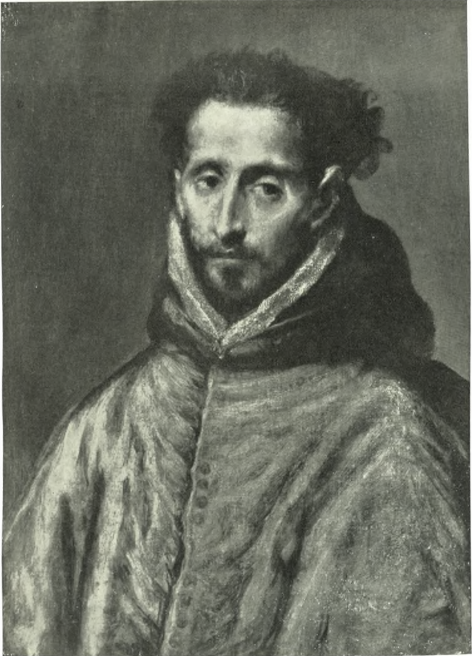
Δ. Θεοτοκόπουλος: Προσωπογραφία Καρδινάλιου, περ. 1599 - 1600, Έθνική Πινακοθήκη της Βικτόριας, Μελβούρνη