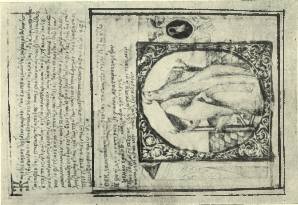
Εικ. 1.—Φωτοτυπία τῆς σ 136 γ. τοῦ κώδ. Κλόντζο, περιεχούσης κείμενον καὶ μικρογραφίαν τοῦ Π. Τζιγόνια.