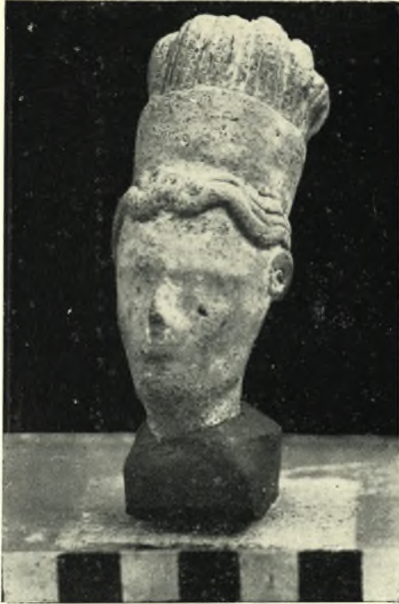
1. — Ἡ ὄραία κεφαλή τοῦ Ἱεροῦ Πισκοκεφάλου.