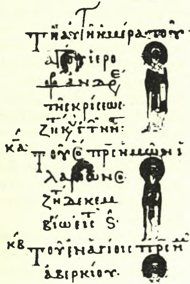
Εἰκὼν 1.— Κώδιξ Vaticanus Graecus 1156, σελὶς 202 verso.

προσπάθεισ, μετὰ τὴν ἀπελευθέρωσιν, ὥστε νὰ ἀποκατασταθῇ καὶ πάλιν ἡ ὀρθοδοξία 70 . Ἐτονίσθη ἤδη ἀνωτέρω ὅτι ἡ ἕξαρσις τῶν ἐκ Κρήτης ἁγίων ἐν Κωνσταντινουπόλει ἀπέβλεπε πρὸς αὐτὸν τὸν σκοπόν, ὅπως ἐπίσης καὶ ἡ τιμὴ ἡ ἀποδιδομένη εἰς τὰ ἐν Κωνσταντινουπόλει λείψανά των. Πρὸς τὸν ἴδιον σκοπὸν εἶναι συνδεδεμένον βεβαίως καὶ περιστατικόν, τὸ ὁποῖον μολονότι εἶναι τυλικὸν αὐτὸ καθ' ἑαυτό, ἀποκτᾷ, νομίζω, ἰδιαιτέραν σημασίαν λόγῳ τῶν εἰδικῶν συνθηκῶν τῆς ἐκκλησίας τῆς Κρήτης κατὰ τὴν ἐποχὴν καθ' ἣν συνέβη. Ὁ Μιχαὴλ Ἀτταλειάτης διηγεῖται ὅτι κατὰ τὴν ἀπόβασίν του εἰς τὴν Κρήτην καὶ τὴν πολιορκίαν τοῦ Χάνδακος ὁ Νικηφόρος Φωκᾶς ἔδωσεν ἐντολὴν καὶ κατεσκευάσθη μεγαλοπρεπὴς ναὸς τῆς Θεοτόκου μετὰ πλήθους εἰκονογραφιῶν: « Ναὸς ἀπηροτίσθη διὰ τριῶν ἡμερῶν περικαλλῆς καὶ σεβάσμιος, σφαιροειδῆ τὸν ὄροφον ἔχων καὶ παραπτέροις κεκοσμημένους καὶ κίους καὶ προνάοις καὶ κόσμῳ διηνηθιομένους μαρμάρων καὶ μορφαῖς ἁγίων περιαστράπτων καὶ ὅλως ἀπηροτισμένους εἰς