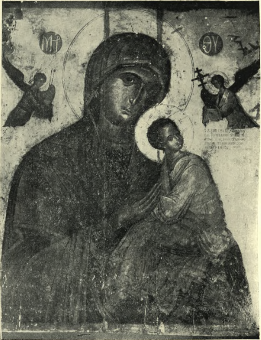
*Η Ρεθυμνία εικόνη της Παναγίας τοῦ Πάθους