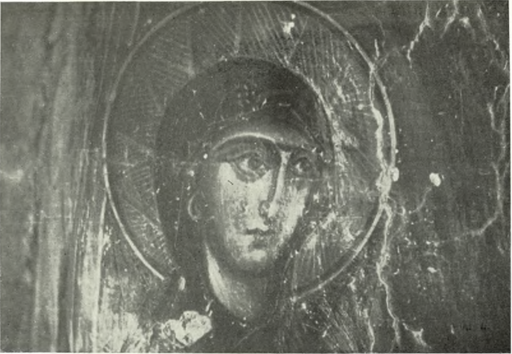
Εἰκ. 1 (ἄνω).—La Sainte Vierge. Fresque de l'église S Jean «σὸ Σπή- λιο» du village Kalogerou de l'île de Crète.—XIV siècle.