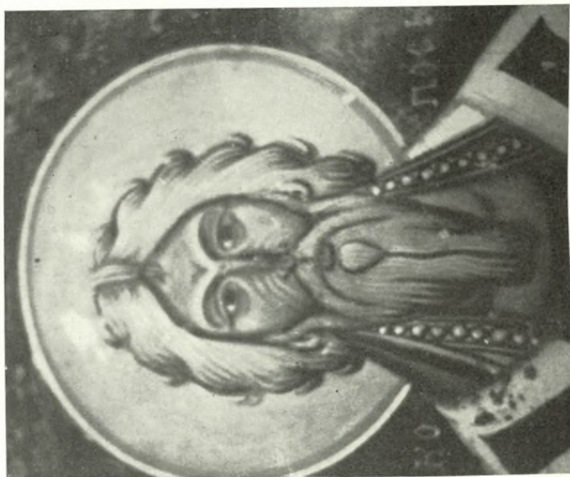
Εικ. 1.—S. André, archevêque de Crète. Fresque à l'église de la Vierge au village S. Jean, Mylopotamo.—XV siècle.