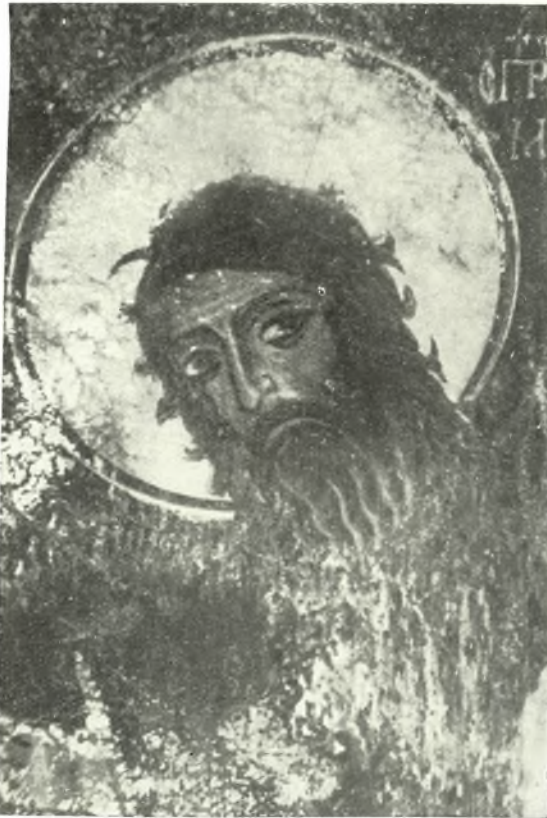
Εἰκ. 2 (ἀριστερά).—S Jean Bapti- ste. Église S. Georges entre des villa- ges N. Amari et Meronas - XIVsiècle