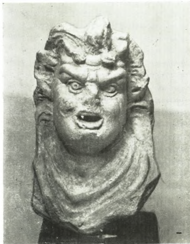
3. Panticapée. Acteur (terre cuite).