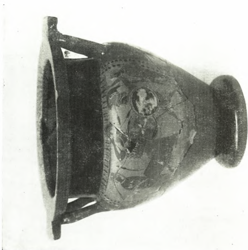
2. Panticapée. Le cratère attique à figures noires.