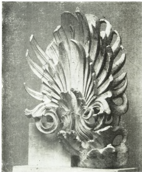
2. Phanagoreia. Acrotère.