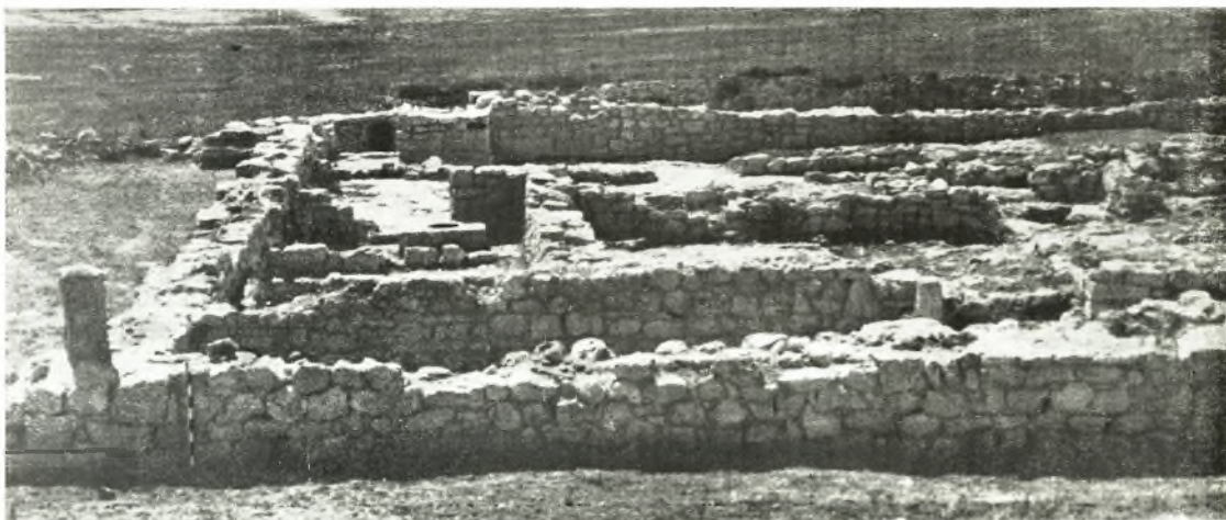
2. Chersonesos. La maison d'un κληρος dans la presqu'île d'Héraclée.