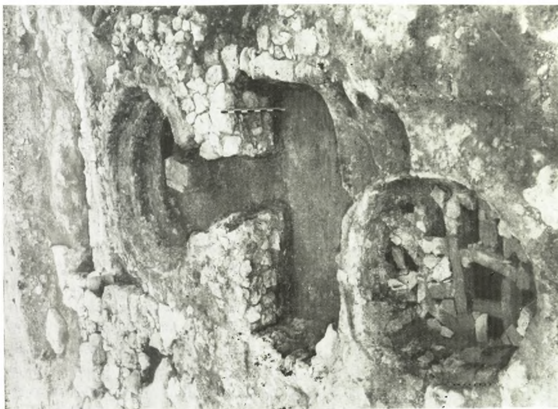
2. Chersonesos. Les fours de potier.