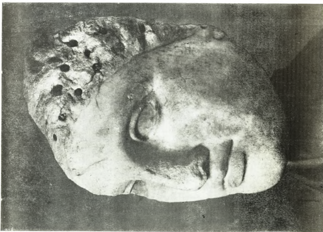
1. Panticapée. Aphrodite.