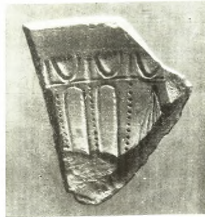
2. Panticapée. Le fragment d'une forme de coupe «mégarienne».