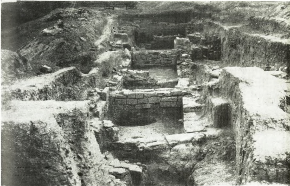
1. Olbia. Agora Les locaux de commerce.