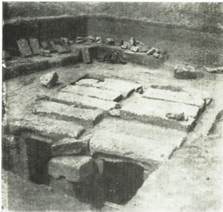
1. Panticapée. Le caveau du IIe s. avant notre ère.