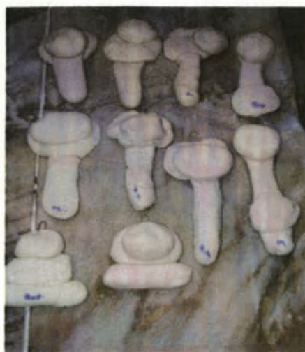
Πρώτο αποτέλεσμα: δημιουργίες παιδιών