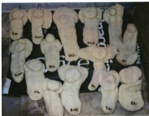
Πρώτο αποτέλεσμα: δημιουργίες παιδιών