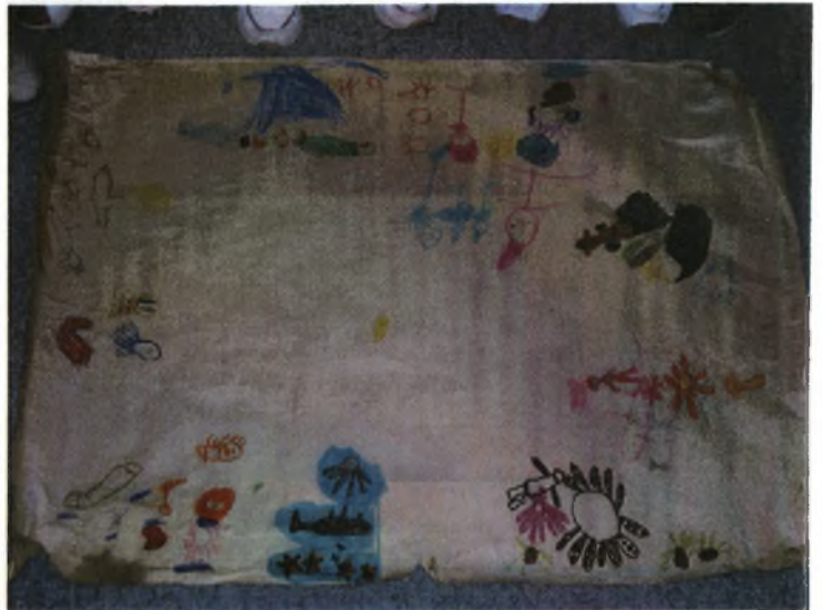
2 ο Νηπιαγωγείο –21 ο Αβέρωφ