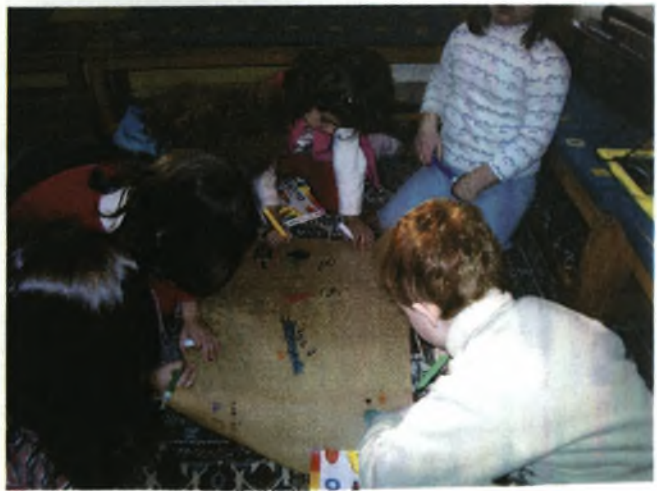
Ζωγραφίζοντας φανταστικά ψάρια