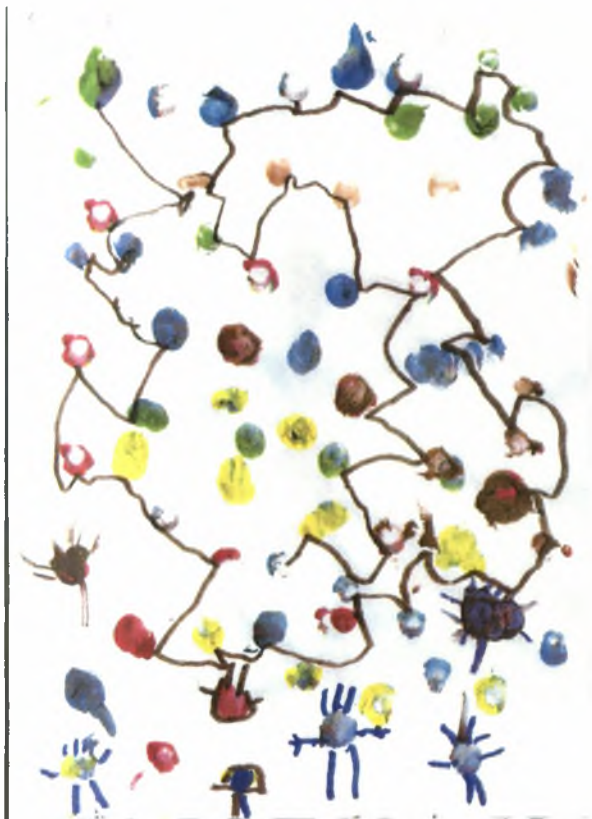
Δημήτρης 5χρ.: Η γραμμή δηλώνει την σκηνή του Τσίρκο, το οποίο έχει κλόουν και περίεργα ζώακια