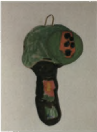
Φραγκίσκου 6χρ.: Καρπουζιά