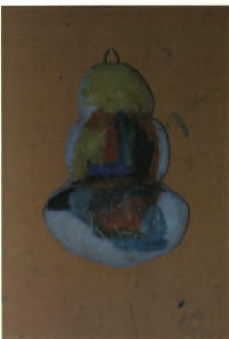
Βάιος 5χρ.: Δέντρο