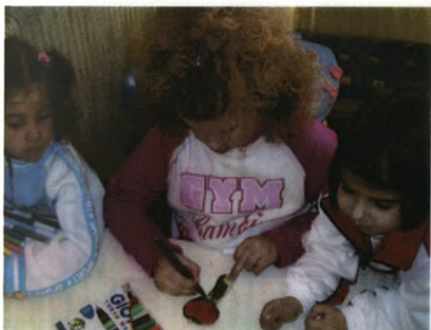
Δίνοντας μορφή στο ζυμάρι