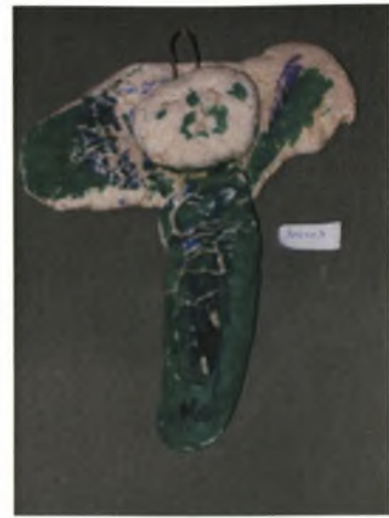
Νότης 6χρ.: Αγγελουδάκι