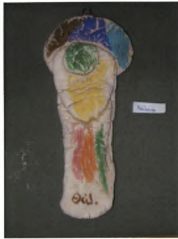
Θάλεια: 6χρ.: Αγγελουδάκι