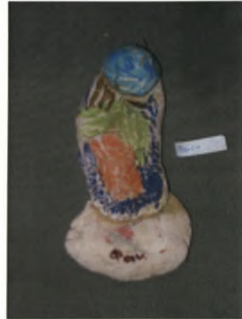
Φανή 4χρ.: Άγιος Βασίλης