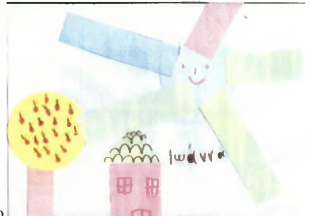
Ιωάννα 6χρ.: Σπίτι με ήλιο