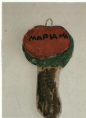
Μαριάννα 6 ½ χρ.: Μηλιά