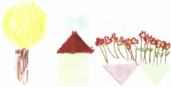
Θανάσης 5χρ.: Σπίτι με δέντρο και γλάστρες