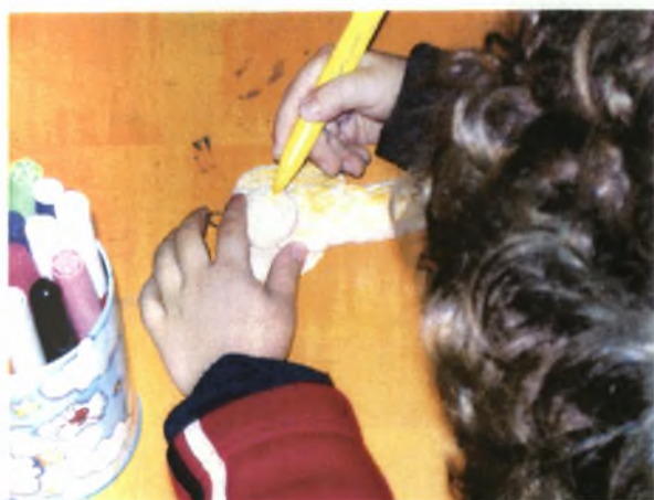
Τα παιδιά δίνουν μορφή στο ζυμάρι τους