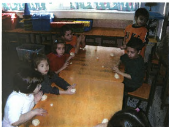
Διαδικασία πλασίματος ζυμαριού