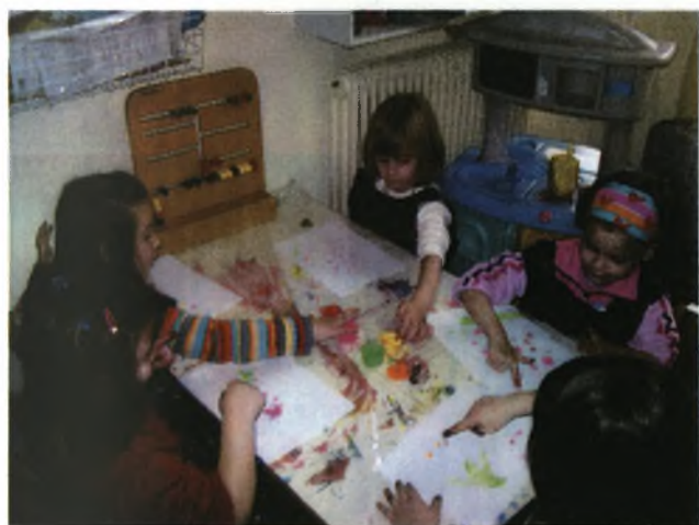
Εφαρμόζοντας την τεχνική δαχτυλοτυπώματος