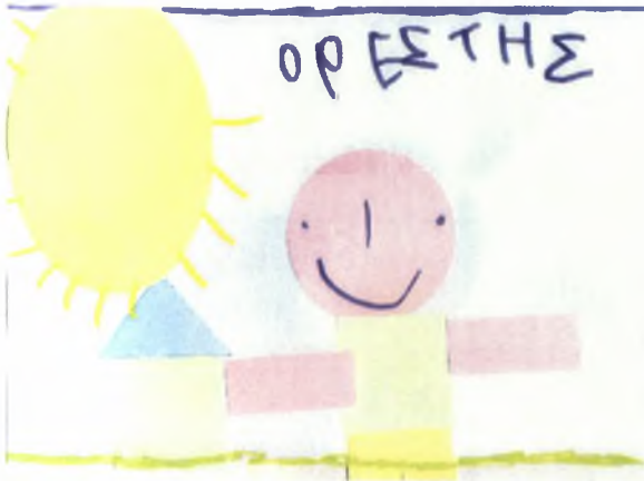
Ορέστης 4χρ.: Σπίτι και ο εαυτός του