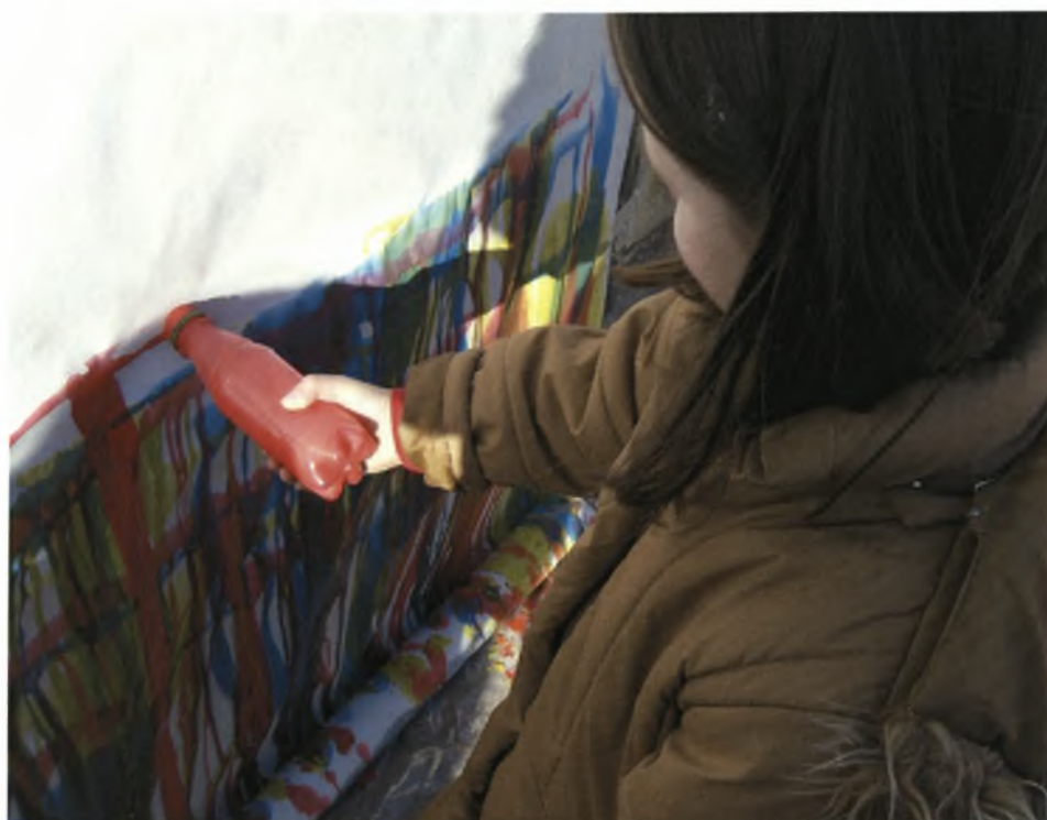
Διαδικασία της τεχνικής «καταρράκτης»