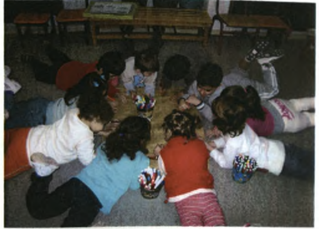
Τα παιδιά σχεδιάζουν στο πάτωμα περίεργα και παράξενα ψάρια