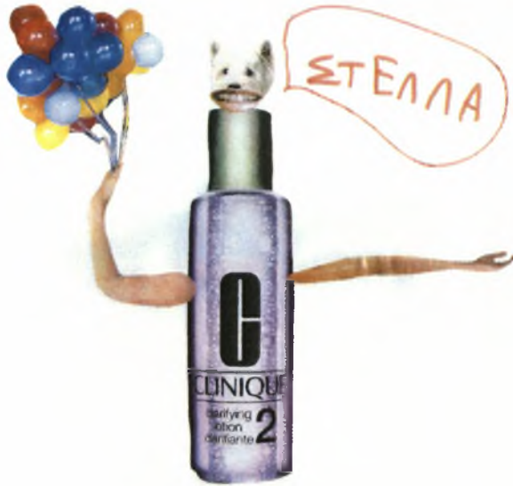
Στέλλα 4 ½ γρ.