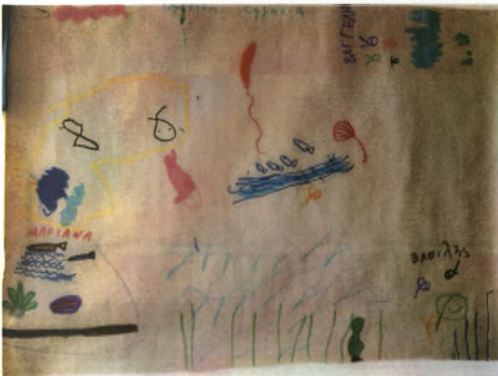
3 ο Νηπιαγωγείο –8 ο Χαραυγής