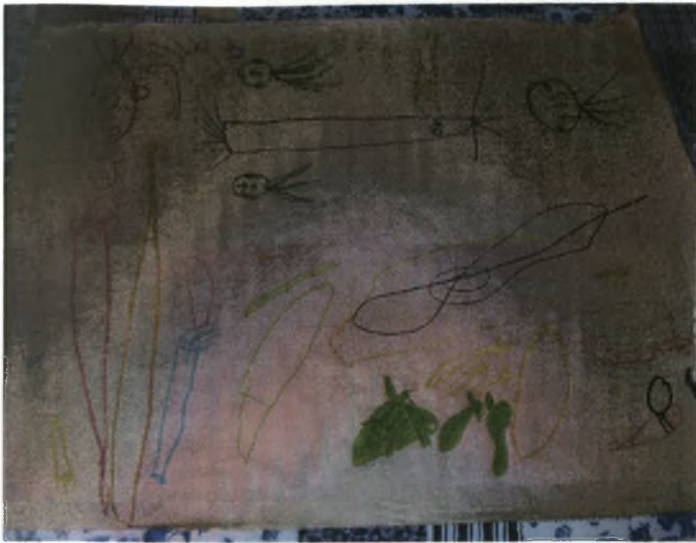
1 ο Νηπιαγωγείο –47 ο Ανθούπολης