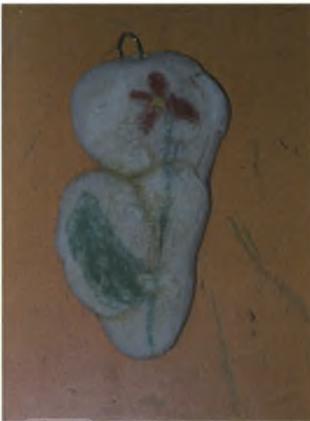
Αγαθή 6χρ.: Λουλούδι