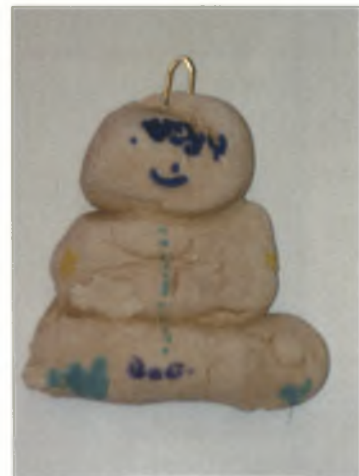
Βασίλης 5 ½ χρ.: Χιονάνθρωπο