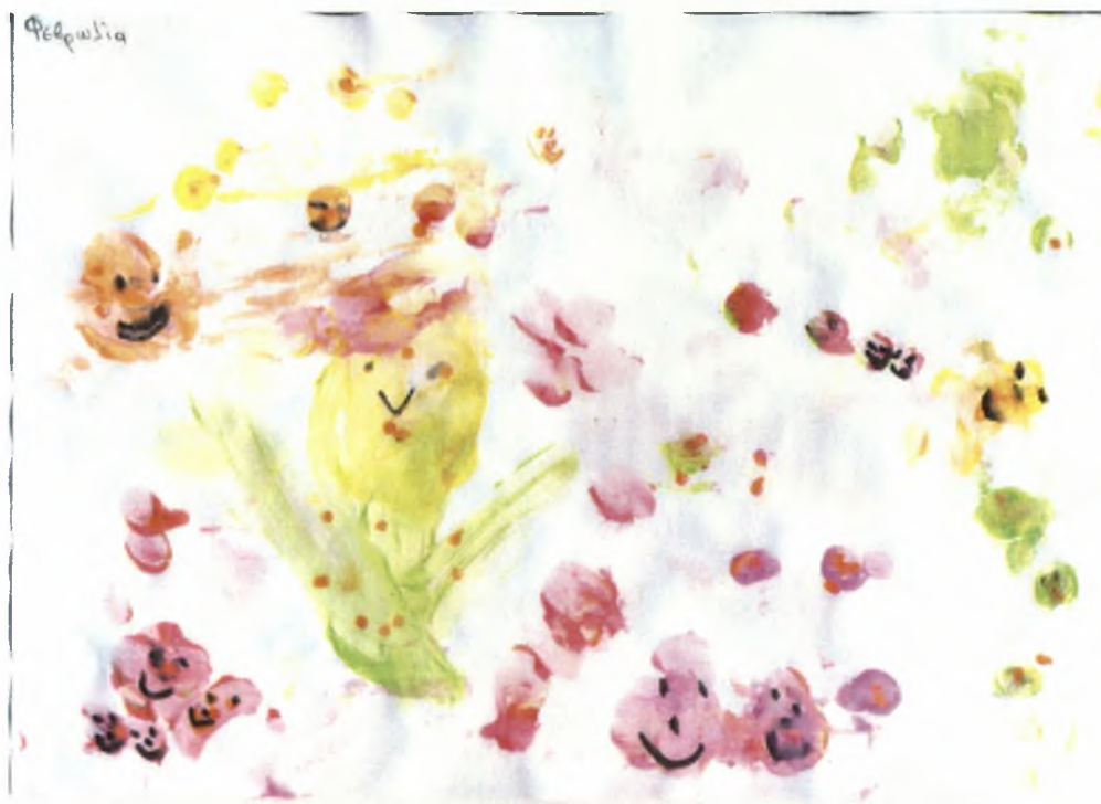
Φεβρωνία 6χρ.: Το τσίρκο της έχει έναν μεγάλο ζογκλέρ που πετάει μπάλες, μία μέλισσα και θεατές