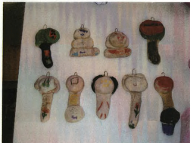
Τελικό αποτέλεσμα: (πάνω αριστερά) καρπουζιά, χιονάνθρωπος, κοριτσάκι, φραουλιά, μηλιά, κινητό, αγοράκι, κοριτσάκι, ακουστικό