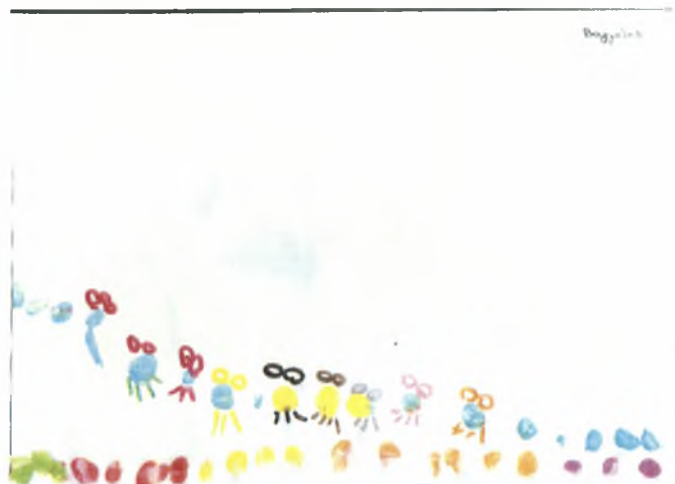
Βαγγέλης 4χρ.: Το τσίρκο του έχει μαμουδάκια, αράχνες σκυλάκια και γατάκια