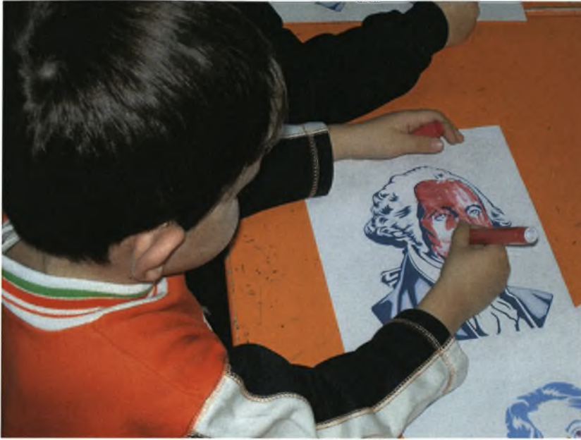
Τα παιδιά βάζουν χρώμα στην ασπρόμαυρη φωτογραφία