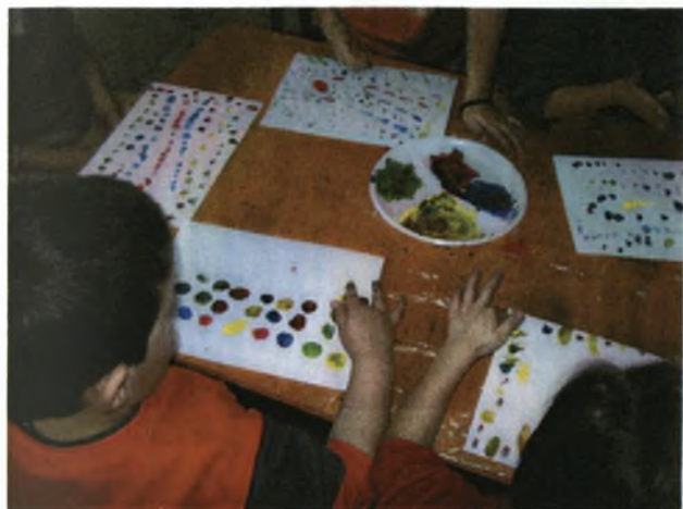
Τα παιδιά κάνουν δαχτυλοτυπώματα