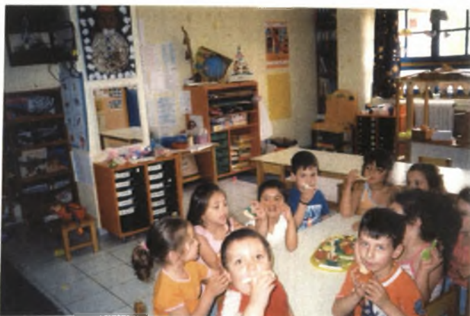
Εικόνα 24: Τρώγοντας τα ζυμαρένια φρούτα