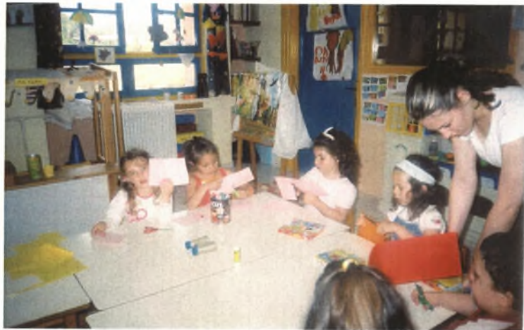
Εικόνα 2: Κατασκευάζοντας τις κάρτες