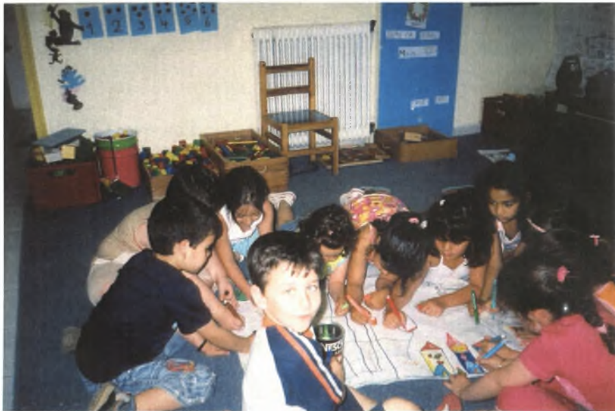
Εικόνα 33: Κατασκευάζοντας το αναμνηστικό δώρο για τα επόμενα παιδιά του νηπιαγωγείου