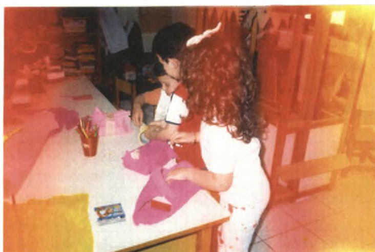
Εικόνα 8: Τυλίγοντας τα δώρα