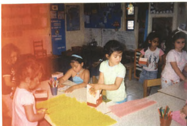
Εικόνα 6: Ετοιμάζοντας τα δώρα των εορταζόμενων