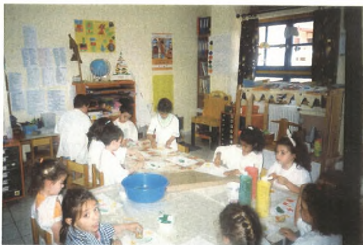
Εικόνα 26: Κάνουμε τυπώματα επάνω στο γαρτί