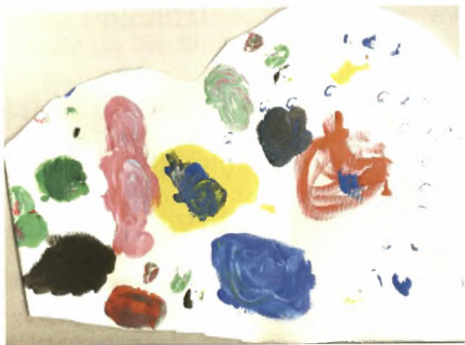
Εικόνα 19: Ένα σουπλά σε σχήμα καρδιάς