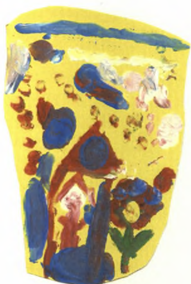
Εικόνα 21: Ορθογώνιο σουπλά με σπίτι και λουλούδια