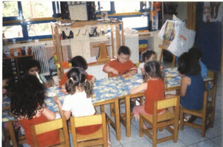
Εικόνα 10: Φτιάχνοντας το φαγητό