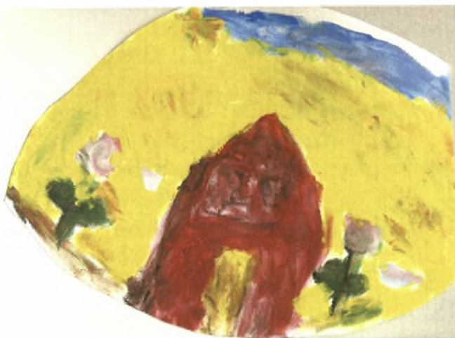
Εικόνα 20: Στρογγυλό σουπλά με σπιτάκι