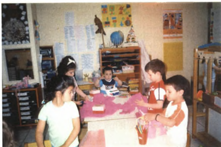
Εικόνα 7: Κόβοντας τα περιτολίγματα