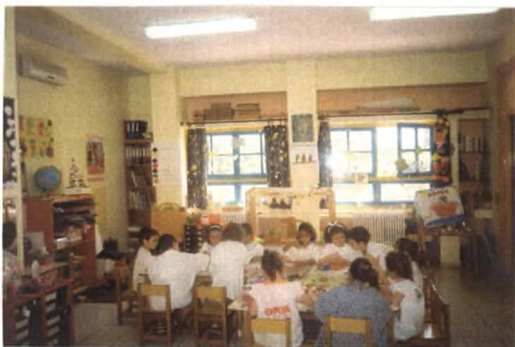
Εικόνα 25: Φτιάχνοντας τις σφραγίδες