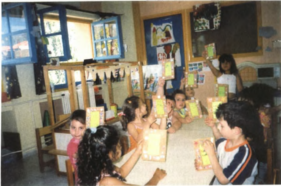
Εικόνα 13: Κορνίζες με καλοκαιρινά υλικά