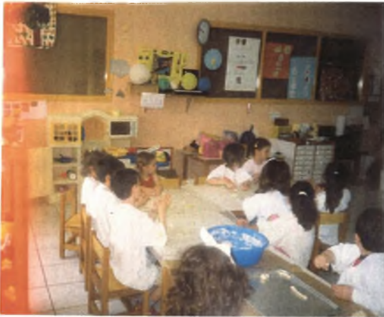
Εικόνα 22: Φτιάχνοντας το ζυμαρί