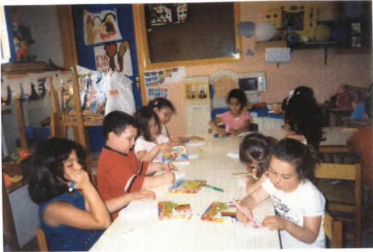
Εικόνα 29: Κατασκευάζοντας την κούκλα