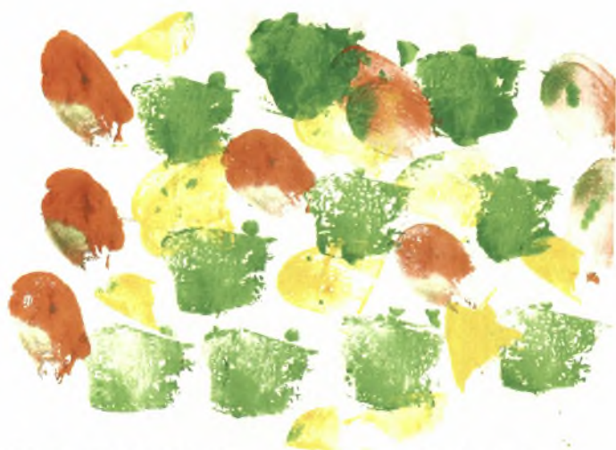
Εικόνα 28: Τυπώματα των παιδιών πάνω σε χαρτί