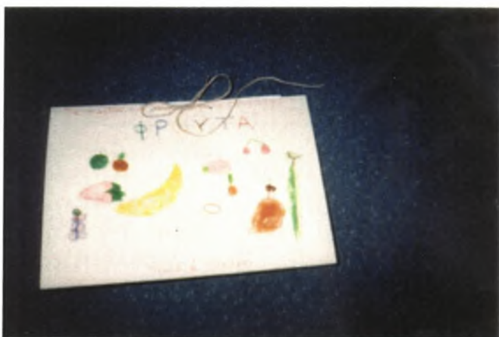
Εικόνα 16: Το βιβλίο των φρούτων είναι έτοιμο