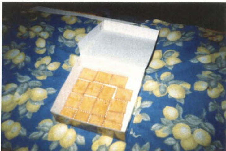
Εικόνα 11: Το φαγητό είναι έτοιμο