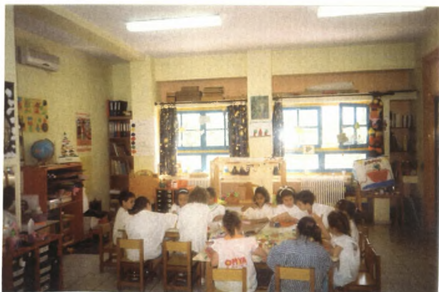
Εικόνα 18: Ζωγραφίζοντας τα σουπλά