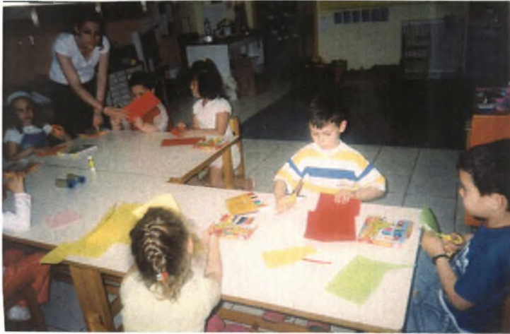
Εικόνα 1: Κατασκευάζοντας τις κάρτες