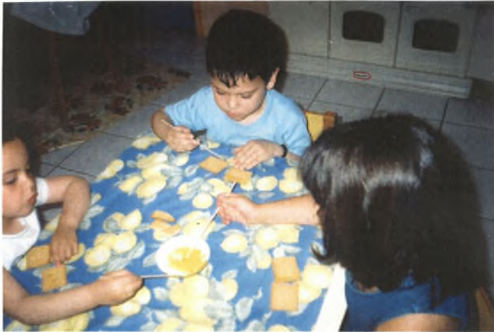
Εικόνα 9: Φτιάχνοντας πρόσωπα για το φαγητό