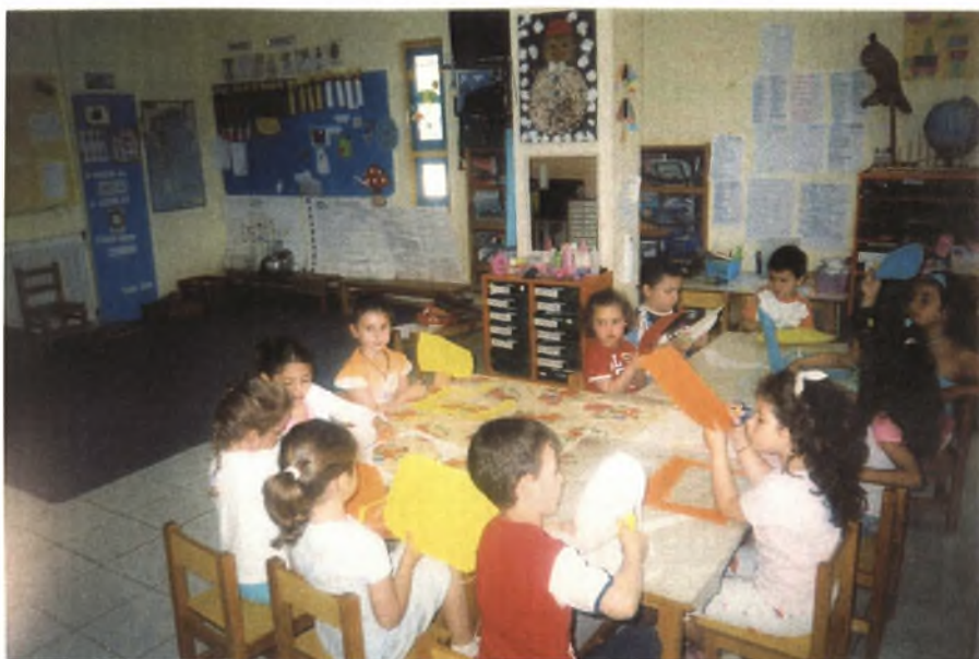
Εικόνα 17: Κόβοντας τα σουπλά