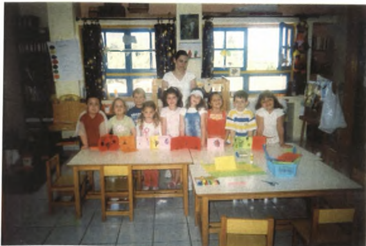
Εικόνα 3: Τα παιδιά με τις κάρτες τους