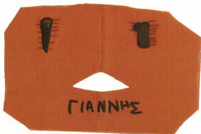
Εικόνα 5: Κάρτα