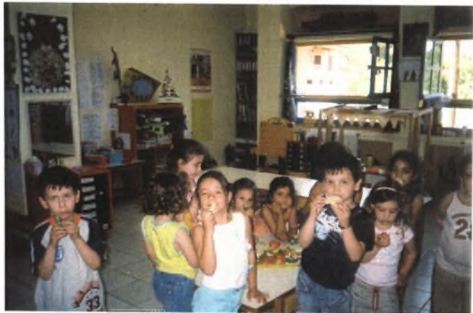
Εικόνα 23: Τρώμε τα ζυμαρένια φρούτα που φτιάξαμε