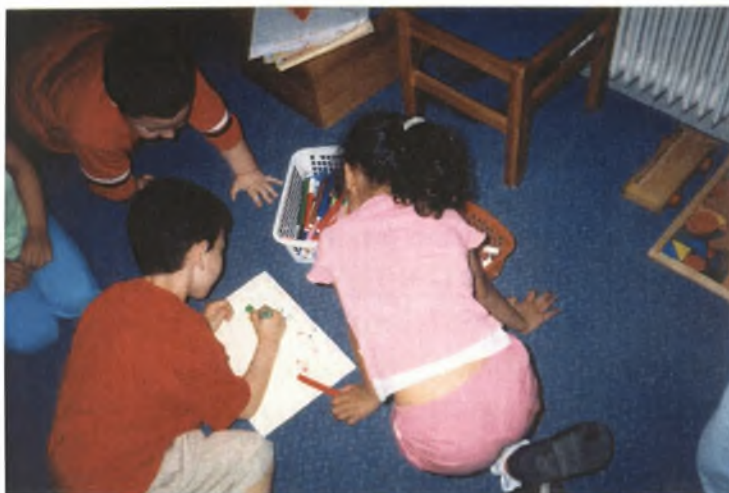
Εικόνα 14: Ζωγραφίζοντας τα φρούτα