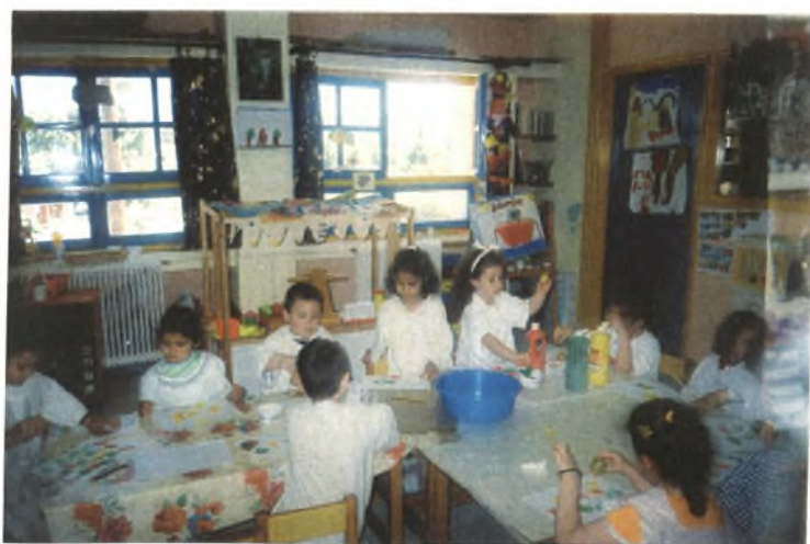
Εικόνα 27: Κάνουμε τυπώματα πάνω στο γαρτί