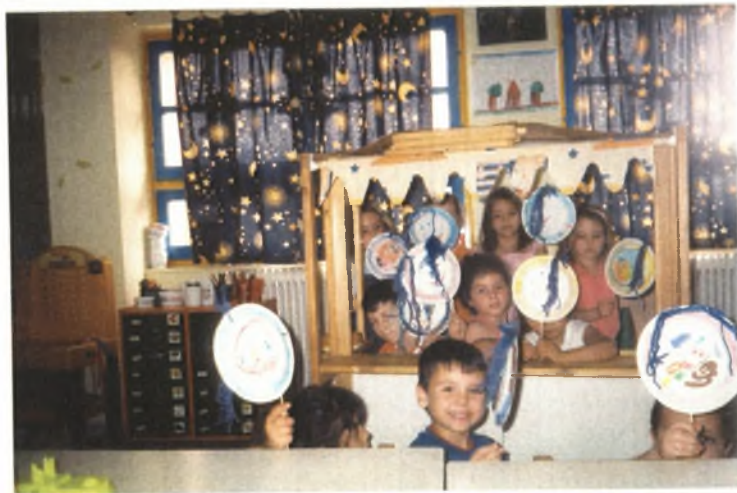
Εικόνα 30: Δείχνουμε τις κούκλες μας