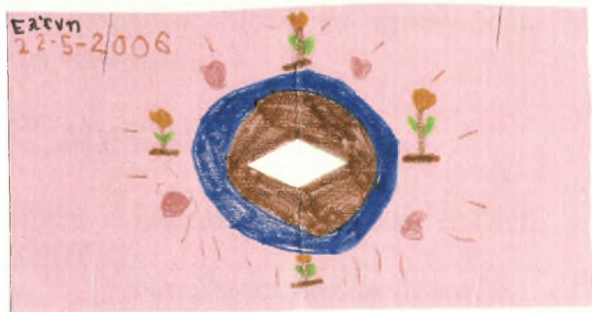
Εικόνα 4: Κάρτα