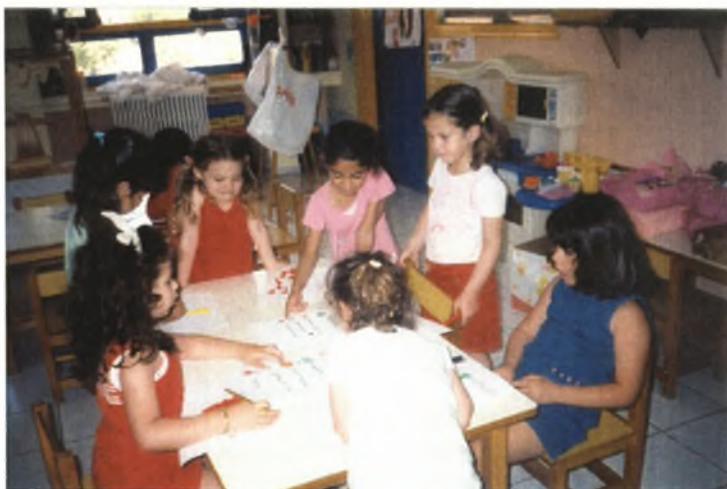
Εικόνα 15: Γράφουμε τα ονόματα των φρούτων