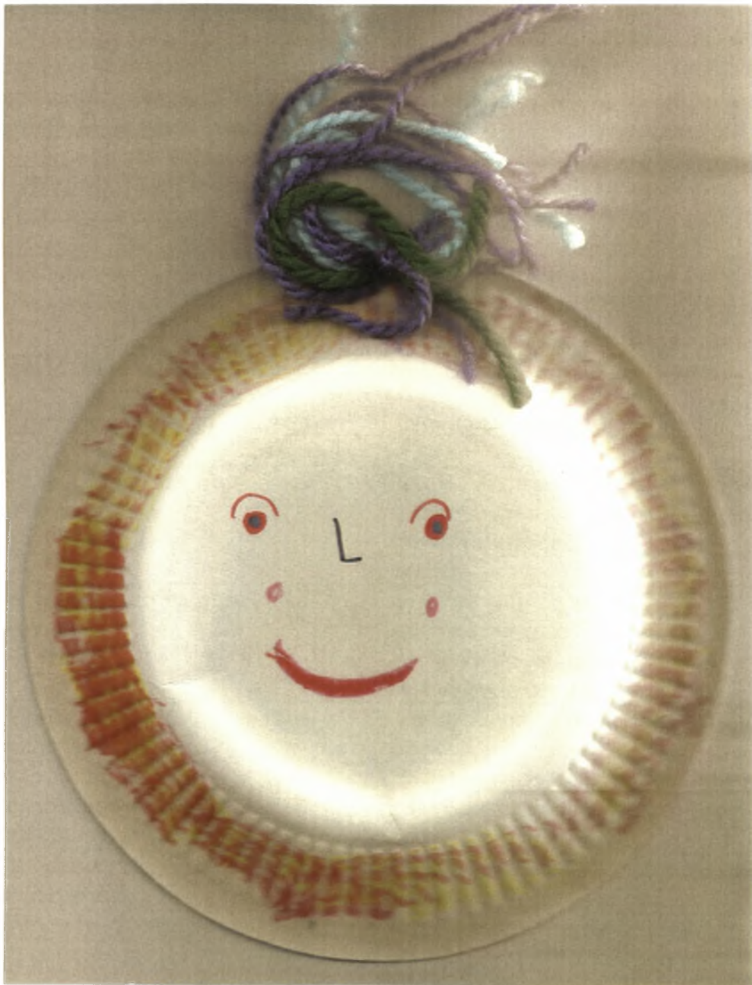
Εικόνα 32: Κούκλα που κατασκεύασε ένα από τα παιδιά