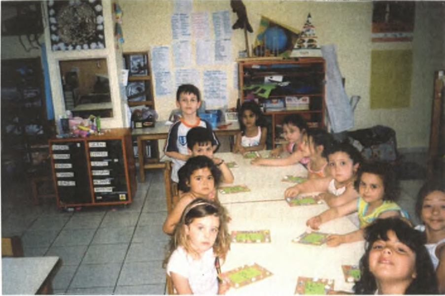
Εικόνα 12: Κορνίζες με καλοκαιρινά υλικά