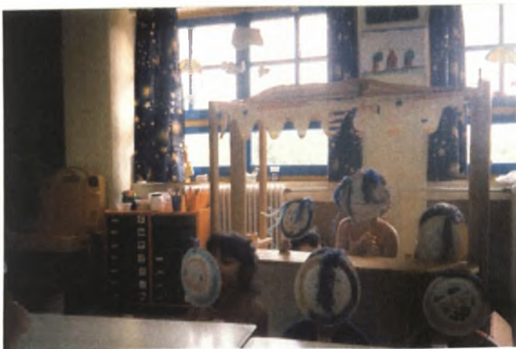
Εικόνα 31: Παίζοντας με τις κούκλες