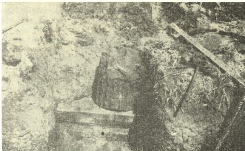
Εἰκ. 12. Ὁ κατώτερος κατὰ χώραν σπόνδυλος τοῦ ἀναστηλωθέντος κίονος.