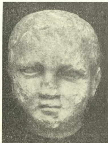
Εἰκ. 7. Κεφαλαὶ παιδῶν εὐρεθεῖσαι κατὰ τὴν βορειάν πλευρὰν τοῦ ἀναλήμματος τοῦ ναοῦ τοῦ 4 ου π.Χ. αἱ.