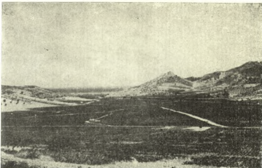
Εἰκ. 1. Ἡ κοιλάς τῆς Βραυρῶνος ἀπὸ Δ.