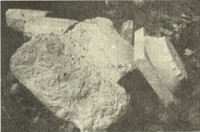
Εἰκ. 15. Σπόνδυλοι τῆς Δυτικῆς πλευρᾶς τῆς στοᾶς μετὰ ἀνευρεθέντος μαρμαρίνου κιονοκράνου.

Χρονολογεῖ δὲ ὁ Stevens τὴν στοᾶν ταύτην εἰς τὴν Κιμώνειον περίοδον περὶ τὰ μέσα περίπου τοῦ 5 ου π.Χ. αἰῶνος. Ἄλλ' ἡ χρονολογία τῆς στοᾶς τῆς Βραυρῶνος πρέπει, ἐκ τῶν μέχρι σήμερον δεδομένων, νὰ εἶναι μεταγενεσιτέρα καὶ δὴ περὶ τὸ τελευταῖον τέταρτον τοῦ αἰῶνος. Εἶναι λοιπὸν πιθανόν, ἐὰν θεωρήσωμεν τὴν χρονολογίαν τοῦ Stevens ἀσφαλῆ, ὅτι ἡ στοᾶ