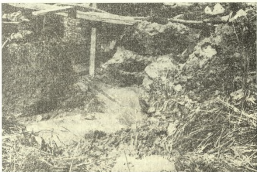
Εἰκ. 13. Βορειοανατολικὴ γωνία τοῦ στυλοβάτου.