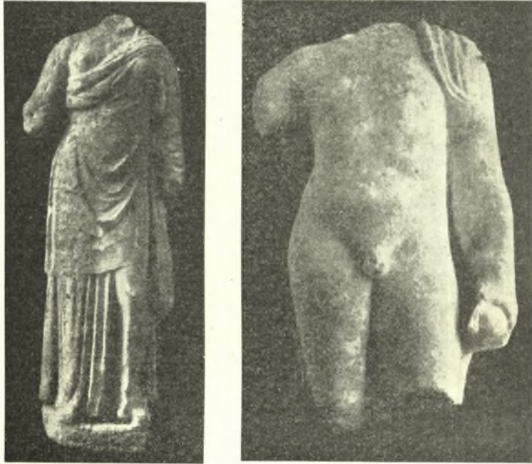
Εἰκ. 9. Ἀναθηματικά μαρμάρινα ἀγάλματα.

Ἐνάλογος διάταξις παρατηρήθη καὶ κατὰ τὴν δυτικὴν πλευρὰν, ἔξ οὗ νομίζω ὅτι τοῦτο δὲν εἶναι τυχαῖον καὶ ὅτι δὲν δύναται νὰ ἀποδοθῇ εἰς ὑπὸ τῶν μεταγενεστέρων ἀφαίρεισιν τῶν μαρμαρίνων πλακῶν τοῦ στυλοβάτου, ὡς θὰ ἠδύνατό τις νὰ ὑποθέσῃ. Κατὰ τὴν βορειοανατολικὴν γωνίαν καὶ εἰς ἀπό-