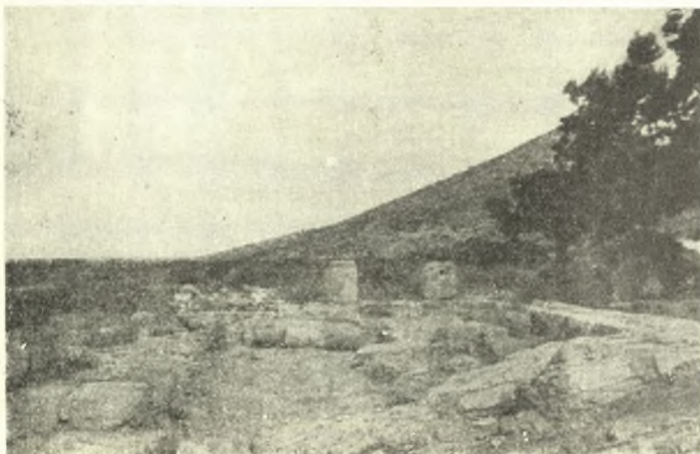
Εἰκ. 2. Ἐπιπέδον τοῦ ναοῦ ἐκ Δ. μετὰ τὴν ἀναστήλωσιν δύο σπονδύλων ἐκ κίωνων τῆς Ἀνατολικῆς πλευρᾶς.