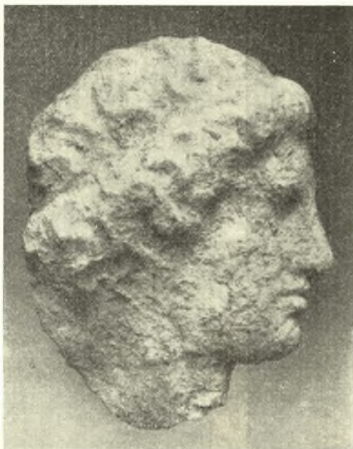
Εἰκ. 8. Μαρμαρινὴ γυναικεία κεφαλὴ τῶν ἀρχῶν τοῦ δευτέρου ἡμίσεος τοῦ 5 ου π.Χ. αἰ.

ὅπερ μόνον τῇ βοηθείᾳ τοῦ γερανοῦ ὑπῆρξε δυνατὸν νὰ καθορισθῇ ὀπωσοῦν ἀκριβῶς. Διότι ἐνῶ οἱ δύο ἀνώτεροι σπόνδυλοι, οἵτινες εὐρέθησαν κατερριμμένοι πλαγίως πρὸς νοτιὰν διεύθυνσιν, ἐσφίζοντο ἀκέραιοι, ὁ κατὰ χώραν ἐπὶ τοῦ στυλοβάτου ὄρθιος κατώτατος ἦτο, κατὰ τὴν ἄνω αὐτοῦ ἐπιφάνειαν,