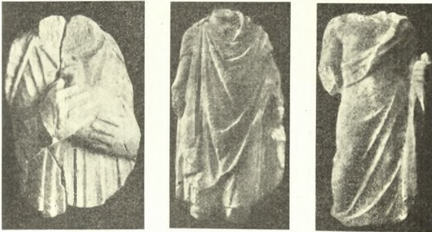
Εἰκ. 10. Μαρμάρινα ἀναθηματικά ἀγάλματα.

Κατὰ τὴν βορείαν πλευρὰν δὲν ἀνέσκαψα εἰμὴ κατὰ διαστήματα ὑπολογισθέντα συμφώνως πρὸς τὰ κατὰ τὴν βορειοανατολικὴν γωνίαν μετρηθέντα μετακίονια. Εὐρέθησαν οὕτως αἱ θέσεις τῶν λοιπῶν κίωνων, τῶν ὁποίων σχεδὸν πάντων οἱ κατώτεροι σπόνδυλοι εὐρίσκονται κατὰ χώραν ἐπὶ