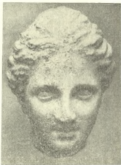
α β Εἰκ. 6. Μαρμάρινα κεφαλαὶ κορασίδων 4 ου π.Χ. αἱ.