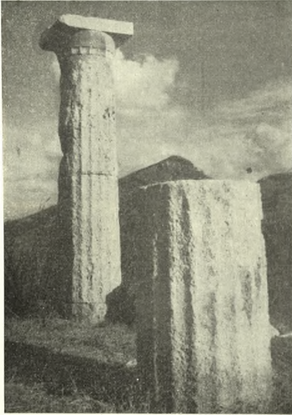
Εἰκ. 14. Ὁ ἀναστηλωθεὶς κίον τῆς ΒΑ γωνίας τῆς στοᾶς.

ἐγγεγλυμμένης εἰς βάθος 0.01. Κατὰ τὴν ἔξω πλευρὰν τῆς καθέτου ἐπιφανείας αἱ πλάκες τοῦ στυλοβάτου ἦσαν ἄπεργοι πλὴν μιᾶς στενῆς ταινίας ὕψ. 0.05, ὅπερ δεικνύει πιθανῶς τὸ πάχος τῶν πλακῶν τοῦ δαπέδου τῆς στοᾶς.