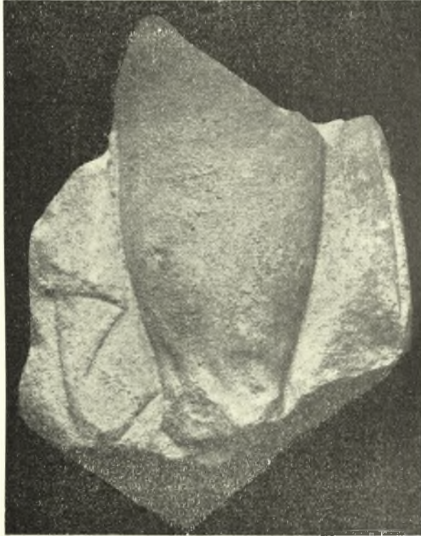
Εἰκ. 11. Τεμάχιον ἐξ ἀρχαικοῦ ἀναγλύφου τῶν ἀρχῶν τοῦ 5 ου π.Χ. αἱ.

ὀφείλεται εἰς τοὺς αὐτοὺς αἰσθητικοὺς λόγους, οἵτινες ἐπέβαλον τὴν σμί- κρυνσιν τῶν ἐξωτερικῶν γωνιαίων μετακινιῶν τῶν ναῶν, δεδομένου ὅτι