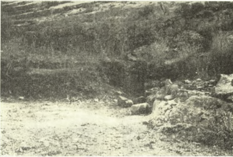
Εἰκ. 4. Μικρὸν ἱερὸν οἰκοδόμημα ἀνατολικώτερον τοῦ μικροῦ ἱεροῦ.

2. Ὅπισθεν τοῦ μικροῦ ἱεροῦ πρὸς ἀνατολὰς ἔξετέλεσα μικρὰν δοκι-