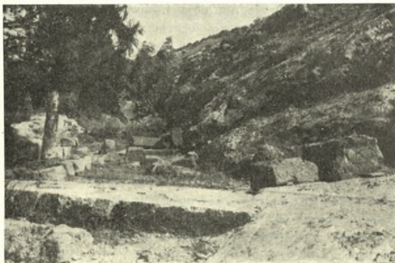
Εἰκ. 3. Τοῖχος βαίνων ἐκ τοῦ ναοῦ πρὸς τὸ μικρὸν ἱερόν. Ἐπιπέδον ἐκ Δ.