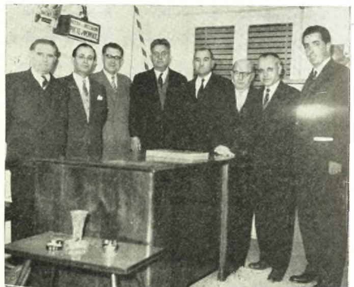
Τὸ Διοικητικὸν Συμβούλιον τῆς ἐν Θεσσαλονίκῃ Λέσχης τῶν Θεσσαλῶν «Ρήγας Φεραῖος» (1961 - 1962), τοῦ σωματείου μετὰ τὴν λαμπρὰν δρᾶσιν, πού τιμᾶ τὸ θεσσαλικὸν ὄνομα εἰς τὴν συμπρωτεύουσαν.