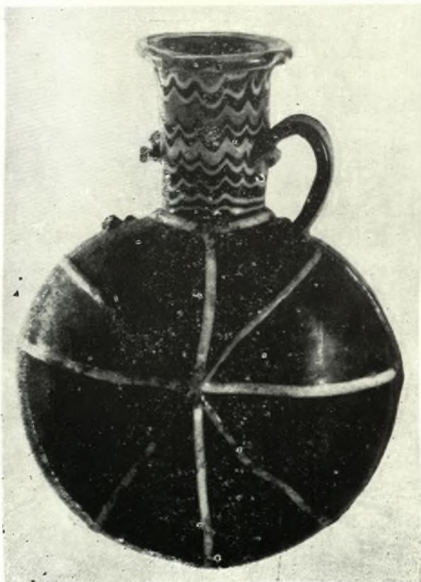
ΕΙΧ. 2. - Egyptian Glass Flask in private collection.