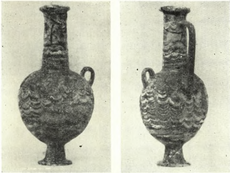
Είχ. 1. - Glass Flask from Amnisos in Heraclion Museum. Left: front view; right: back view.