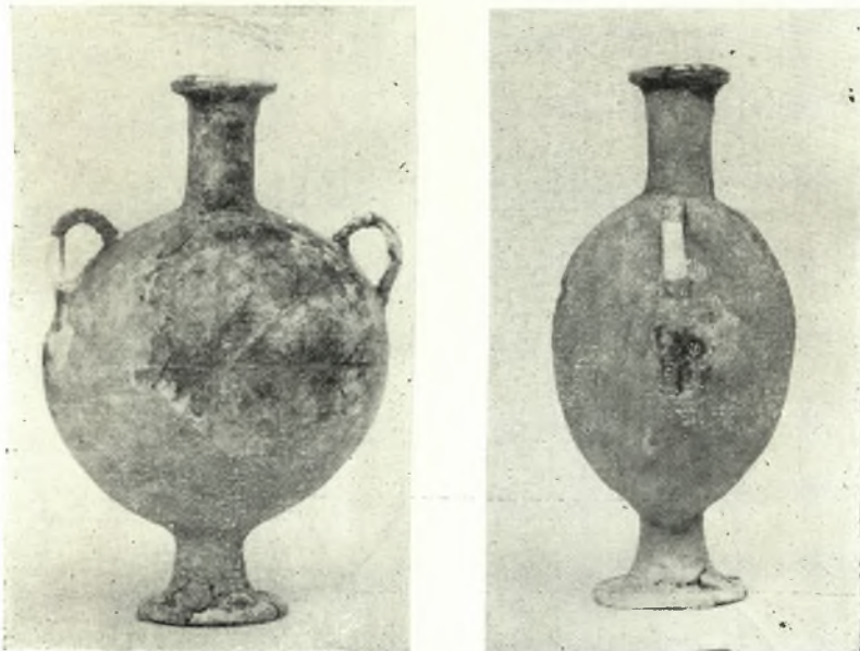
Είχ. 2. - Glass Flask from Phaistos in Heraclion Museum. Left: front view; right: side view.