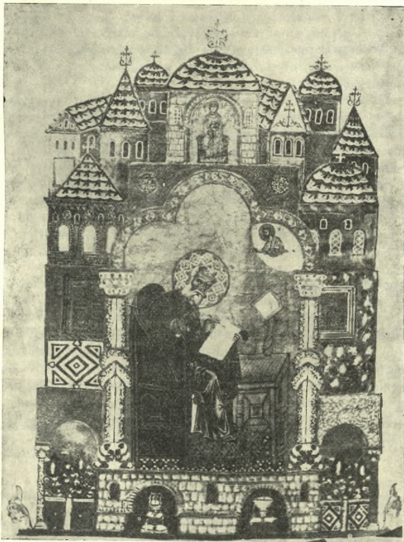
Εἰκ. 1. Ὁ Ἅγ. Γρηγόριος ὁ Ναζιανζηνός. Μικρογραφία ἐν ἀρχῇ τοῦ Σιναΐτικοῦ κώδ. 339.

Τούτων τὸ ἀριστερὸν ἔχει πυραμιδοειδῆ στέγην καὶ φέρει εἰς τὸν ἄνω ὄρο- φον τρία ἀνοίγματα, εἰς δὲ τὸν κάτω παράθυρον κλειστόν, ὑπ' αὐτὸ δὲ