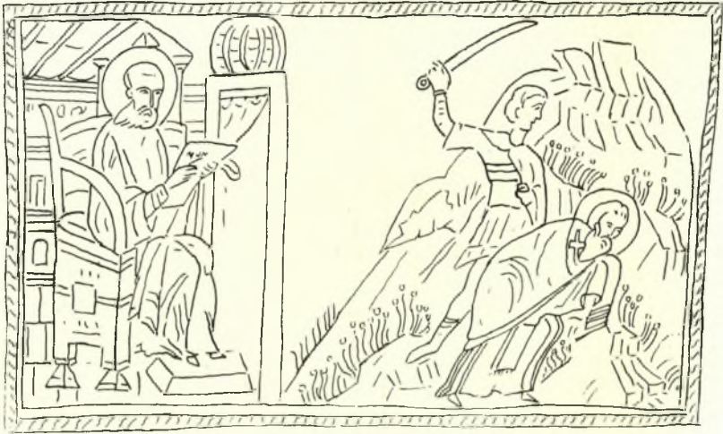
Εἰκ. 4. Ἁγ. Γρηγόριος ὁ Ναζιανζηνός—Μαρτύριον τοῦ Ἁγ. Κυπριανοῦ. Μικρογραφία τοῦ ὑπ' ἀριθ. 543 κώδ. τῆς Ἐθν. Βιβλιοθήκης τῶν Παρισίων.

Ἐὰν ἐξετάσῃ τις λεπτομερῶς τὸ πολύπλοκον τοῦτο ἀρχιτεκτόνημα, θὰ παρατηρήσῃ ὅτι τὰ ἀπαρτίζοντα αὐτὸ στοιχεῖα εὐρίσκονται πάντα εἰς τὴν