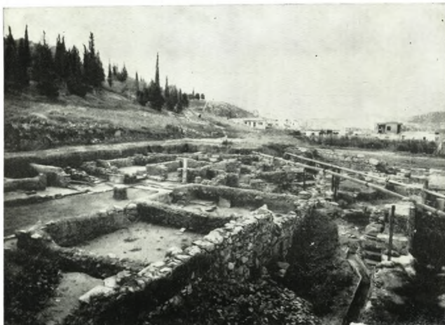
α. Ἐποψὶς τοῦ ρωμαϊκοῦ οἰκοδομήματος ἀπὸ Βορρᾶ.