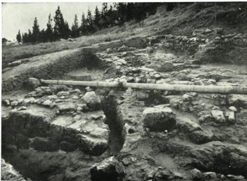
β. Πυλὶς ἐπὶ τοῦ τείχους τῆς δυτικῆς πλευρᾶς τοῦ Πεισιστρατείου περιβόλου.