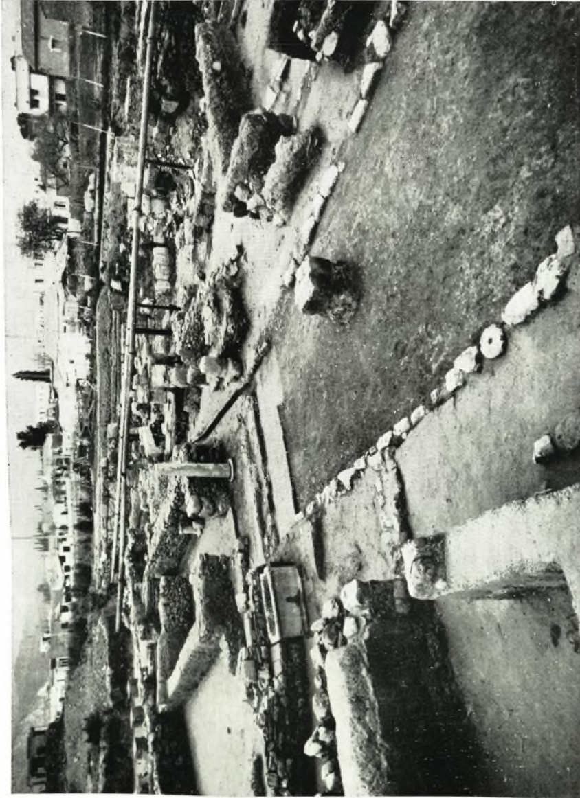
Ἐπιτομή τοῦ ρωμαϊκοῦ οἰκοδομήματος ἀπὸ Νότον.