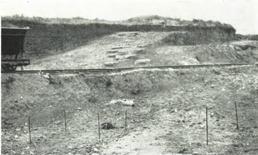
α. Λείψανα τῶν λιθίνων βαθμίδων τοῦ δυτικοῦ τμήματος τοῦ κοίλου τοῦ θεάτρου τῆς Ἡλίδος.