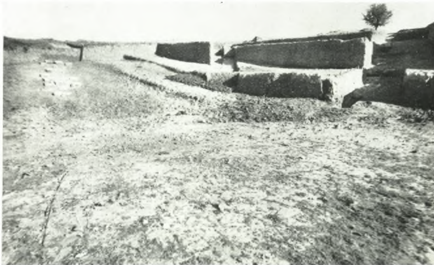
β. Ἀποψις ἐκ τῆς ὀρχήστρας τῶν ἀκτινωτῶν τάφρων τοῦ ἀνατολικοῦ τμήματος τοῦ κοίλου τοῦ θεάτρου τῆς Ἡλίδος.